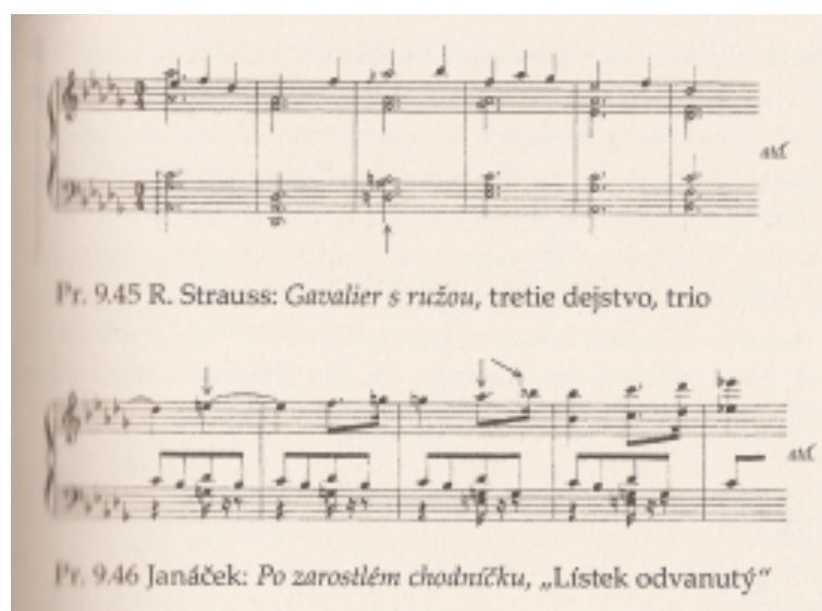
Obrázek 2: Scrutonovy příklady nebanálního postupu skladatelů v užití zmenšeného septakordu (R. Strauss, Janáček). Tamtéž, 269.

„ Sentimentálnost v instrumentálnej hudbe slyšime stejně zřetelně jako v lidském hlase: od extrémně sladkého snění (Mantovaniho smyčcový orchestr) po trochu příliš požitkářské ztvárnění hlubokého citu (Čajkovského Šestá); od flagrantního erotismu (Straussův Don Juan) po prostý náznak koketnosti (Mendelssohnova Jarní