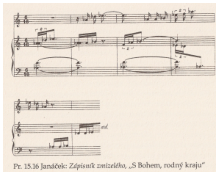
Obrázek 4: Nesentimentální použití pentatoniky v Zápisníku zmizelého Leoše Janáčka. Tamtéž, 442.

Ze Scrutonových myšlenek o sentimentalitě není zcela jasné její postavení ke kýči. O kýči hovořil odděleně jako o případu nejzvrácenějšího hudebního díla. Sentimentalita se zdá být méně špatná než kýč. V knize Understanding Music , která byla publikovaná o dvanáct let později, pracoval Scruton s konceptem kýče častěji. Zmínil pouze rozdíl mezi originálním hudebním sentimentem a kýčem v přirovnání jako mezi živoucím a neživotným, inspirovaným a stereotypním, „jako mezi The Beatles a U2 .“ 214 Rovněž rozlišoval mezi skutečným sentimentem a falešným. Právě falešný sentiment má ke kýči blíž, až se jím stává. 215