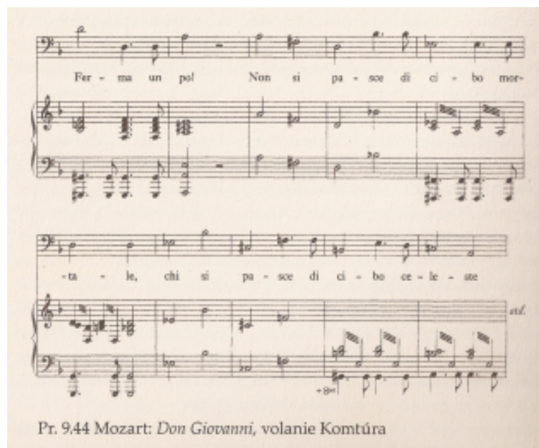
Obrázek 1: Příklad nebanálního použití zmenšeného septakordu v případě postupu Mozarta. Scruton, Hudobná estetika , 268.