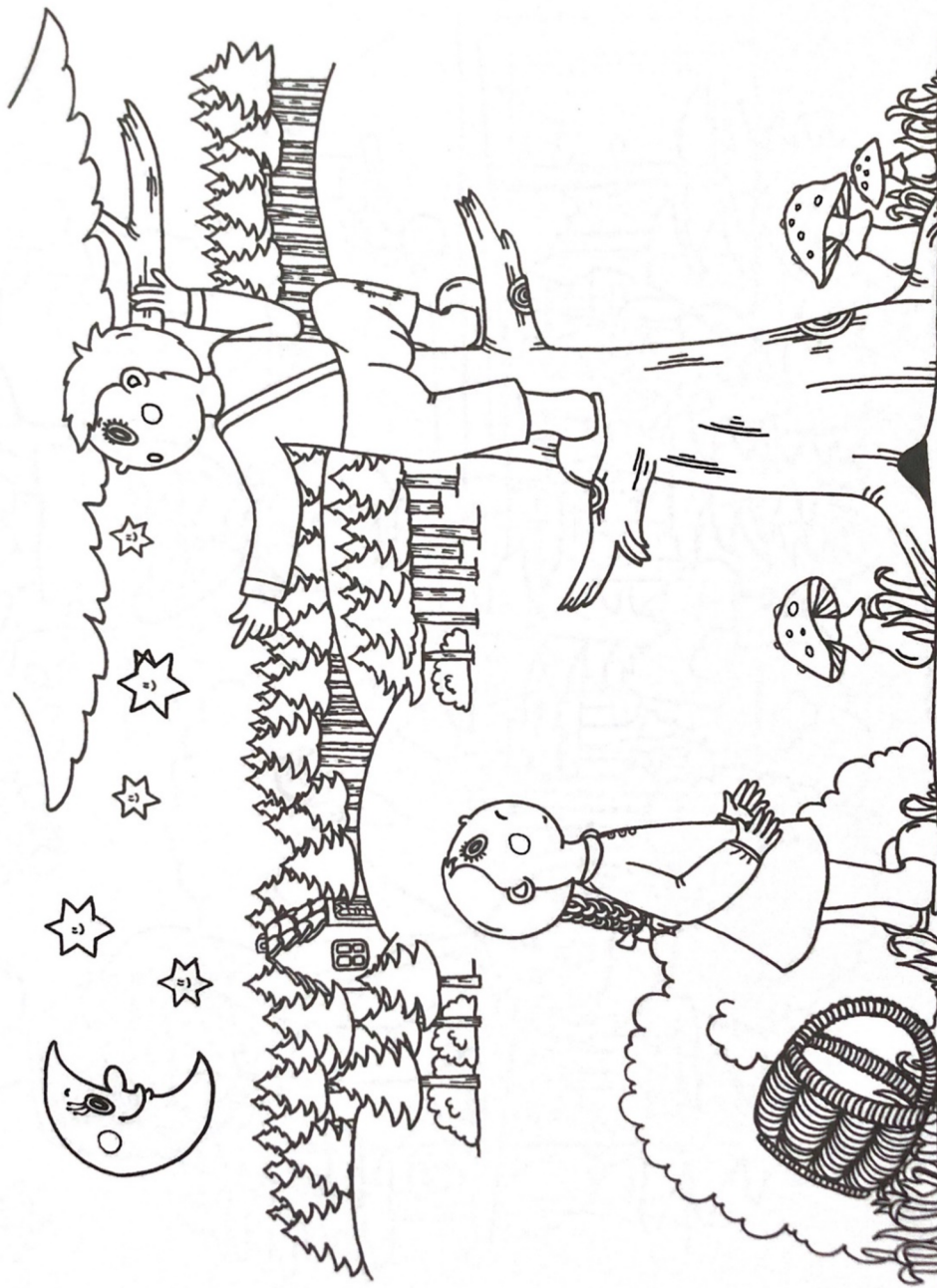
Obrázek č. 10: Omalovánka