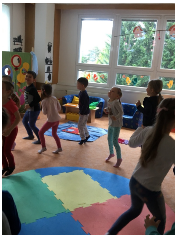
Obrázek č. 5: Štronzo