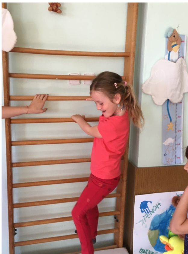
Obrázek č. 3: Cesta lesem – hra na nástroje