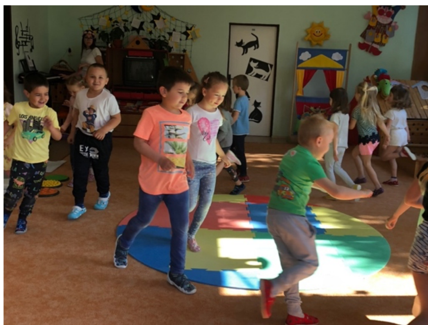
Obrázek č. 8: Pozor liška