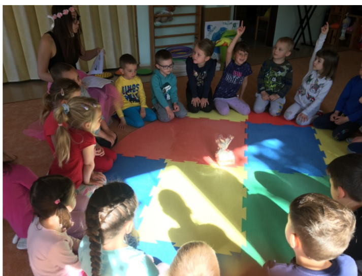
Obrázek č. 2: Komunitní kruh – čtení pohádky