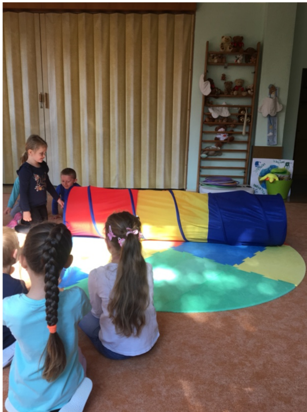
Obrázek č. 1: Procházení tunelem

Rodiče souhlasili se zveřejněním fotek jejich dětí do této bakalářské práce, ale z důvodu ochrany osobních údajů GDPR není zde uveden. Souhlasy rodičů jsou založeny.