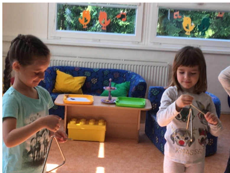
Obrázek č. 4: Překážková dráha - žebřiny