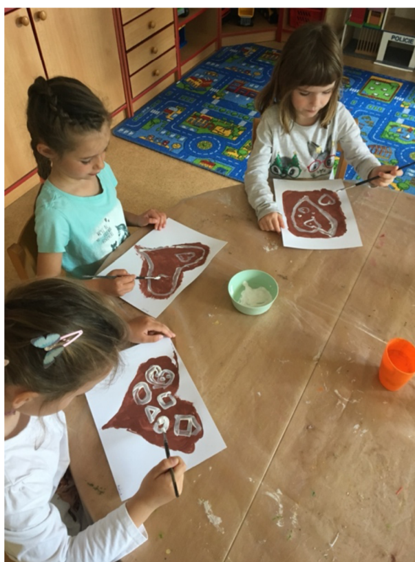
Obrázek č. 6: Zdobení papírových perníků