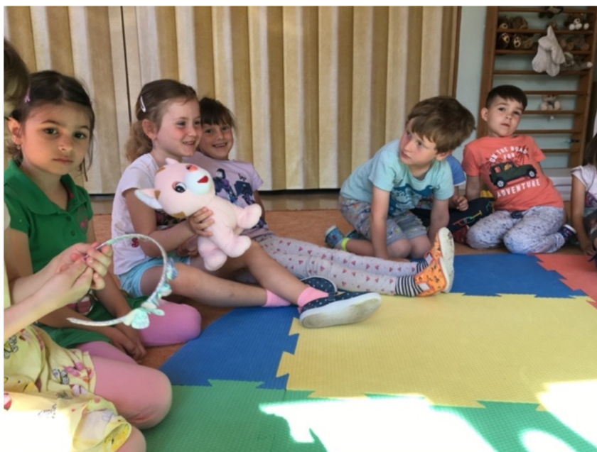
Obrázek č. 7: Asociační kruh