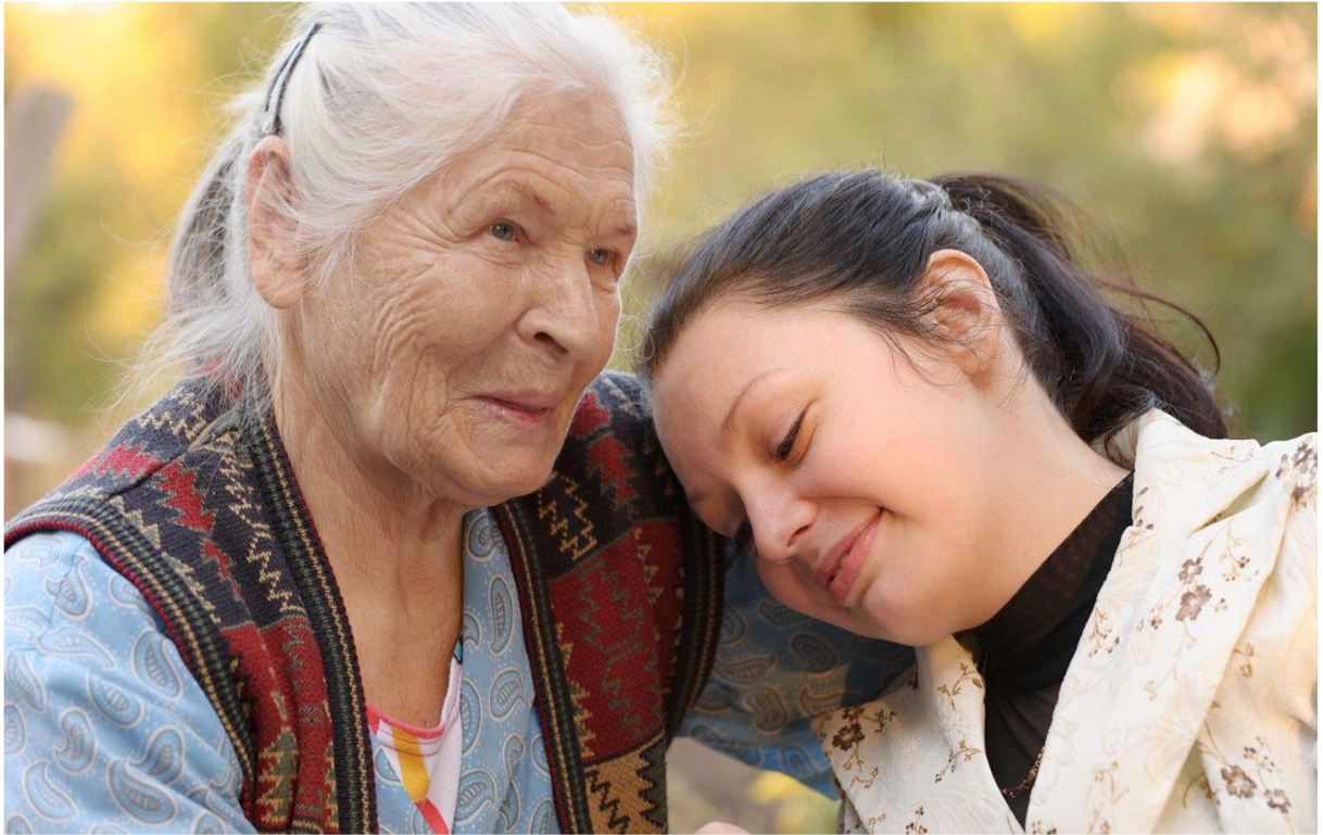
Obrázek 1