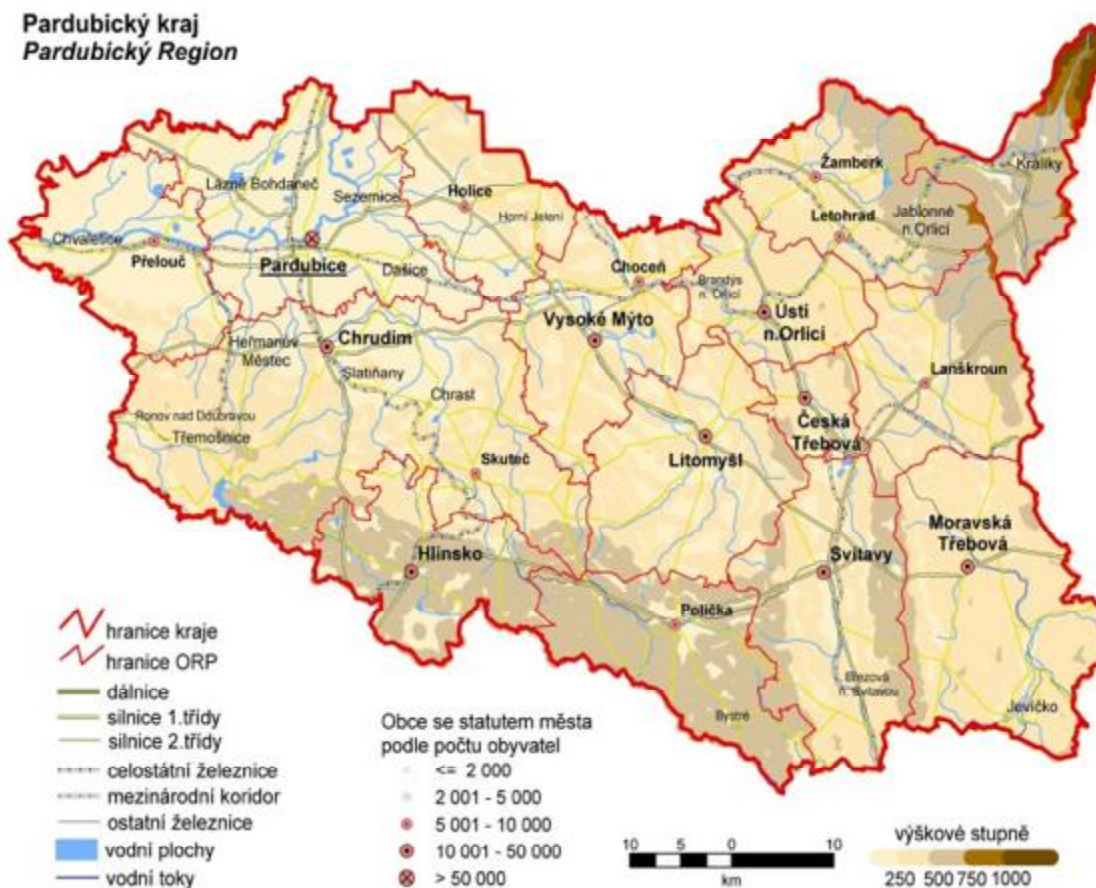
Obrázek č. 1 – Mapa Pardubického kraje

Pardubický kraj v minulosti již existoval, v historii se objevuje poťetí. Poprvé v polovině 19. století, kdy bylo Království české rozděleno na sedm krajů a Pardubický kraj se rozkládal na území okresů Kostelec nad Černými lesy, Chrudim, Lanškroun, Litomyšl, Pardubice, Vysoké Mýto, Čáslav, Kolín, Kutná hora, Chotěboř a Německý Brod, podruhé v roce 1949, kdy Pardubický kraj zahrnoval celé historické Chrudimsko, část někdejšího Čáslavska včetně Chotěboře, a tvořily ho okresy Čáslav, Hlinsko, Holice, Chotěboř, Chrudim, Lanškroun, Litomyšl, Pardubice, Polička, Přelouč, Ústí nad Orlicí a Vysoké Mýto.