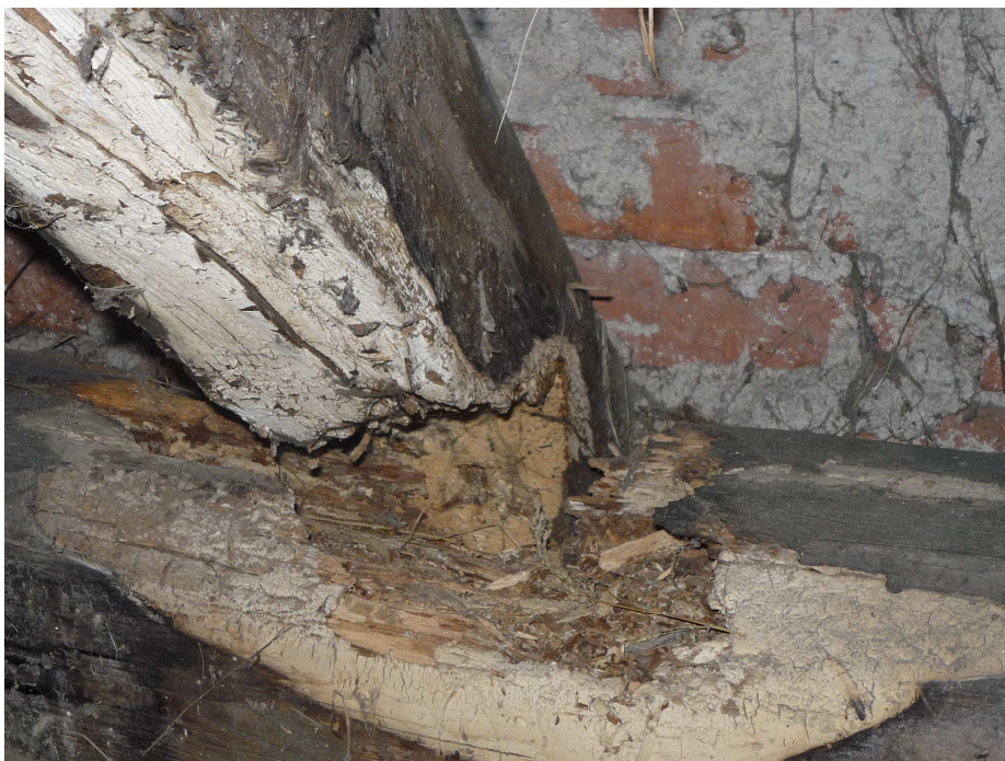
Příloha č. 12 Krokev napadená dřevomorkou domácí (Zdroj: autor, 2016)