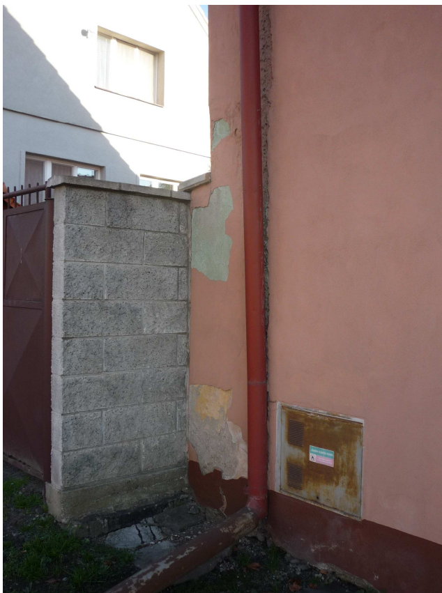
Příloha č. 30 Biogenní porucha fasády (Zdroj: autor, 2016)