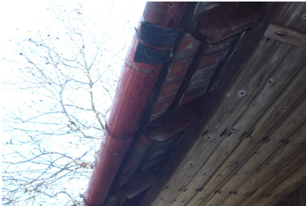
Příloha č. 20 Absence okapu nad vikýřem