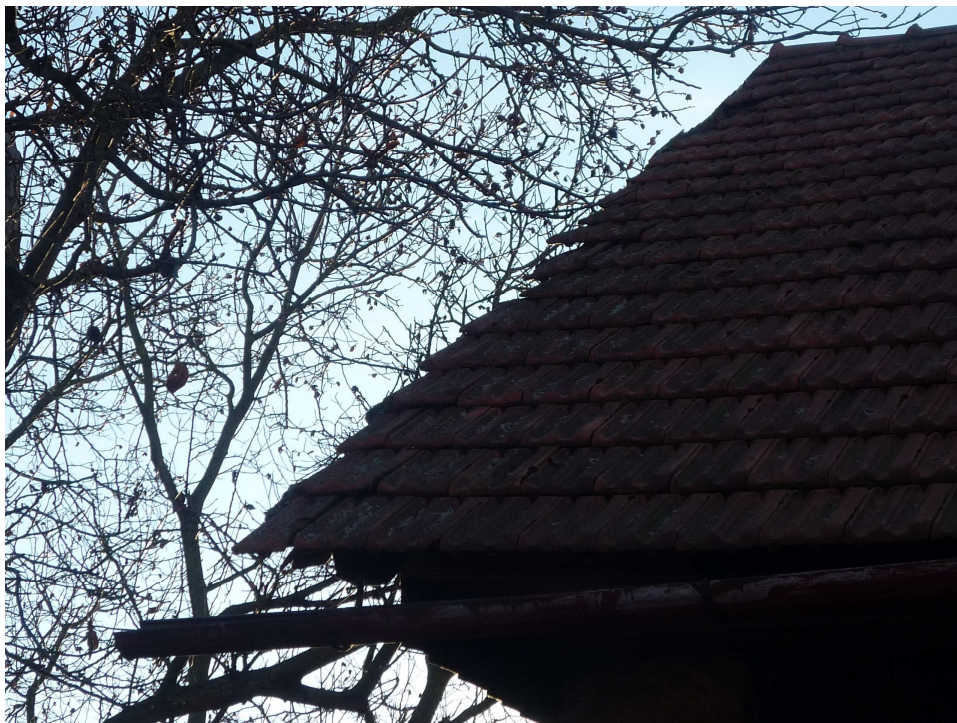
Příloha č. 18 Chybějící napojení na dešťovou kanalizaci