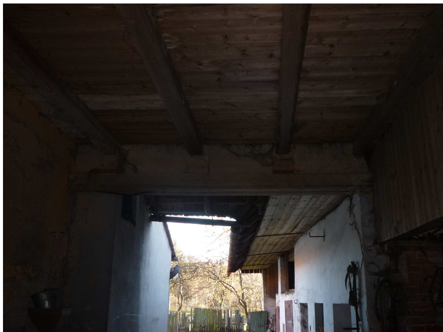
Příloha č. 6 Napadení dřevokaznou houbou