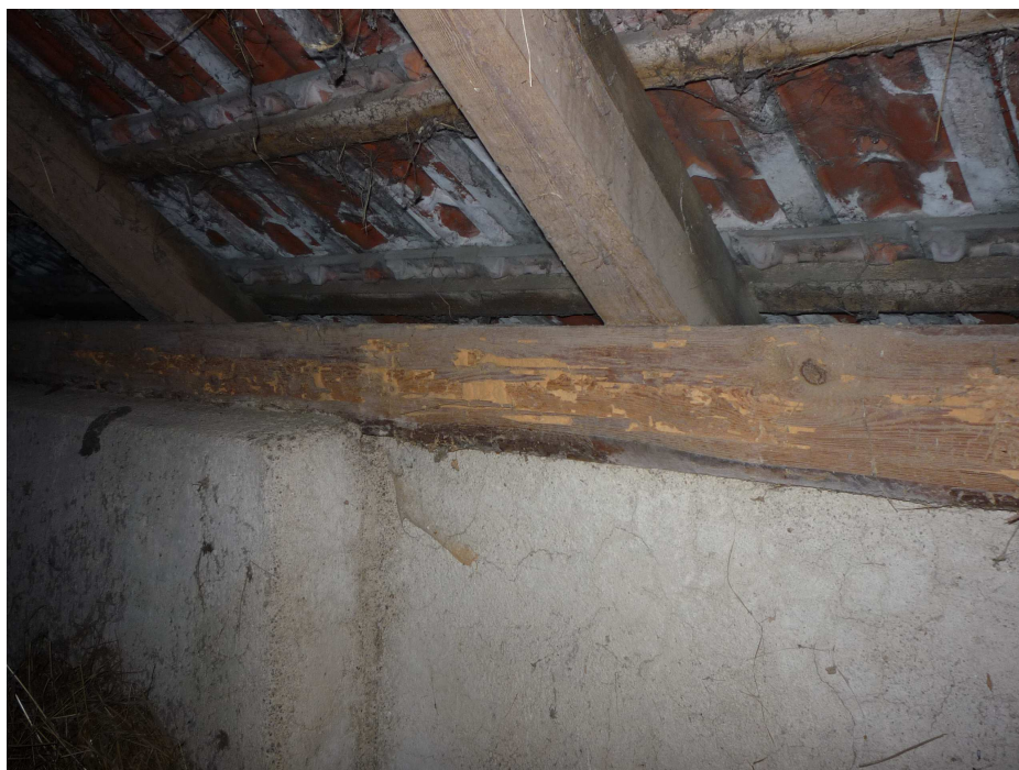
Příloha č. 14 Degradace střešní krytiny