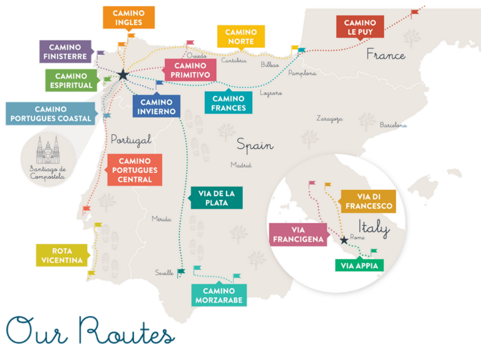
Obrázek č. 1 Mapa s vyznačenými trasami vedoucími do Santiaga de Compostela (Camino de Santiago Routes, 2021)