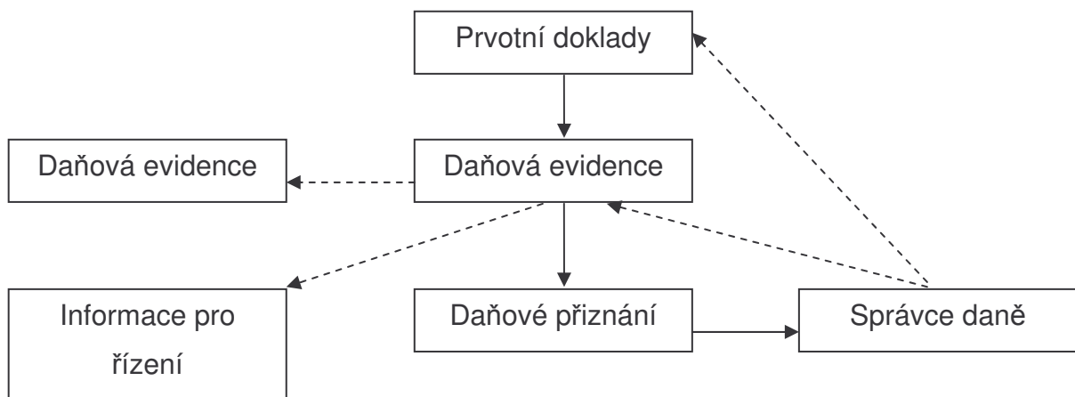
Tabulka 1: Schéma vedení daňové evidence

Zdroj: SEDLÁČEK, J. Daňová evidence podnikatelů 2006 . Praha. Grada, 2006.