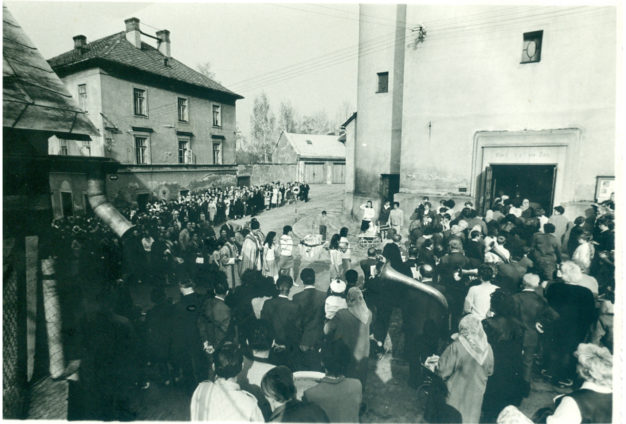
11) Procesí se svatými ostatky – kostel sv. archanděla Michaela Rýmařov (nedatováno)