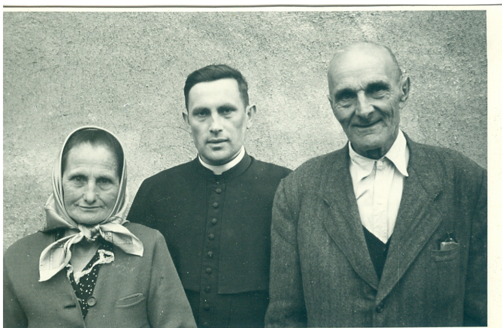
15) Mladý kněz s rodiči (nedatováno)