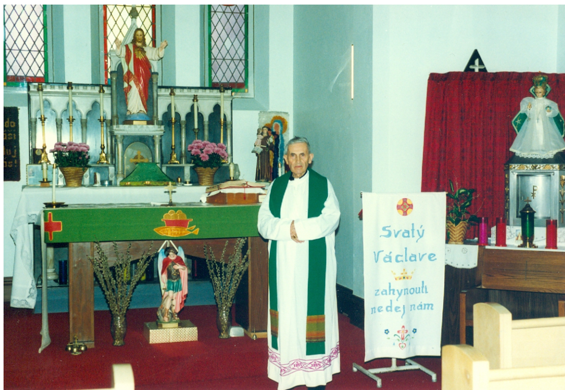
16) Návštěva krajanů v USA, 1990