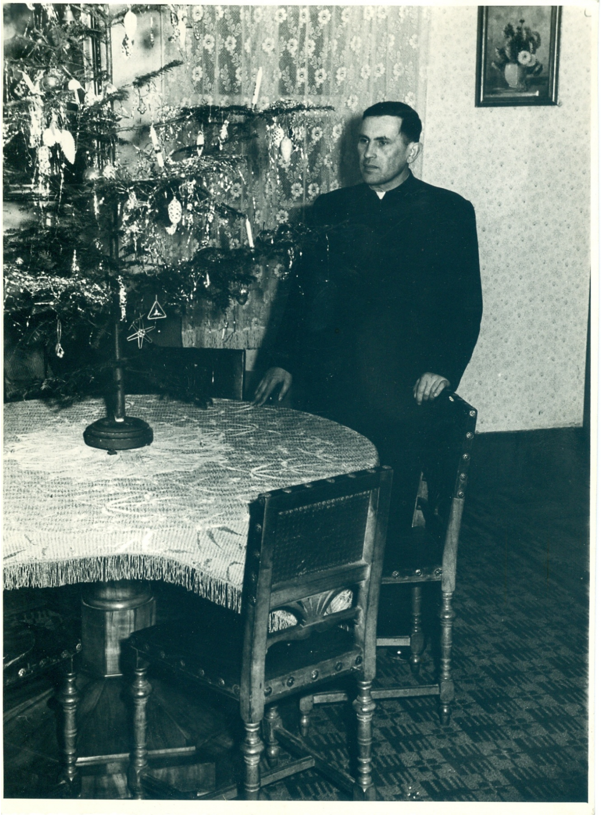
16) Vánoce na rýmařovské faře (nedatováno)