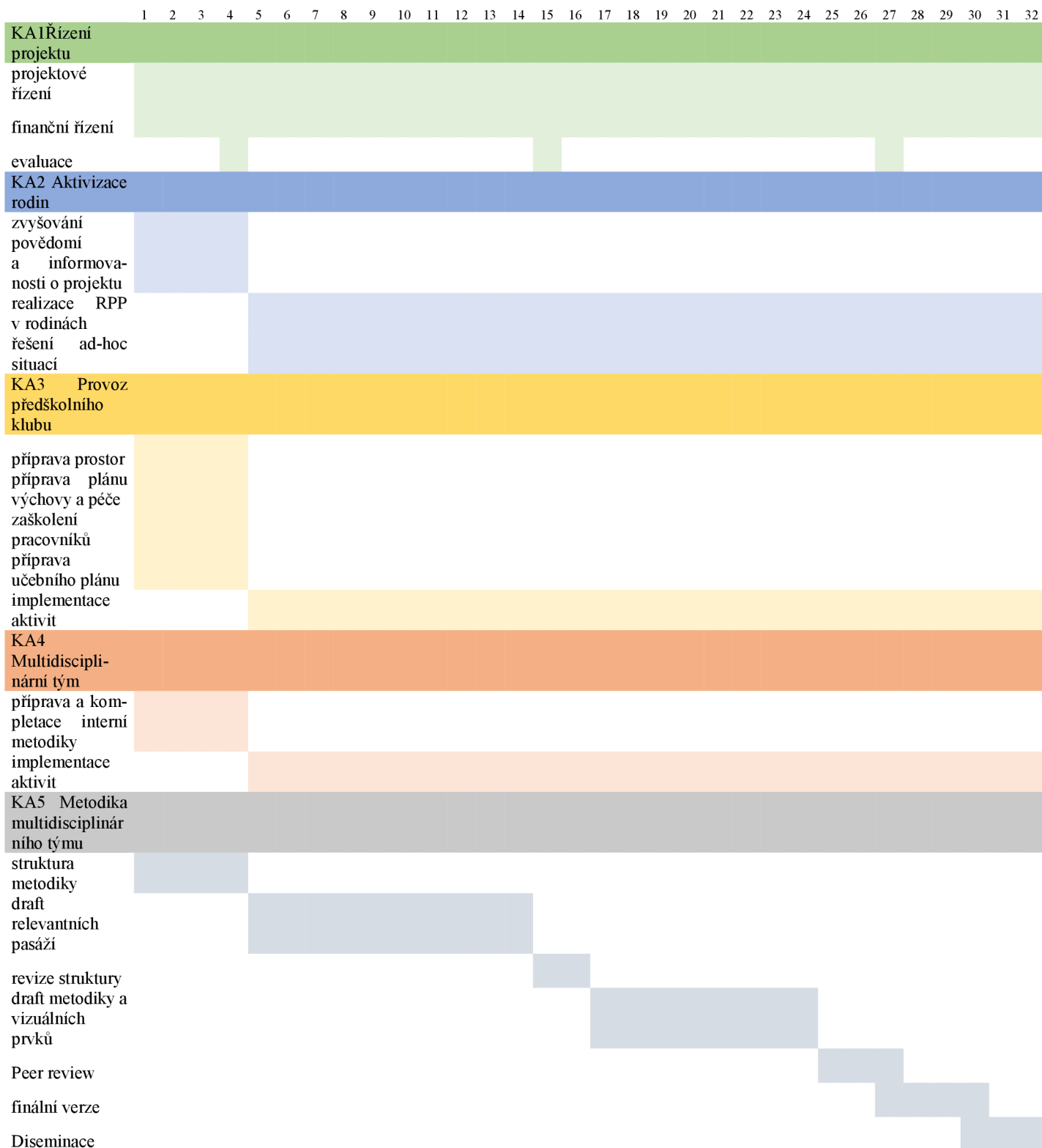
Obrázek 2 Harmonogram projektu