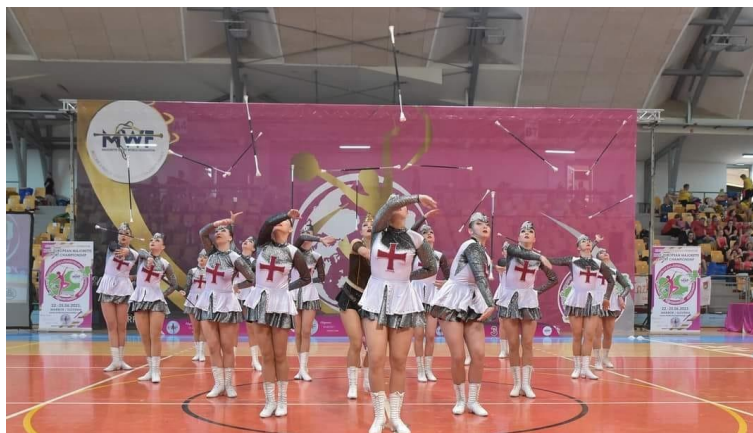
Obrázek 6 - Výhoz s hůlkou, zdroj: vlastní obrázek