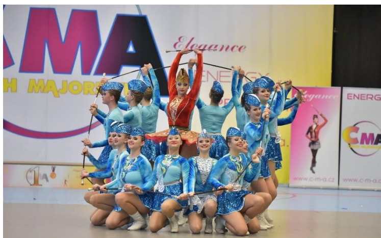
Obrázek 8 - Vlna v disciplíně baton