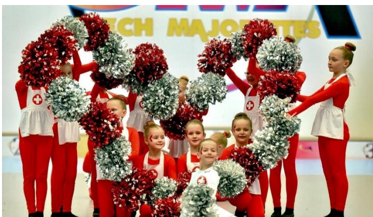
Obrázek 5 - Obrázek z třásní, zdroj: vlastní obrázek

Do práce s náčiním zahrnujeme i různé obrazce vytvořené za pomoci třásní (viz Obrázek 5 – Obrázek z třásní, zdroj: vlastní obrázek). Mimo jiné v soutěžní disciplíně baton lze očekávat rozmanité výhozy s hůlkou, kterým skupina získává vyšší ohodnocení své sestavy (viz Obrázek 6 – Výhoz s hůlkou, zdroj: vlastní obrázek).