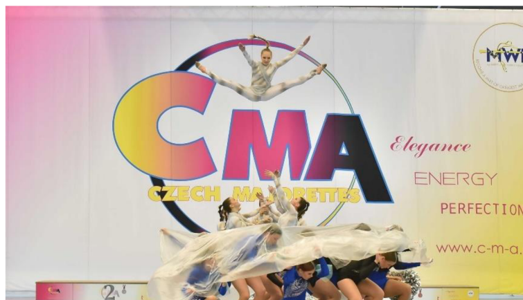
Obrázek 3 - Dynamická zvedačka, zdroj: vlastní obrázek

Tvoření zvedaček může být formou statické, dynamické nebo momentální. Perfektní použití jakékoli formy zvedá úroveň choreografie a její kompozice (viz Obrázek 3 – Dynamická zvedačka, zdroj: vlastní obrázek)