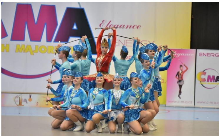
Obrázek 8 - Vlna v disciplíně baton