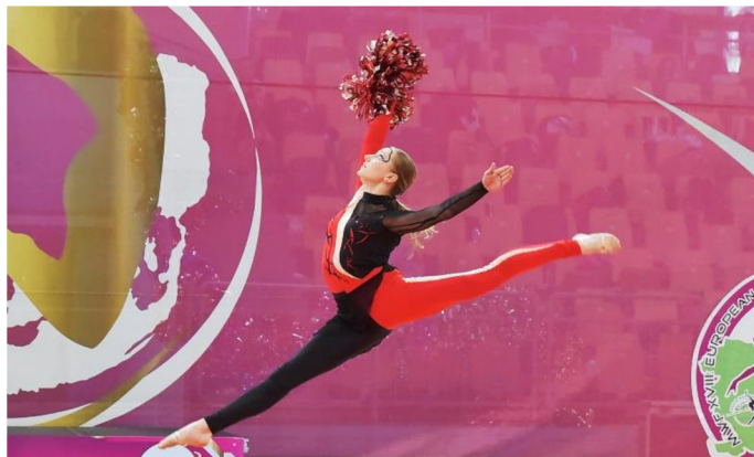
Obrázek 4 - Gymnastický prvek (labuť), zdroj: vlastní obrázek

Mezi gymnastické prvky zařazujeme takové prvky, kdy se mažoretky nepřenesou přes hlavu (například různé variace skoků, rozsahové pohyby apod.) – viz Obrázek 4 – Gymnastický prvek (labuť), zdroj: vlastní obrázek.