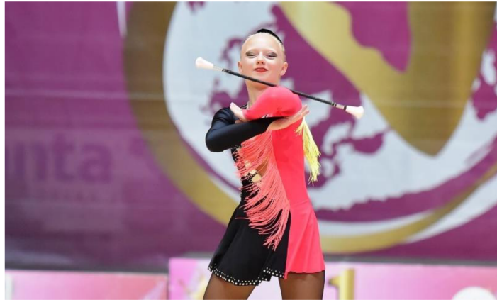
Obrázek 2 - Práce s náčiním baton

V každé hodnotící oblasti může soutěžící mažoretka dostat maximálně 10 bodů. Oproti bodové porotkyni má technická porotkyně za úkol sledovat pravidly jasně stanovené technické srážky (viz Tabulka 2 – Bodové srážky technického porotce) dle pravidel české mažoretkové asociace (CZ Majorettes, z. s., 2022, online).