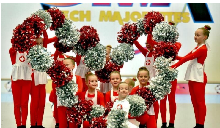
Obrázek 5 - Obrázek z třásní, zdroj: vlastní obrázek

Do práce s náčiním zahrnujeme i různé obrazce vytvořené za pomoci třásní (viz Obrázek 5 – Obrázek z třásní, zdroj: vlastní obrázek). Mimo jiné v soutěžní disciplíně baton lze očekávat rozmanité výhozy s hůlkou, kterým skupina získává vyšší ohodnocení své sestavy (viz Obrázek 6 – Výhoz s hůlkou, zdroj: vlastní obrázek).