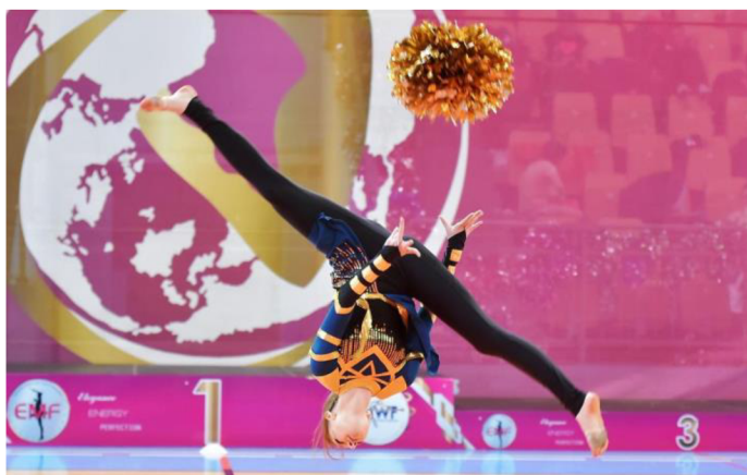
Obrázek 1 - Práce s náčiním pom-pom