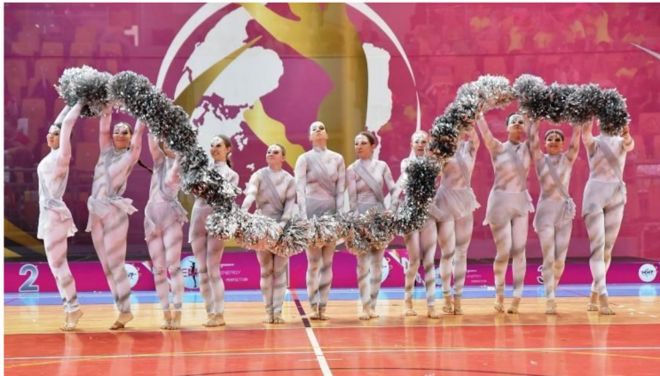
Obrázek 7 - Vlna v disciplíně pom-pom, zdroj: vlastní obrázek

Atraktivním prvkem pro diváky, kteří sledují soutěžní choreografii jsou tzv. „vlny“ nebo „kaskády“. Rozlišujeme je dle toho, zda je náčiní plynule spojeno či se postupně přidává (Jelínek & Jelínková, 2014). Zmíněné prvky lze předvést jak v disciplíně pom-pom (viz Obrázek 7 – Vlna v disciplíně pom-pom, zdroj: vlastní obrázek), tak v disciplíně baton (viz Obrázek 8 – Vlna v disciplíně baton, zdroj: vlastní obrázek).