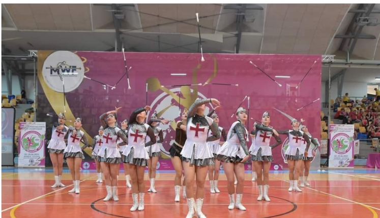
Obrázek 6 - Výhoz s hůlkou