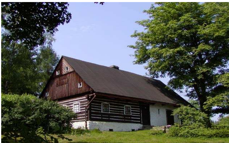
Obr. 4 - Roubená chalupa na Rádle

Obec Rádlo leží 5 km od Jablonce nad Nisou a náleží k ní i Milíře. Počet obyvatel je kolem 650. Rádlo vzniklo počátkem 15. století jako česká ves a již v roce 1419 byla pojmenována jako Radlo – dle orebního náradí. Můžeme zde najít staré roubené chalupy, které jsou dnes spíše využívány k rekreaci. Obec je turisticky zajímavá zejména díky naučné stezce procházející přímo středem obce. Stezka vede přes podmáčené louky, kde se vyskytuje mnoho chráněných druhů rostlin a dovede nás až k malému lesnímu rašeliništi. Rádlo se nachází v oblasti mezi severní částí Českého ráje a jižní částí Jizerských hor. Tato výhodná poloha nabízí návštěvníkům možnosti výletů do obou těchto turisticky atraktivních oblastí.