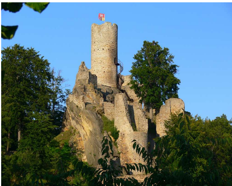
Obr. 5 - Hrad Frýdštejn

Obec Frýdštejn leží 15 km od Jablonce nad Nisou. Nachází se v malebné oblasti Českého ráje a to nad pravým břehem řeky Jizery. Obec má 850 obyvatel. K Frýdštejnu náleží tyto části: Anděl Strážce, Bezděčín, Borek, Horky, Kaškovice, Ondříkovice, Roudný, Sestroňovice, Slapy a Voděrady. První písemná zmínka o obci pochází z roku 1385. Hlavní dominantou Frýdštejna je zřícenina středověkého skalního hradu, který se nachází na Vranovském hřebenu. V okolí hradu stojí několik roubených stavení, dnes využívaných převážně k rekreaci.