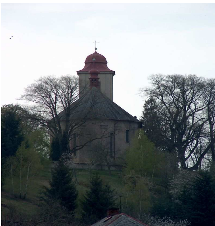
Obr. 6 – Kostel sv. Jiří v Jenišovicích

Obec Jenišovice je výchozím bodem pro návštěvu turisticky zajímavých lokalit v okolí, které se nachází v okruhu cca 5km. Těmi jsou např. zámek Sychrov s chráněnou lipovou alejí Rohanka, zámek Hrubý Rohozec, hrad Frýdštejn, hrad Vranov-Panteon. Nedaleko cca 8 km se nachází atraktivní oblast Maloskalska se skalními masivy Panteonu, Suchých skal, bludiště Kalicha a pro milovníky vodní turistiky řeka Jizera. Snadno dostupné, pěšky, na kole nebo autobusem je město Turnov, které je východiskem do Českého ráje.