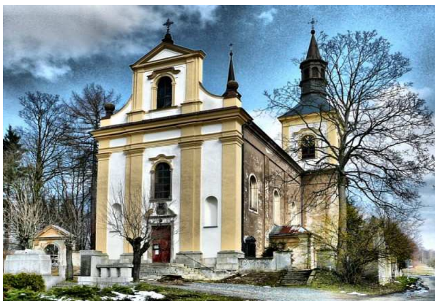
Obr. 2 - Kostel sv. Václava

V současné době má město 2500 obyvatel a náleží k němu část zvaná Pelíkovice. Rychnov je svojí polohou a dobrým dopravním spojením přímo předurčen jako výhodná základna pro krátké i delší turistické výlety. Na své si přijdou pěší, cykloturisté a v zimě je možno vyrazit do okolí na běžkách nebo na místní lyžařský vlek.