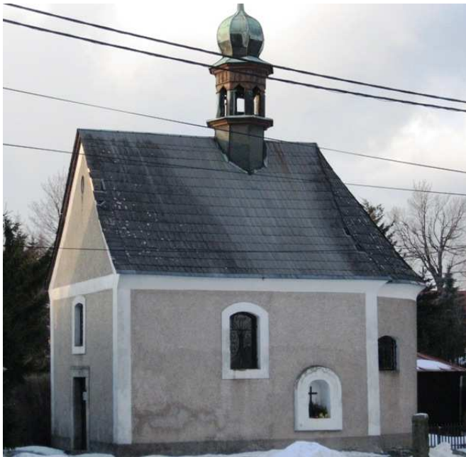
Příloha č. 10 – Kaplička Krista Trpitele (Frýdštejn)