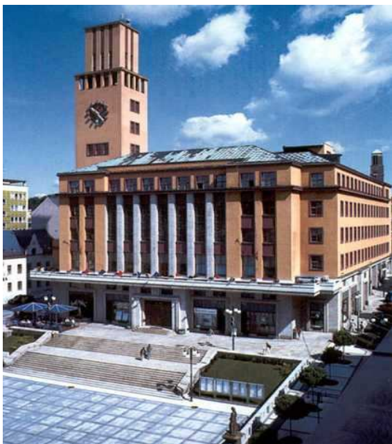
Obr. 1 – Radnice v Jablonci nad Nisou ( http://www.u-lucie.cz/kultura.htm )