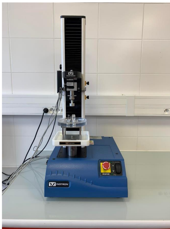
Obrázek 10 Přístroj Instron sloužící k zjišťování pevnosti vaječné skořápky (Autorka BP 2023)