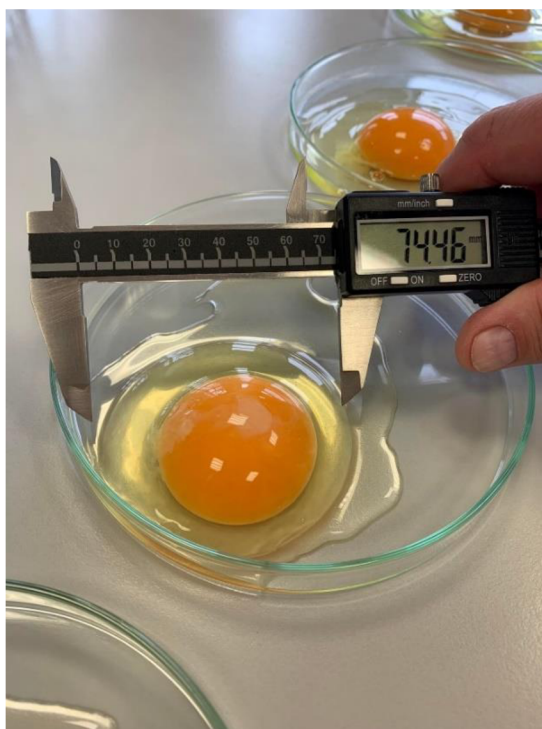
Obrázek 6 Měření šířky vaječného bílku pomocí posuvného měřítka