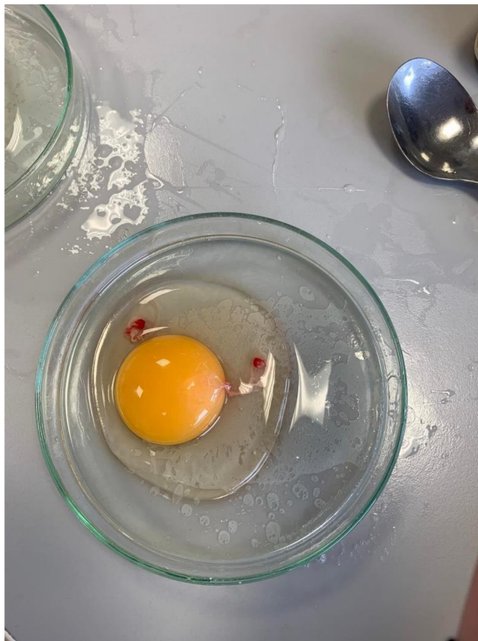
Obrázek 2 Krevní skvrna ve vejci (Autorka BP 2023)