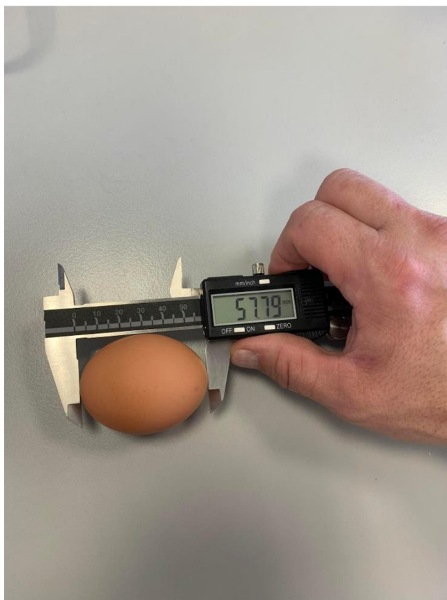
Obrázek 7 Měření délky vejce pomocí posuvného měřítka