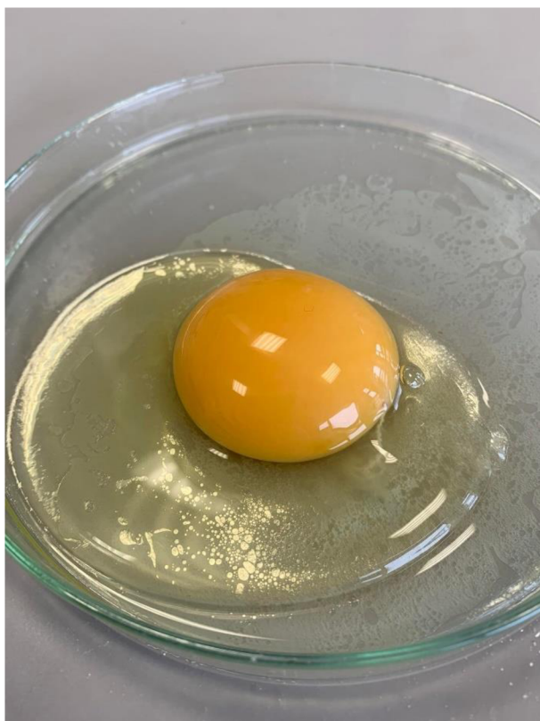
Obrázek 3 Masová skrvna ve vejci (Autorka BP 2023)