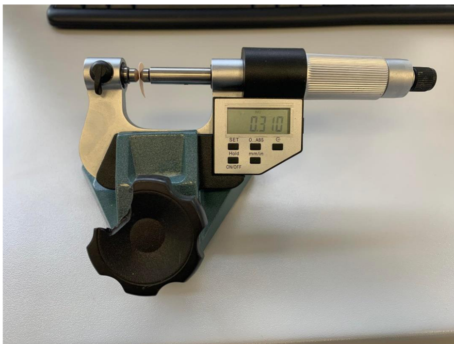
Obrázek 8 Měření tloušťky vaječné skořápky pomocí digitálního mikrometru