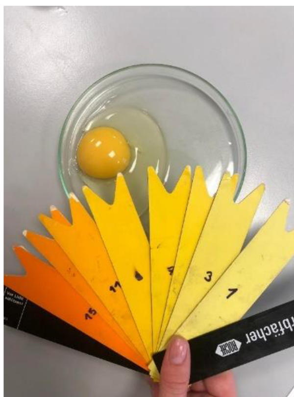
Obrázek 4 Subjektivní hodnocení barvy vaječného žloutku pomocí barevné stupnice La Roche (Autorka BP 2022)