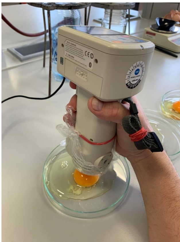
Obrázek 5 Objektivní hodnocení barvy vaječného žloutku pomocí přístroje Minolta (Autorka BP 2023)