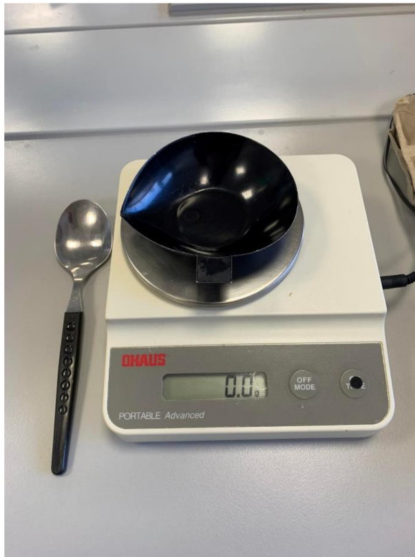
Obrázek 9 Digitální váhy sloužící k zjišťování hmotnosti vejce a jeho jednotlivých částí