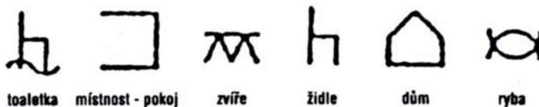
Obr. 4 Bliss systém