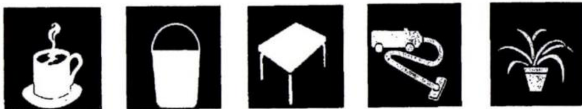
Obr. 2 Piktogramy

Herzánová a kol. (2021) definuje piktogramy jako obrázkové komunikační symboly, s kterými se v běžném životě často setkáváme, a to ve formě informačních tabulí či značek. Klenková (2006) uvádí, že se jedná o zjednodušená zobrazení skutečnosti, jako jsou například předměty, činnosti nebo vlastnosti. Piktogramy bývají srozumitelné všem a jednoduchým řazením se z piktogramů dají skládat věty, denní nebo týdenní plány apod. Neverbální komunikace pomocí piktogramů je určitou formou předávání instrukcí, příkazů, varování, usnadnění orientace v nejrůznějších prostředích bez vazby na řeč (Šarounová, 2014).