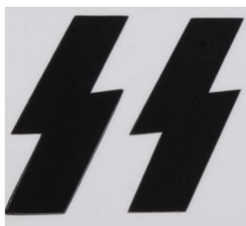
Obrázek 2 88

Bylo však toto spojení run s označením bojových uskupení německých vojsk pouze designovou volbou, nebo měly tyto znaky přinést jejich válečníkům štěstí a úspěch v boji? Sám se domnívám, že šlo pouze o snahu ukotvit jisté bojové oddíly do severské historie a mytologie, čímž byla budována sounáležitost a věrnost oddílu a říši.