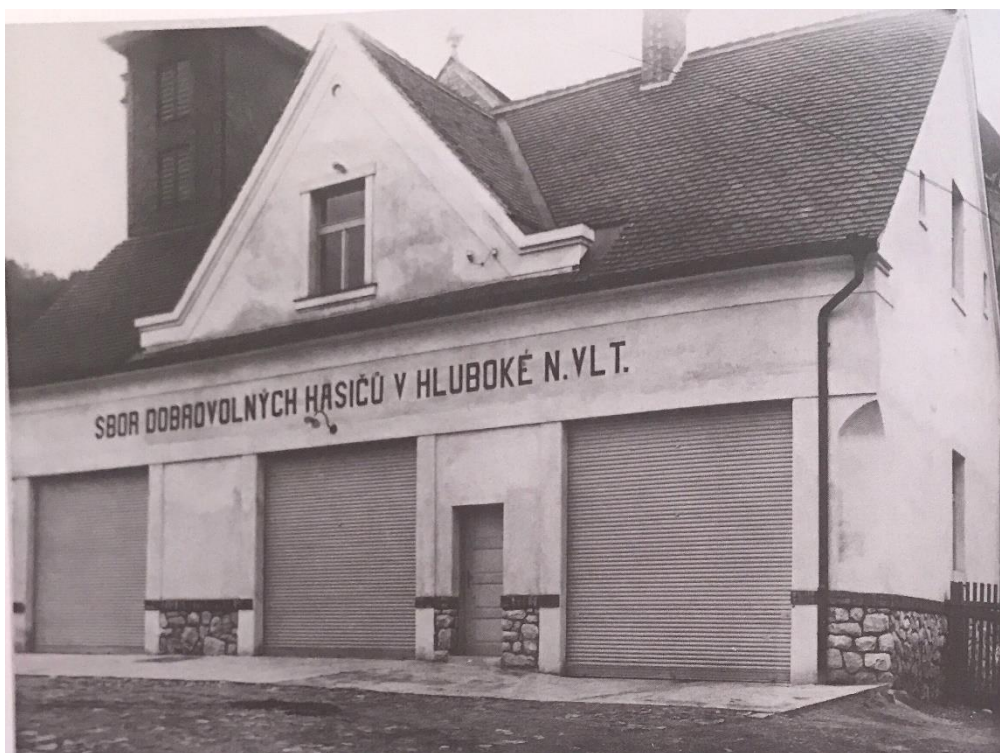
Obr. 4 Hasičská zbrojnice ve třicátých letech, 20. století.