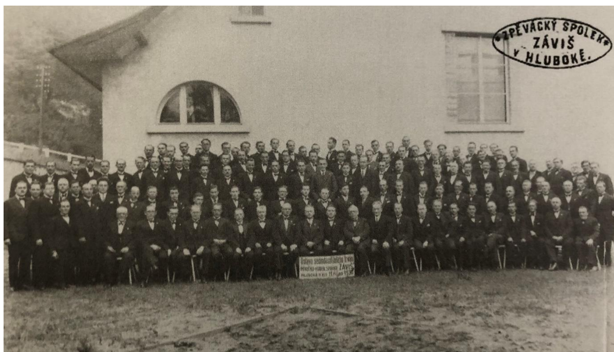
Obr. 6 Oslava 70 let spolku Závěš, r. 1936.