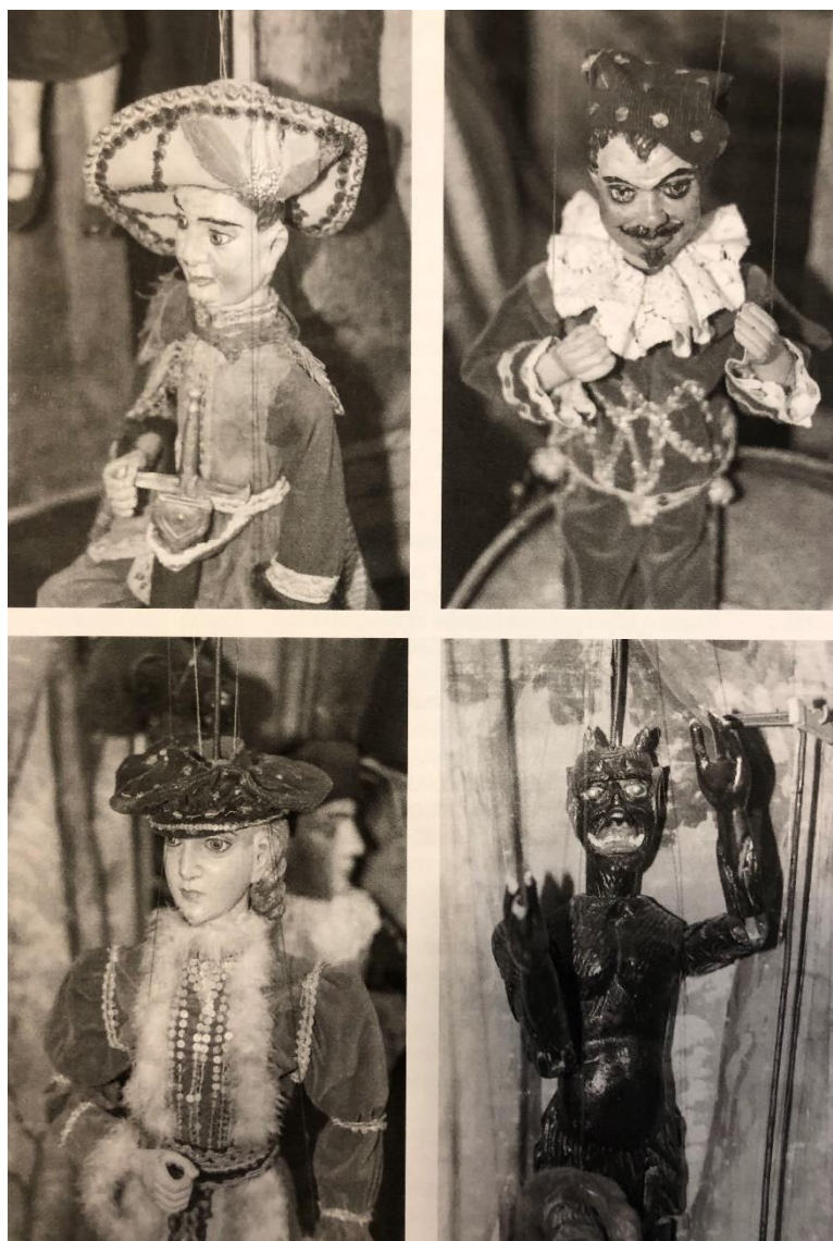
Obr. 7 Současné fotografie loutek Tomáše Dubského v Městském muzeu Týn nad Vltavou.