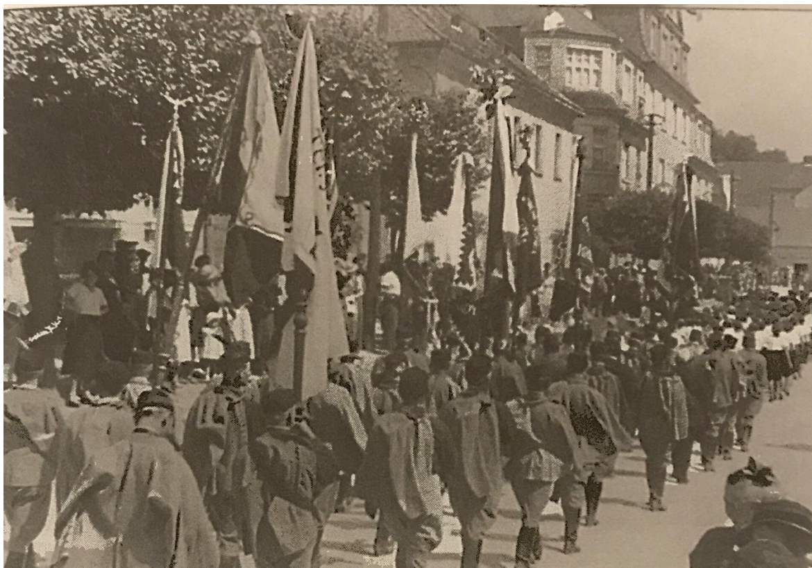
Obr. 5 Sokolský průvod městem při župním sletu, r. 1934.