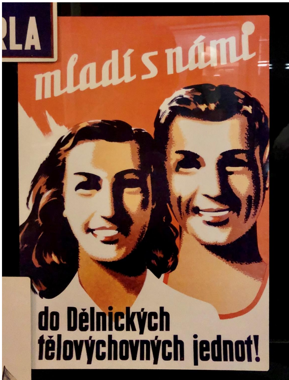
Obr. 8 Propagační plakát Dělnické tělocvičné jednoty vystavený v Národním muzeu, 20. století, r. 1930.