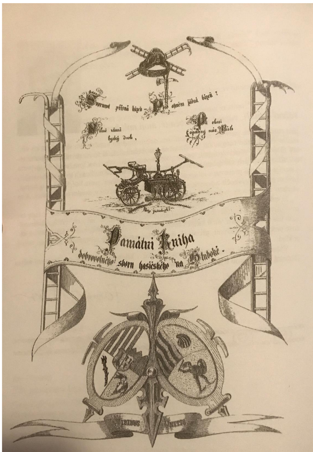
Obr. 3 Titulní strana pamětní a současně zakládající knihy hlubockého hasičského sboru, r. 1876.