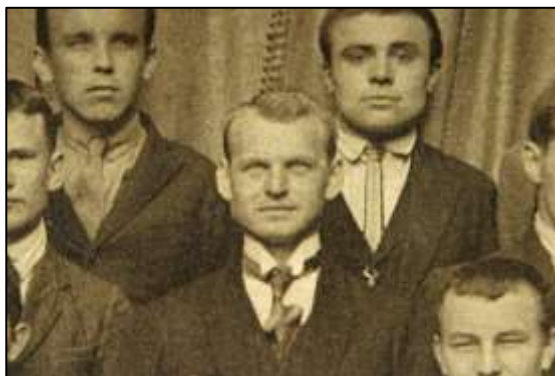
Obrázek č. 6 Jaroslav Soukup. 43

Padre Soukup, jak byl v Jižní Americe znám, zemřel 14. listopadu 1989, tedy těsně před revolucí v tehdejší Československu.