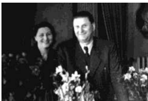
Obrázek č. 7 Jan Antonín Baťa s manželkou. 45

J. A. Baťa zemřel 23. srpna 1965 v São Paulu. Jeho jméno bylo v České republice právně očištěno až v roce 2007, kdy jej soud uznal nevinným a celý proces označil jako zmanipulovaný. Od té doby začala vycházet dosud nevydaná Baťova díla a v roce 2010 vznikl v Uherském Hradišti Fond Jana Antonína Bati.