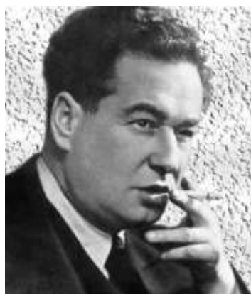
Obrázek č. 8 Egon Erwin Kisch. 49

Po druhé světové válce se vrátil zpět do vlasti, kde dva roky na to zemřel (31. března 1948).