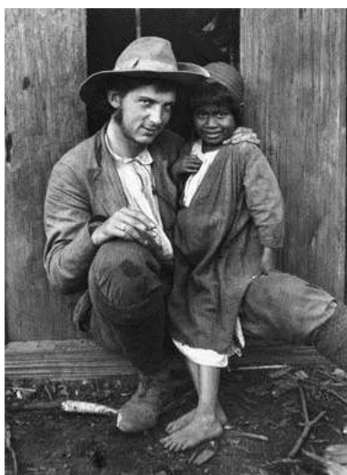
Obrázek č. 9 Alberto Vojtěch Frič. 53

Alberto Vojtěch Frič se nedožil konce druhé světové války a v roce 1945 zemřel na následky tetanu.