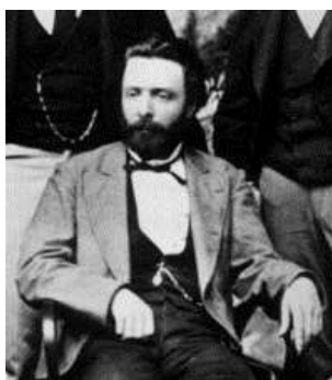
Obrázek č. 5 Francisco Latzina. 35

Latzina byl také členem argentinského Zeměpisného institutu a vydal nespočet publikací. Zemřel 7. října 1922 v Buenos Aires v úctyhodných 80 letech. Dodnes patří mezi přední argentinské vědce, bohužel ve své vlasti už tak známý není.