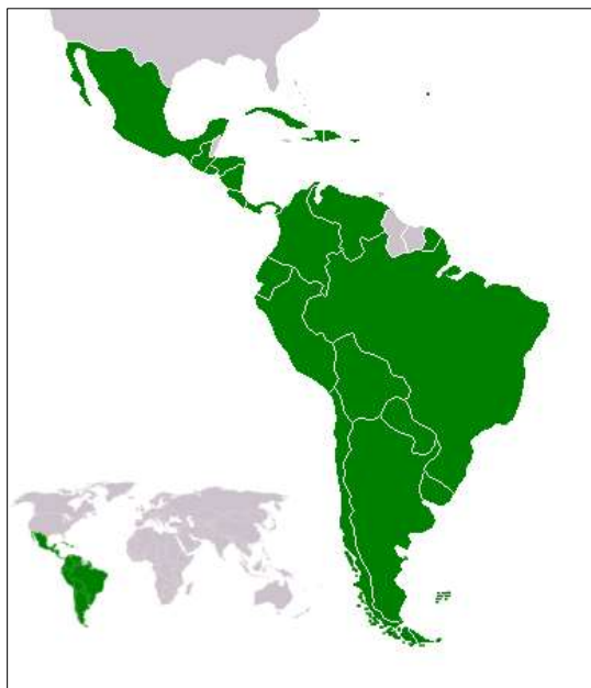
Obrázek č. 1 Geografické vymezení Latinské Ameriky. 2