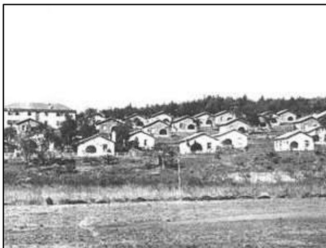
Obrázek č. 2 Batatuba - obytná kolonie. 24

Z tohoto nastínění historie českého vystěhovalectví do Latinské Ameriky vyplývá, že ačkoli se nejednalo o hlavní destinaci našich krajanů v cestě za novým domovem, mnoho se jich zde usadilo a dodnes se hlásí ke své původní národní příslušnosti. Někteří krajané byli svými zásluhami významní více, jiní méně. Pro nás je ale důležité, že se za svůj původ nestyděli a nestydí a že se někteří snaží i po tolika letech na svou vlast nezapomenout. Čeští a slovenští krajané byli také velice aktivní v podporování a šíření tradic jim vlastních a tak za mořem vznikaly i mnohé spolky a sdružení. V dalších kapitolách se proto zaměříme právě na přiblížení několika vybraných krajanů, kteří odešli do Latinské Ameriky a byli pro svou vlast nebo i pro své nové bydliště něčím významní, a také na působení krajanských spolků.