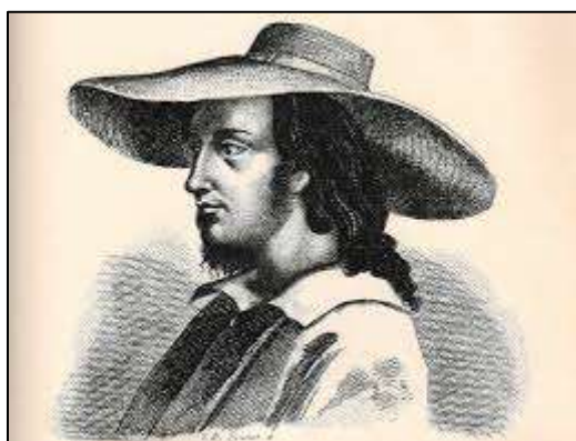
Obrázek č. 4 Podobizna Tadeáše Haenkeho. 29

Po vypuknutí povstání proti španělským kolonizátorům byl ale Haenke zatčen a propustili ho jen díky vážnému zdravotnímu stavu. Ten se mu nakonec ale stal osudným, když mu služka místo léku podala jed. Dodnes se spekuluje, jestli šlo o nešťastnou náhodu nebo o úmysl. 31. Října 1817 tak umírá nadějný český vědec, jehož práce přišla téměř v zapomnění. Jeho jméno v Bolívii ale stále žije, je po něm pojmenovaná jedna z hlavních tříd v Cochabambě – Avenida Tadeo Haenke.