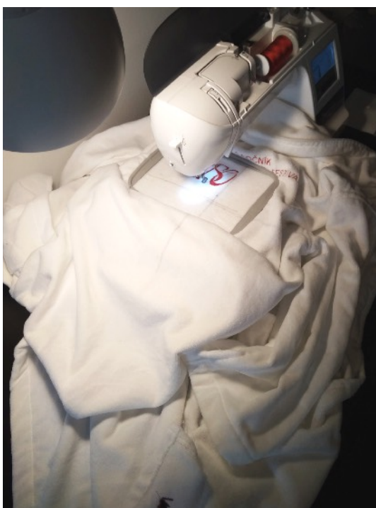
ukázky procesu práce