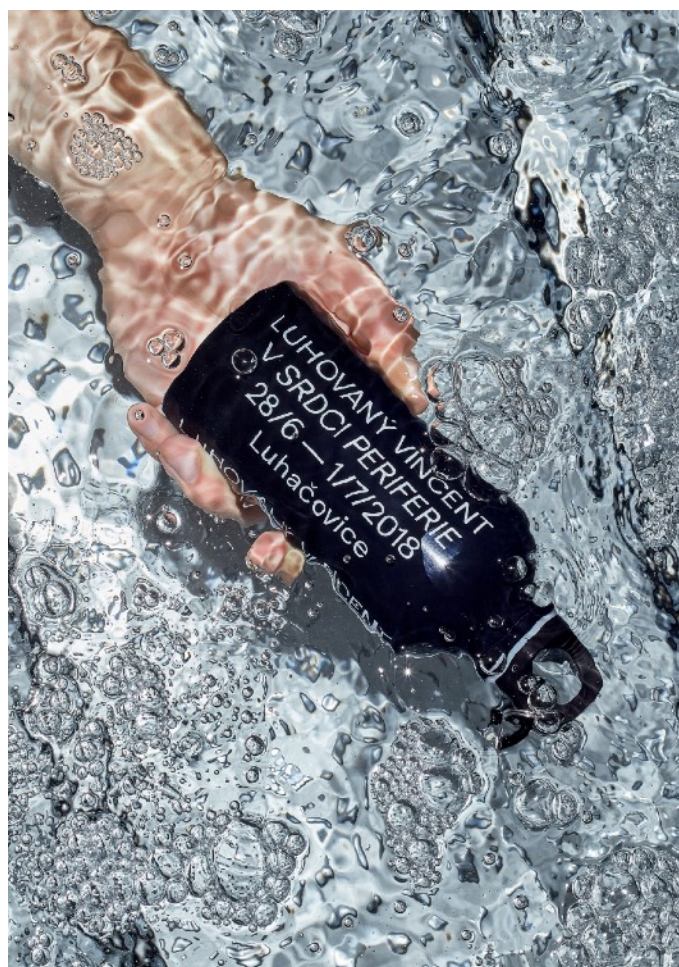
ukázky fotografií (w/Filip Beránek)