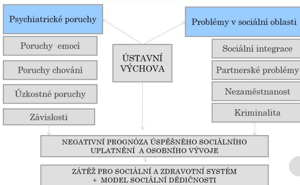
Obrázek 3 Důsledky ústavní péče.

Zdroj: (Vliv náhradních forem péče na vývoj a život dítěte, MPSV [online]).