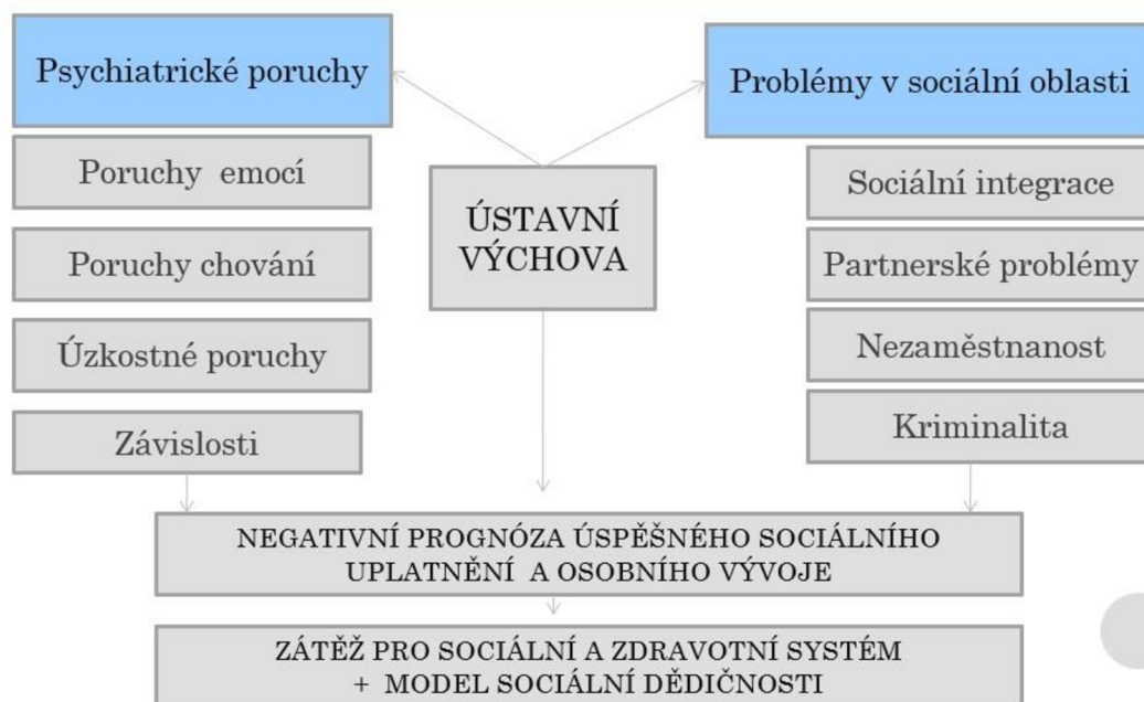
Obrázek 3 Důsledky ústavní péče.

Zdroj: (Vliv náhradních forem péče na vývoj a život dítěte, MPSV [online]).