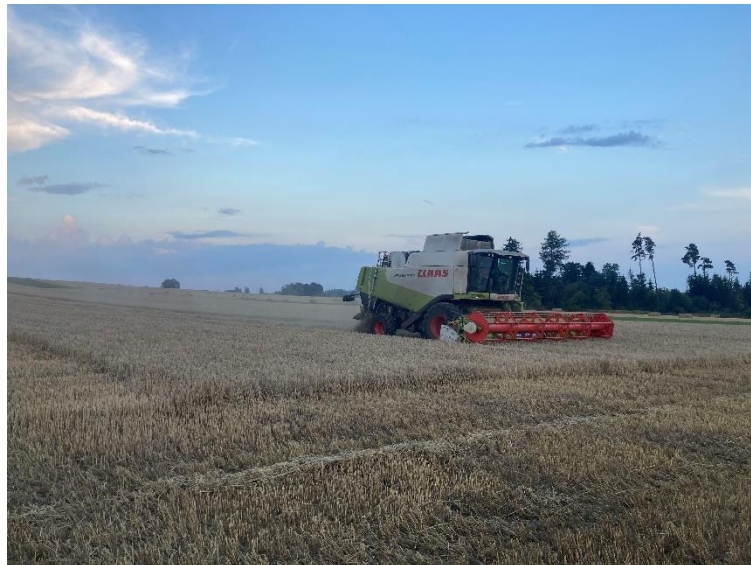
Obrázek 4.10: Claas Lexion 550 s lištou

Sklizeň jarního ječmene se uskutečnila 16. 8. 2023. Sklizeň zajišťovala sklízecí mlátička Claas Lexion 550 s vario lištou o záběru 7,5 m (viz obrázek 4.10).