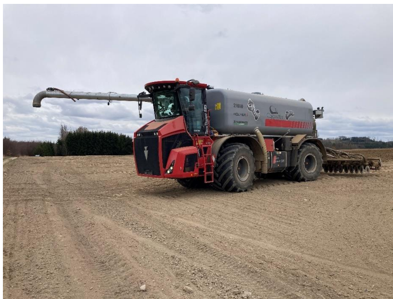
Obrázek 4.3: Holmer TerraVariant 585

Aplikaci digestátu zajišťovala firma Agroslužby Žďár nad Sázavou, a. s. Firma vlastní samohodný aplikátor Holmer TerraVariant 585 (viz obrázek 4.3) s cisternou značky Zunhammer o objemu 21 m 3 . Holmer disponoval RTK navigací značky Raven a po pozemku se pohyboval krabím chodem. Na aplikátoru byly nasazeny nízkotlaké pneumatiky Michelin Cerexbib IF 1000/55 R32. Pracovní rychlost byla 11,5 km . h -1 . Pro zapravení byl použit diskový podmítač Väderstad o pracovním záběru 6,1 m.