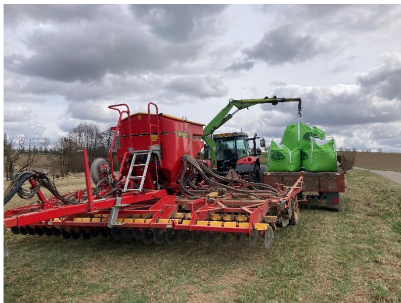
Obrázek 4.7: Nakládání osiva traktorem Masseyem Fergusonem 5470

Pole bylo zaseto 24. 3. 2023. Odrůda byla LG Tosca. Big bagy s osivem byly nakládány traktorem Masseyem Fergusonem 5470 a hydraulickým jeřábem (viz obrázek 4.7).