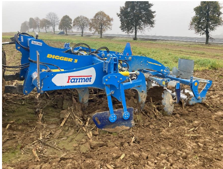
Obrázek 1.4: Dlátový pluh Farmet

Většina dnes nabízených strojů je vybavena disky, které slouží k urovňování povrchu, a válci, na nichž jsou přivařeny hroty, jejichž prostřednictvím se drobí hroudy. Dlátové pluhy jsou schopny pracovat až do hloubek přibližně 60 cm (Koukolíček a Pulkrábek, 2015).