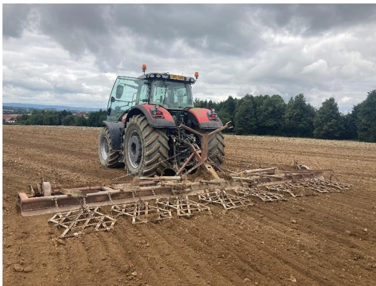
Obrázek 4.2: Massey Ferguson 8735S a smykobrány

Smykování pole zajistil traktor Massey Ferguson 8735S a smykobrány (viz obrázek 4.2) o záběru 8,80 m. Pohyb traktoru byl řízen navigací s přesností \pm 10 cm. Traktor má najeto přibližně 4 000 motohodin.