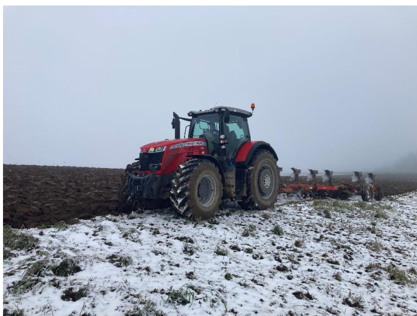
Obrázek 4.1: Traktor Massey Ferguson a pluh Kuhn Manager NSH

Pole oral traktor Massey Ferguson 8730S s pluhem značky Kuhn (viz obrázek 4.1), označený jako Manager NSH. Pluh dříve disponoval sedmi radlicemi, ale v současné době má pouze šest orebních těles. Stáří traktoru je tři roky. Pluh byl vyroben v roce 1996. Traktor byl dodán společností Agrocentrum ZS, s. r. o. Je osazen přesnou RTK navigací dodanou firmou Agri precision s. r. o. Pluh byl podle agronoma nastaven na hloubku 25 cm.