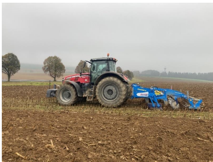
Obrázek 4.11: Massey Ferguson 8735S a Farnet Digger 3

Hluboké kypření dlátovým pluhem prováděl traktor Massey Ferguson 8735S a Farnet Digger 3 (viz obrázek 4.11). Hloubka zpracování byla 50 cm. Záběr stroje činil 3 m. Traktor se pohyboval průměrnou rychlostí 8 km . h -1 . Dlátový pluh byl zapůjčen na zkoušku.