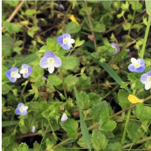
Obrázek 1.1: Rozrazil perský ( Veronica persica ) – přezimující skupina plevelů (Děkanovský a Winkler, 2023)

Hluchavka objímavá se řadí do čeledi hluchavkovitých, pochází z jižní Evropy a ze západu Asie. Daří se jí na hlinitých a písčitých půdách, které jsou neutrální nebo kyselé. Na spodní části rostliny se nachází kratší kořen. Rostlina obsahuje 200 tvrdek, které časem vypadají na povrch půdy. Mravenci, kteří roznášejí tvrdky do dalších lokalit, používají maso z tvrdek jako potravu. Mezi další způsoby rozšiřování se řadí kompostování, šíření pomocí osiva bývá méně obvyklé. Hluchavku lze potlačit kvalitním základním zpracováním půdy a perfektně zapojenými porosty. Poslední možností je aplikace herbicidů, které by měly být aplikovány nejpozději v období tří pravých listů.