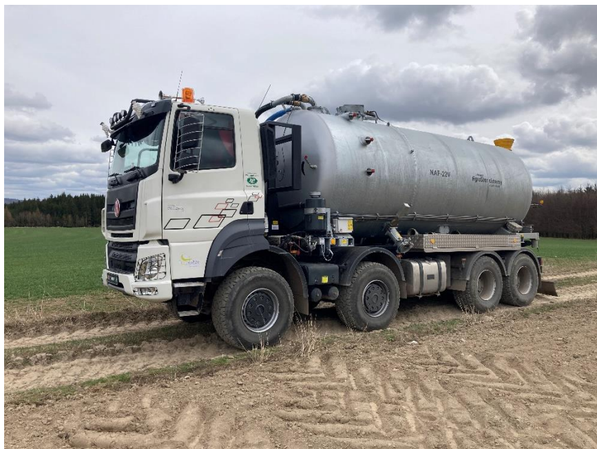
Obrázek 4.4: Tatra Phoenix 8×8

Digestát k aplikátoru navázela nová Tatra Phoenix 8×8 (viz obrázek 4.4) v konfiguraci traktor. Tatra byla koupena od firmy P&L Velké Meziříčí. Nosič nástaveb byl osazen pozinkovanou cisternou NAF-22V od výrobce Agrostar cisterny s. r. o. z Velké Bíteše. Cisterna pojme až 22 m 3 .