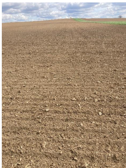
Obrázek 4.8: Zaseté pole