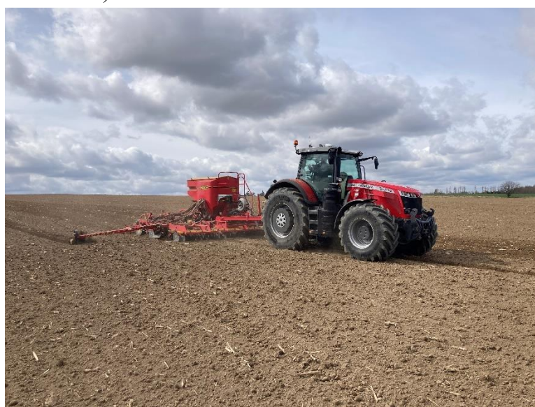
Obrázek 4.6: Massey Ferguson a Väderstad Rapid 600AS

Porost zasel traktor Massey Ferguson 8730S se secím strojem Väderstad Rapid 600AS (viz obrázek 4.6).