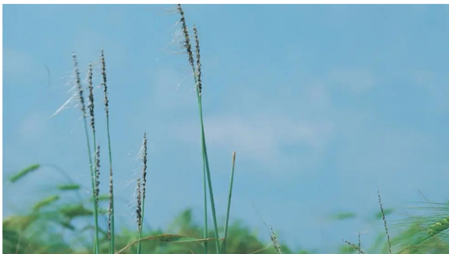
Obrázek 1.2: Prašná sněť ječná

U ječmene se objevuje osivem přenosná prašná sněť (viz obrázek 1.2), která se řadí do skupiny houbových chorob a snadno se přenáší osivem. Důležité je osivo mořit (Diviš et al., 2010).