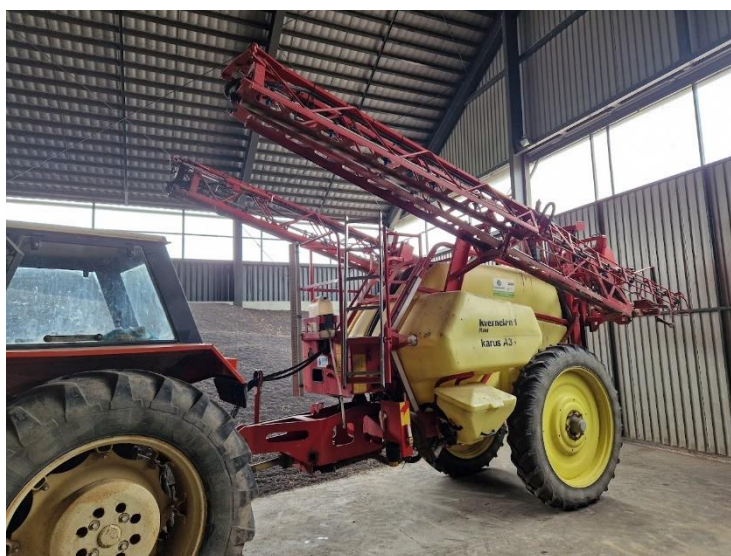
Obrázek 4.9: Kverneland Ikarus A38

Chemickou ochranu rostlin zajišťoval traktor Massey Ferguson 5470 s postřikovačem Kverneland Ikarus A38 (viz obrázek 4.9).