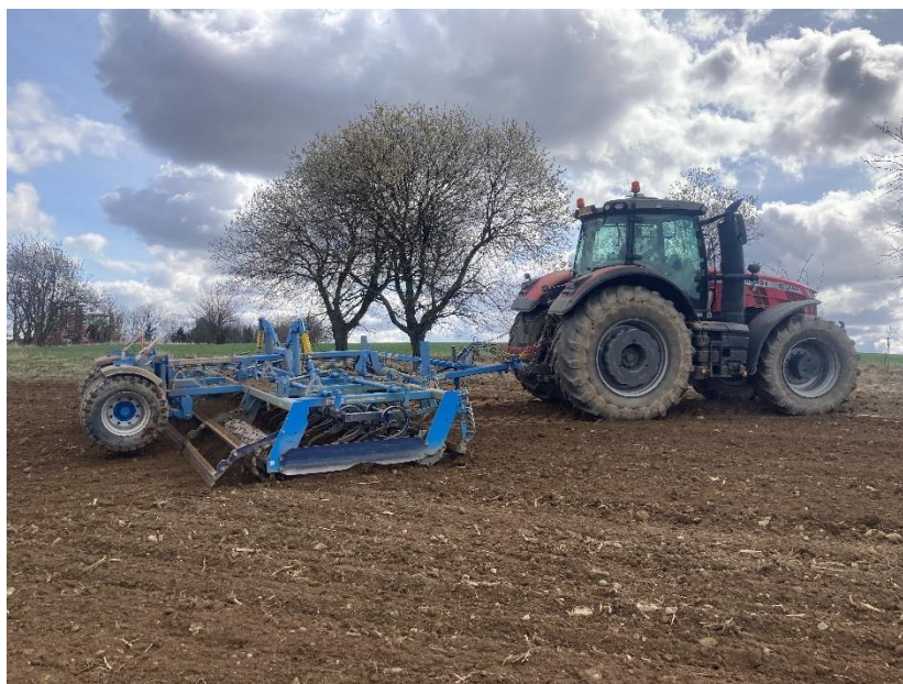
Obrázek 4.5: Massey Ferguson 8735S s kompaktorem značky Farmet

Předset'ová příprava půdy probíhala pomocí kompaktoru značky Farmet. Tento stroj byl připojen k traktoru Massey Ferguson 8735S (viz obrázek 4.5).