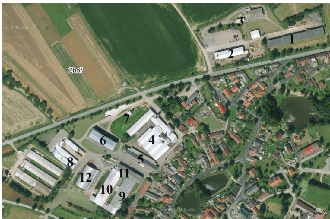
Obrázek 3.1: Zemědělská společnost Zhoř a. s. (mapy.cz, 2020), úprava autor

Zemědělskou společnost Zhoř a. s. (viz obrázek 3.1) lze nalézt v malebné vesnici Zhoř u Jihlavy, konkrétně na adrese Zhoř 92.