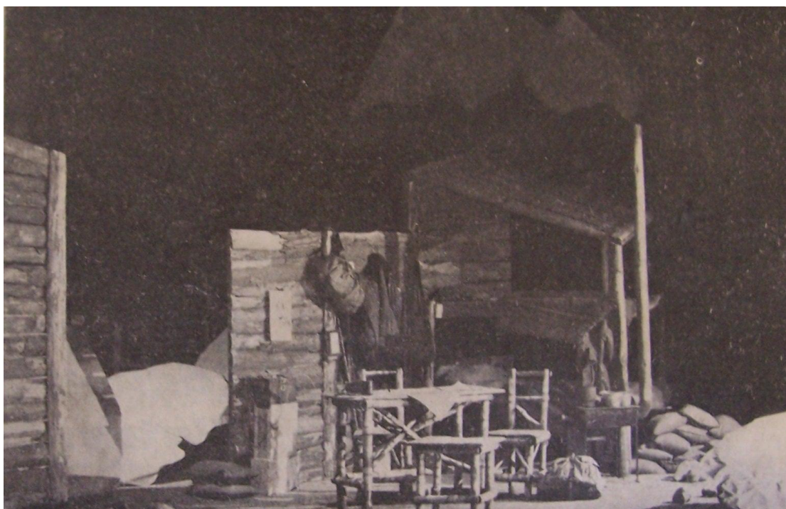
Šrámek: Soud, 1937 (scéna E. Pitter, režie J. Stejskal)