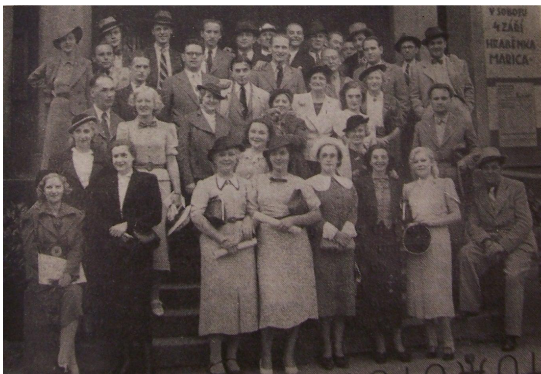
Soubor JND na zájezdu v Mostě, 1937