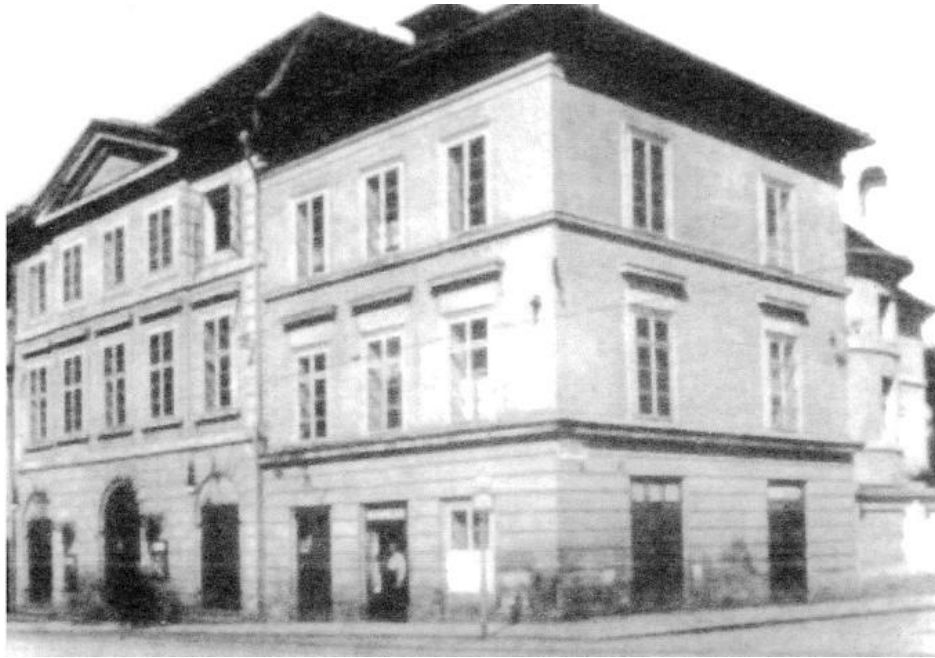
Budova JND, 1937