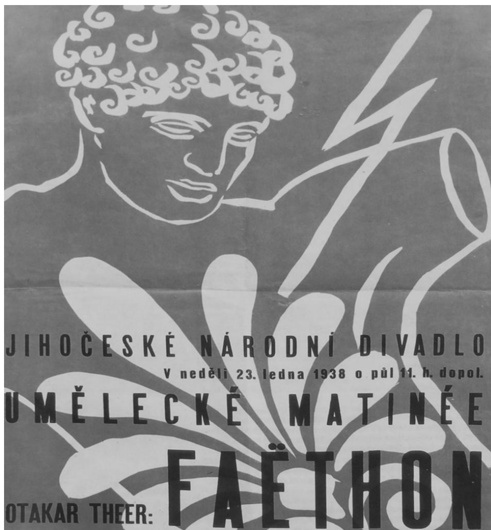
Plakát k představení Faëthon, 1938