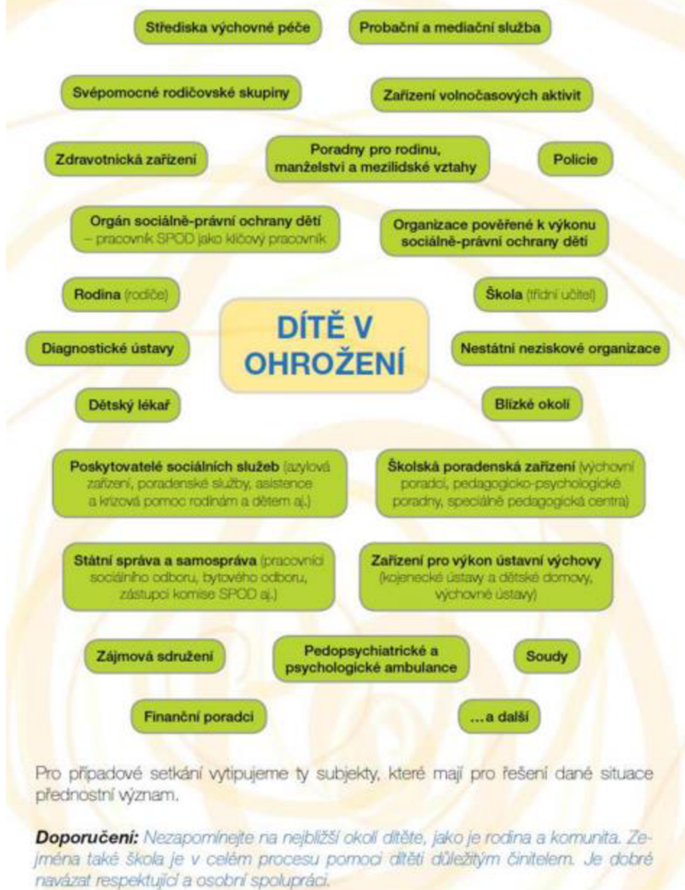
Obrázek 1: Spolupracující podpůrná síť v oblasti péče o ohrožené děti (Pavlíková, 2014)

V rámci multidisciplinárního diagnostického přístupu pracovník SPOD, pracovník školy, dětský lékař, případně další poskytovatelé služeb komplexně hodnotí míru bezpečí dítěte v rodině, jeho individuální situaci, celkovou situaci rodiny a také kvalitu vztahu mezi rodiči a dítětem (Bechyňková a Konvičková, 2011, s. 43).