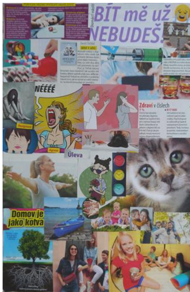
Obrázek 5 - Profesionální koláž, vel. A3, formát na výšku, autorka Markéta

Markéta má vzhledem ke své dlouholeté praxi zkušenosti i s několika muži v rolích sociálních pracovníků. V odpovědi na odlišnou motivaci mužů a žen zohledňuje více faktorů. „Pro muže je atraktivnější v rámci pomáhající profese profesionální hasič, policista, pracovník ve vězeňské službě. Sociální pracovník nezní tak atraktivně, když se chlapi chlubí čím se živí... k samotné práci s příběhy dětí mají blíže spíše ženy, a to v porozumění a citlivosti. Ale nechci v žádném případě diskriminovat muže v roli sociálního pracovníka. Chlapi mají často reálnější pohled na věc, nezakomponovávají se tolik citově. Hodí se mi k nim ale víc role kurátorů, vychovatelů a pracovníků v ústavních zařízeních.“