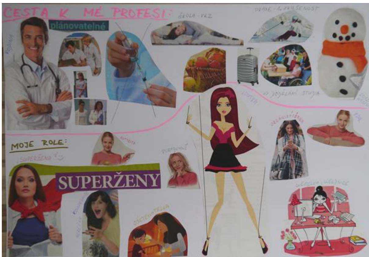
Obrázek 8 - Profesní koláž, vel. A3, formát na šířku, autorka Zdena

Autorka zpracovala dvě koláže rozdělené na oblasti (cesta k mé profesi, moje role, syndrom vyhoření a motivace). „ Když jsem se do toho ponořila, šlo to samo. Mohla jsem se zamyslet nad věcmi, nad kterými nepřemýšlím. “ Koláže jsou tak schématickým příběhem – potřeba organizace a plánu. Mít věci pod kontrolou a vše sdělit srozumitelně. Autorka je pravděpodobně pečlivá se sklony k perfekcionismu. O svých rolích v rámci profese má jasnou představu.