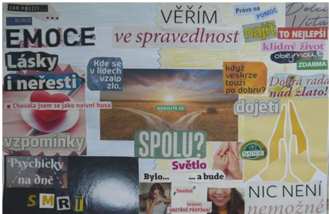
Obrázek 1 - Profesní koláž, vel. A3, formát na šířku, autorka Barbora

Během studia na střední obchodní škole experimentovala s návykovými látkami, což sehrálo roli při výběru vysoké školy. Návykové látky užívala i část studia na vysoké škole. Rodiče očekávali, že bude studovat vysokou školu, ale zatímco Barbora tíhla k pomáhajícím profesím, oni měli jinou představu. Barbora nakonec vyhověla sobě i svým rodičům a vystudovala obory se zaměřením pomáhajícím i justičním. „Chtěla jsem dělat v životě smysluplnou práci, dělat práci pro druhé, pracovat s lidmi a být nápomocná. Od studia se v mé motivaci nic nezměnilo.“