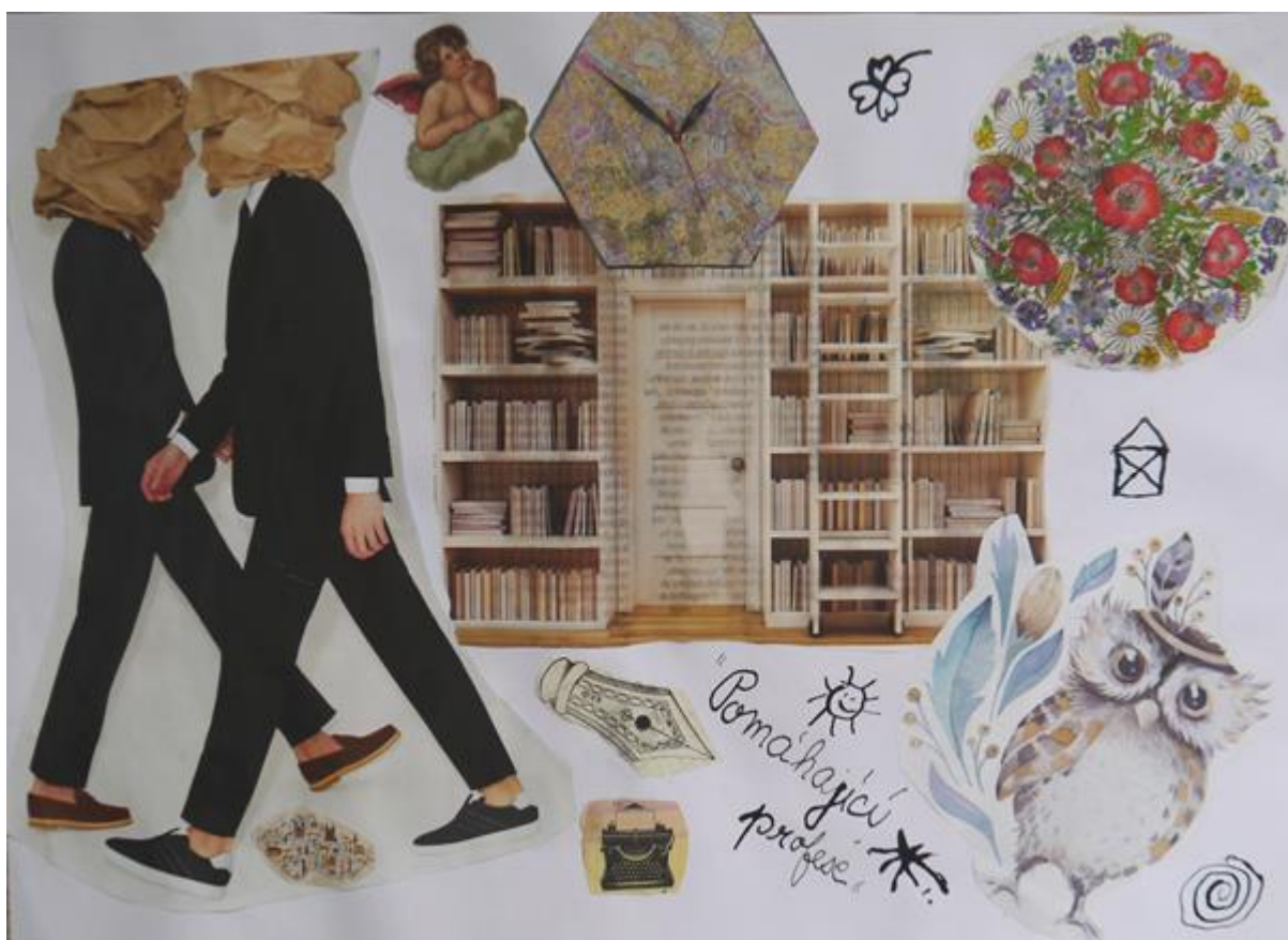
Obrázek 7 - Profesní koláž, vel. A3, formát na šířku, autorka Romana

Romana neměla jasnou představu o své profesi, ale věděla, že chce uplatnit znalost cizích jazyků a zkušenosti ze zahraničních studijních pobytů. Proto její volba směřovala k sociální práci, jejíž cílovou skupinou jsou cizinci a uprchlíci. „Neměla jsem jasnou představu o budoucím povolání. Lákala mě rozmanitost oboru sociální práce a široké možnosti uplatnění. Svou roli hrála také náhoda a velká pravděpodobnost, že studium dokončím.“ Motivace se u ní v průběhu let změnila a nyní je více zaměřená na smysl povolání a samotnou pomoc klientům. Její praxe činí 5,5 let, z toho 2,5 roku na aktuální pozici.