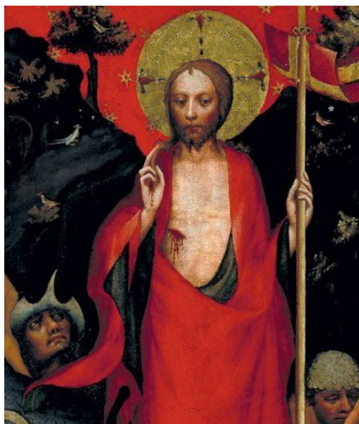
Obr. 3: Mistr Třeboňského oltáře, Zmrtvýchvstání Krista, r. 1380