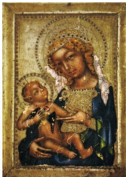
Obr. 2: Mistr Vyšebrodského oltáře, Madona z Říma, před r. 1360