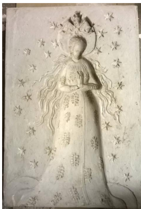
Obr. 18: Sádrový odlitek reliéfu