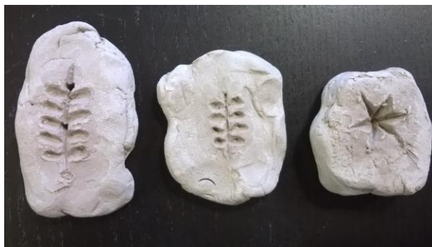
Obr. 22: Formy na detaily