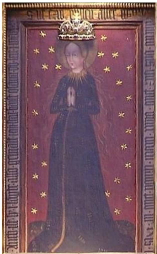
Obr. 8: Replika obrazu Panny Marie Budějovické