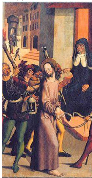
Obr. 4: Mistr Třeboňského oltáře, Kristus před Kaifášem, po r. 1500