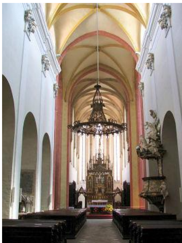
Obr. 6: Pohled do kněžiště kostela