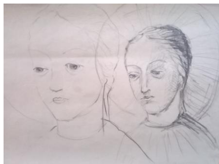
Obr. 11., 12: Přípravné návrhy