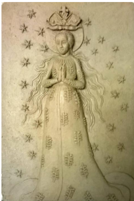
Obr. 17: Výsledná modelace