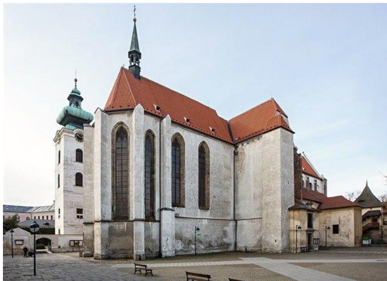
Obr: 5: Klášterní kostel Obětování Panny Marie