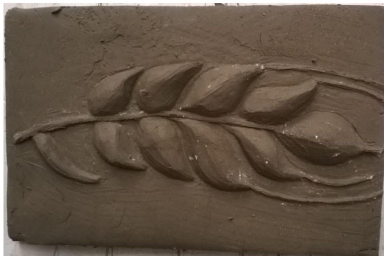
Obr. 21: Pozitiv detailu vyndaný ze sádrového odlitku