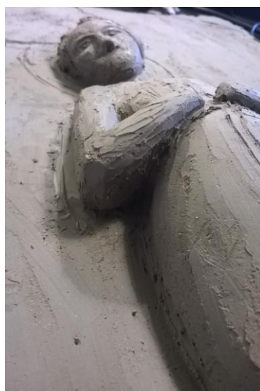
Obr. 14: Nanesení základní hmoty 2