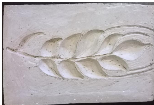
Obr. 20: Sádrový odlitek detailu