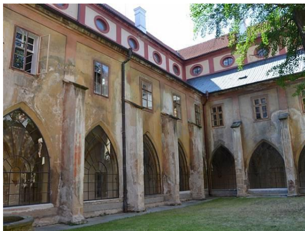
Obr. 7: Pohled z rajske zahrady do křížové chodby