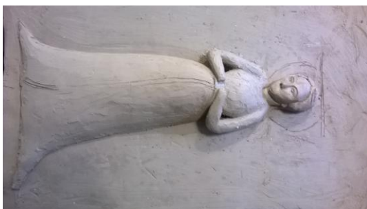
Obr. 13: Nanesení základní hmoty reliéfu 1