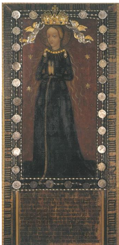
Obr. 9: Kopie obrazu, klášter Schlägl, Rakousko