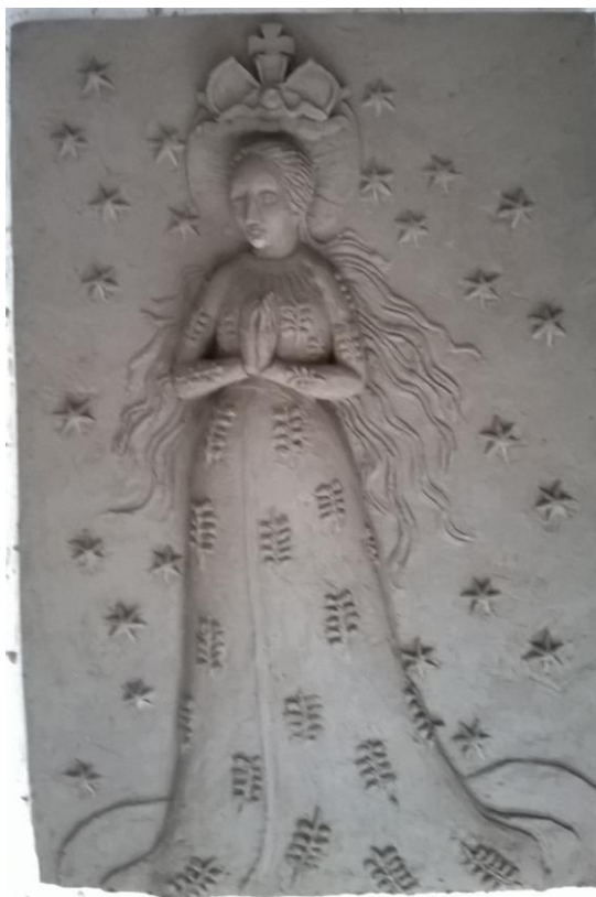
Obr. 19: Pozitiv vyndaný ze sádrového odlitku