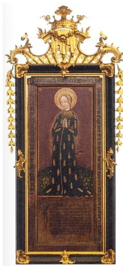
Obr. 10: Originál obrazu, Biskupství České Budějovice