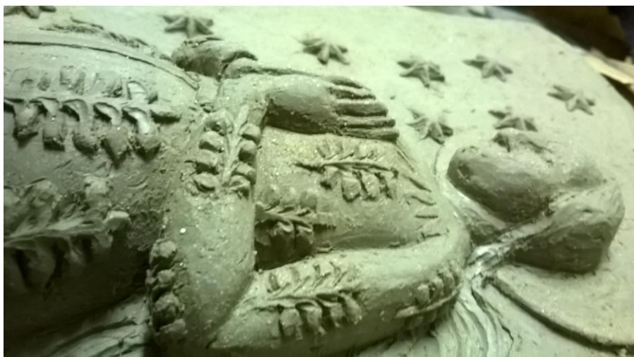
Obr. 16: Postup modelace - detail