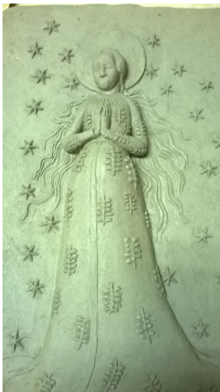
Obr. 15: Postup modelace