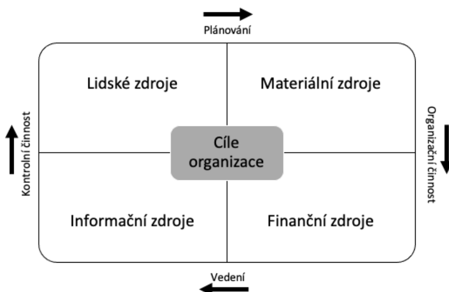
Obrázek 1-Zdroje v organizaci

Josef Koubek rozdělil zdroje v organizaci podle obrázku 1 v němž také definoval proces řízení. O personální politice a strategii, rozhoduje každá společnost sama a stát by do těchto „vod“ vůbec neměl vstupovat. Mohl by totiž zapříčinit potencionální konflikt mezi zaměstnancem a zaměstnavatelem. 1