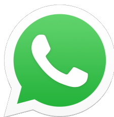
Služby pro okamžité zasílání zpráv