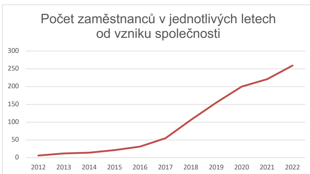
GRAF 1-Počet zaměstnanců v jednotlivých letech

Firma se na trhu objevila poprvé v roce 2011, kdy čítala pouhých 10 zaměstnanců. Od té doby dynamicky rostla a nyní, její tým, čítá více než 300 členů (viz. GRAF 1) rozprostřených na čtyřech pobočkách v Liberci, Jablonci, Mladé Boleslavi a v Ohrazenicích.