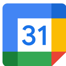
Kalendáře a plánovače

Nástroje pro administraci studia neslouží přímo ke vzdělávání, ale tvoří nedílnou součást vzdělávacího procesu.