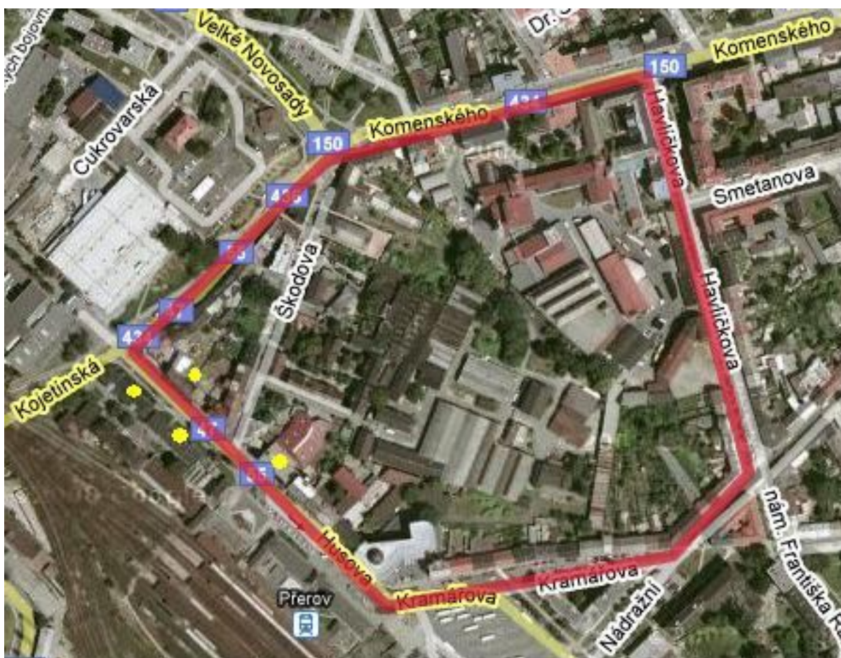
Obr. 1: Znáznornění trasy pochodu Dělnické strany dne 4. dubna 2009

Legenda: červeně je vyznačena trasa pochodu neonacistů, žluté tečky znázorňují polohu domů, které jsou obývány především Romy a mohly být tudíž místem střetů s neonacisty