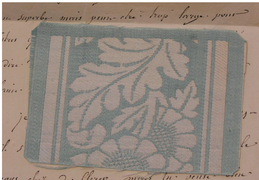
Obr. 3: Vzorek látky zasláný Bertou z Francie Štěpánce do Čech. Příložený u dopisu Berty Štěpánce č. 53.