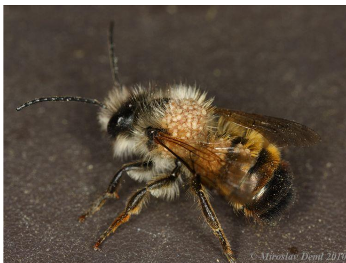
Obrázek 7: Peříčkovník zednicový ( Chaetodactylus osmiae ) na zednici rezavé ( Osmia bicornis )

Dánska či Uralu a na jihu je jeho působení zaznamenáno až na hranicích Balkánského poloostrova. Kromě zednic, kterými se tato práce zabývá, se tento roztoč nachází v hnízdech mnoha včel samotářek (Černý & Šamšínák, 1971). Ke zvýšenému výskytu tohoto roztoče přispívá vyšší vlhkost v hnízdech, kdy ve vhodných podmínkách je schopen za jednu sezónu vyprodukovat až 10 generací. V případě nevhodných podmínek je roztoč schopen vytvořit imobilní encystovanou fázi, kdy je v této podobě schopen vytrvat po několik let, než opět nastanou podmínky pro jeho aktivaci. Kromě konzumace zásoby pylu určeného pro vyvíjející se jedince včel samotářek mohou populaci ohrožovat i přímou konzumací vajíček, či některých pozdějších vývojových stádií. Stěny kokonů však nejsou schopni narušit (Krombein, 1962). Pro prevenci a omezení výskytu roztočů rodu Chaetodactylus je možné použít 0,007% postřík endosulfanu, který se může aplikovat přímo na infikované kokony. V Japonsku byl tento postřík nastříkán ještě do prázdných hnízd, aby se zamezilo šíření Chaetodactylus nipponicus (McKinney & Park, 2013). Pokud však kokony nebyly vyjmuty z infikovaného hnízda, i po aplikování tohoto postříku se zde určitý počet roztočů vyskytoval. Určitou ochranou před těmito kleptoparazity by mohlo být i tepelné ošetření hnízd, neboť v letech, která se vyznačovala vysokými teplotami (v maximech až 40 °C) byla zaznamenána zvýšená mortalita roztočů.