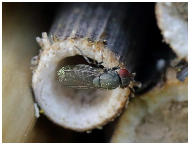
Obrázek 6: Zelenuška včelí ( Cacoxenus indigator )

Mezi kleptoparazity, patří například zelenuška včelí ( Cacoxenus indigator ) (Diptera: Drosophilidae). Dospělí jedinci jsou 3–3,5 mm dlouzí. Samice kladou vajíčka do hnízd O. bicornis a O. cornuta k připraveným zásobám pylu. Kromě dané komůrky, kam je vajíčko zelenušky nakladeno, je larva schopná dostat se přepážkami i do jiných částí. Díky tomu mohou využít potravu, která je určena pro ostatní larvy. Jako ochrana před tímto kleptoparazitem byl v rámci experimentu použit lepidivý papírový proužek umístěný na stranu hnízda, kde tyto kleptoparaziti vyčkávají, až samice opustí hnízdo, aby do hnízda mohli naklásť vajíčka. Na tomto papíře však uvízl pouze omezený počet jedinců tohoto druhu (Stanisavljević, 1996). Jako účinná ochrana se taktéž ukázalo manuální použití aspirátoru. Toto opatření je však ve velkých sadech poměrně časově náročné a nebylo by tak realizovatelné. Populace O. cornuta , které byly v mandloňových sadech ve Španělsku studovány, nebyly příliš tímto kleptoparazitem ovlivněny, nebo pouze minimálně, protože tyto včely dokončily svůj vývoj ještě před vylíhnutím těchto kleptoparazitů. V Itálii bylo taktéž zaznamenáno poměrně malé zasažení druhu O. cornuta tímto druhem. Larvy O. bicornis již však byly více ohroženy,