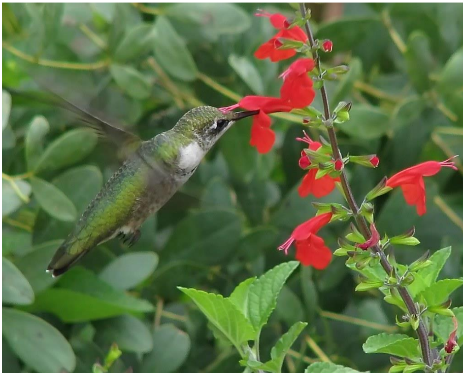
Obrázek 1: Kolibřík rudohrdlý ( Archilochus colubris )

Další významnou skupinou opylovačů jsou ptáci. Nejvíce je tento způsob opylování rozšířen v jižní Americe v tropických oblastech (Slavíková, 2012). Rostliny, které k opylení využívají tato zvířata, bývají výrazně zbarvené (časté jsou červené, modré, žluté a zelené květy). Rostliny také disponují poměrně velkým množstvím nektaru, který ptáky láká. Rostliny specializované na ptačí opylovače nemají vůni. Květ je pro tato zvířata uzpůsoben také tvarem, kdy má většina trubkovitý tvar a více vystupující pylové tyčinky, které uvolní pyl při vniknutí zobáku ke zdroji nektaru. Významným ptačím opylovačem je například kolibřík rudohrdlý ( Archilochus colubris ), kalypa růžovohlavá ( Calypte anna ) nebo šatovník šarlatový ( Drepanis coccinea ). Mezi rody rostlin, které jsou těmito a jinými zvířaty opylovány, patří mimo jiné blahovičník ( Eucalyptus ), akácie ( Acacia ), či bauhinie ( Bauhinia ) (Slavíková, 2012).