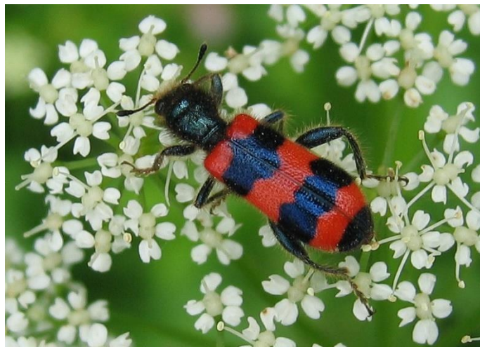
Obrázek 10: Pestrokrovečník včelový ( Trichodes apiarius )

Mezi druhy, kteří ohrožují tyto opylovače, patří například pestrokrovečník včelový ( Trichodes apiarius ) (Coleoptera: Cleriadae). Dospělci dorůstají délky 9-16 mm a jsou rozpoznatelní díky výrazným černočerveným krovkám. Dospělce lze najít zejména na květech miříkovitých rostlin (Apiaceae). Samičky pokládají svá vajíčka do hnízd samotářských včel, ale vyskytuje se i v hnízdech včel medonosných. Z vajíčka se následně líhne larva, která je schopna pozřít larvy včel. Larvy jsou charakteristické červeným zbarvením a jejich vývojový cyklus trvá celou sezónu. Při výzkumu Krunic et al. (2005) byly zejména tyto larvy nacházeny v hnízdech sestrojených z lamel a v omezené míře v hnízdech z rákosí u druhů Osmia bicornis a Osmia cornuta . Larva se ve většině případů dostala i do ostatních komůrek, kde se živila dalšími larvami opylovačů.