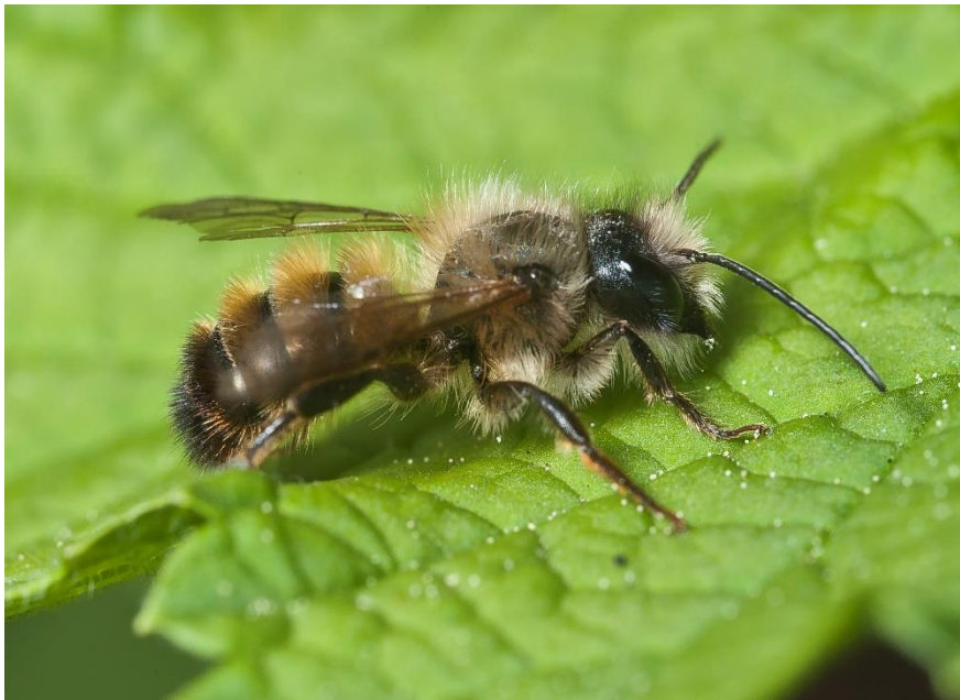
Obrázek 3: Zednice rezavá ( Osmia bicornis )

Jejich přirozený výskyt je pozorován hlavně u okrajů lesů, případně v zahradách a jiných synantropních oblastech, kde má dostatek potravy. Tento druh se na rozdíl od O. cornuta vyskytuje i ve vyšších oblastech (Macek et al. , 2010; Šlachta et al. , 2020).