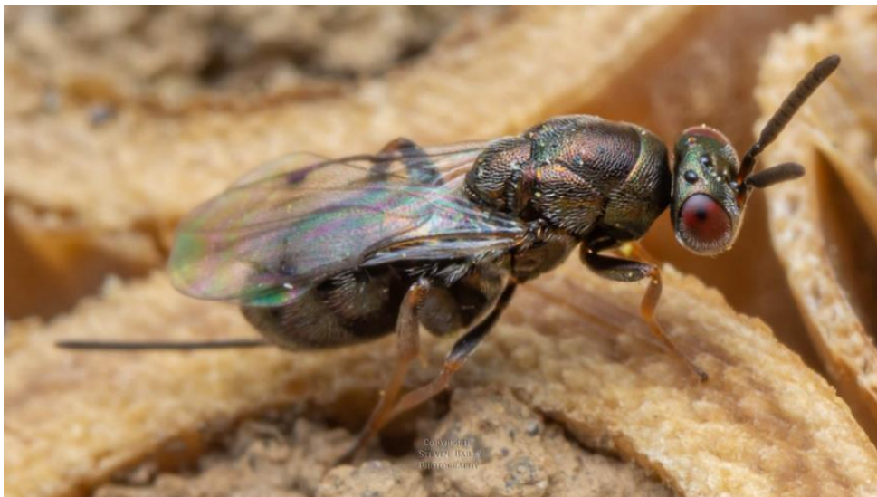
Obrázek 8: Monodontomerus obscurus

Melittobia acasta (Hymenoptera: Eulophidae) je druh chalcidky, která působí velké škody v populacích samotářských včel a čmeláků. U tohoto druhu je přítomný velký pohlavní dimorfismus a poměr pohlaví je velkou měrou nakloněn k samicím (95 % jsou samice). Díky svému rychlému vývojovému cyklu (okolo 2 týdnů) je tato chalcidka schopna vyprodukovat několik generací za sezónu. V případě výzkumu Krunic et al. (2005) bylo ale v okolí Bělehradu nalezeno pouze několik jedinců v hnízdech O. cornuta .