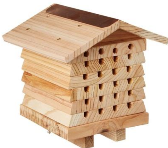
Obrázek 5: Malé hnízdo s deskami

Závěr výzkumu Bosche & Kempa (2005) byl, že umístění vytvořených hnízd do oblasti má pravděpodobně kladný vliv na zvýšení populace opylovačů. Po umístění hnízdících pomůcek bylo dosaženo výrazného zvýšení populace O. bicornis , a to v tempu 2,8násobku počtu těchto opylovačů za 1 rok. Tento vysoký přírůstek však mohl být dán i příznivými podmínkami, které po dobu výzkumu panovaly. Dalším aspektem, který mohl napomoci k takovému výsledku, mohl být výběr hnízdního materiálu. Použité bambusové větvičky nejsou tak snadno osidlovány parazity, kteří by mohli mít negativní vliv na vývoj zejména kokonů O. bicornis .