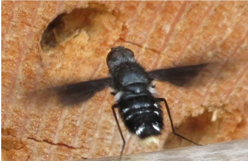
Obrázek 9: Černule obecná ( Anthrax anthrax )