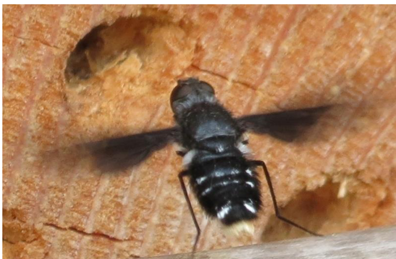
Obrázek 9: Čermule obecná ( Anthrax anthrax )