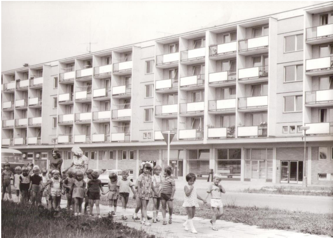
Obrázek 8 Plzeňská ulice

V 70. letech se bytová výstavba soustředila do tří oblastí – Přednádraží, u polikliniky a v ulici Na Stromořadí. Na ulici Gen. Svobody bylo v roce 1982 dobudováno 372 bytů včetně mateřské školy, jeslí a obchodu. Další velkou stavbou v rámci akce Z byl krytý zimní stadion (budovaný 1976 - 1980). V roce 1988 pokračovala výstavba 69 bytů v Nemocniční ulici a individuální výstavba Na Stromořadí. V ulici Gen. Svobody bylo téhož roku vybudováno dalších 148 bytů. V rámci 8. pětiletky se plánovala i výstavba asi 100 bytů v rodinných domcích v ulici Na Nivách a na tehdejší třídě Rudé armády (dnes Šternberská ulice). V nových bytech bydlelo v polovině 80. let téměř 8300 obyvatel. 2