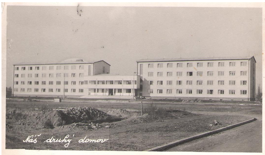
Obrázek 1 Budova Středního odborného učiliště a internátu