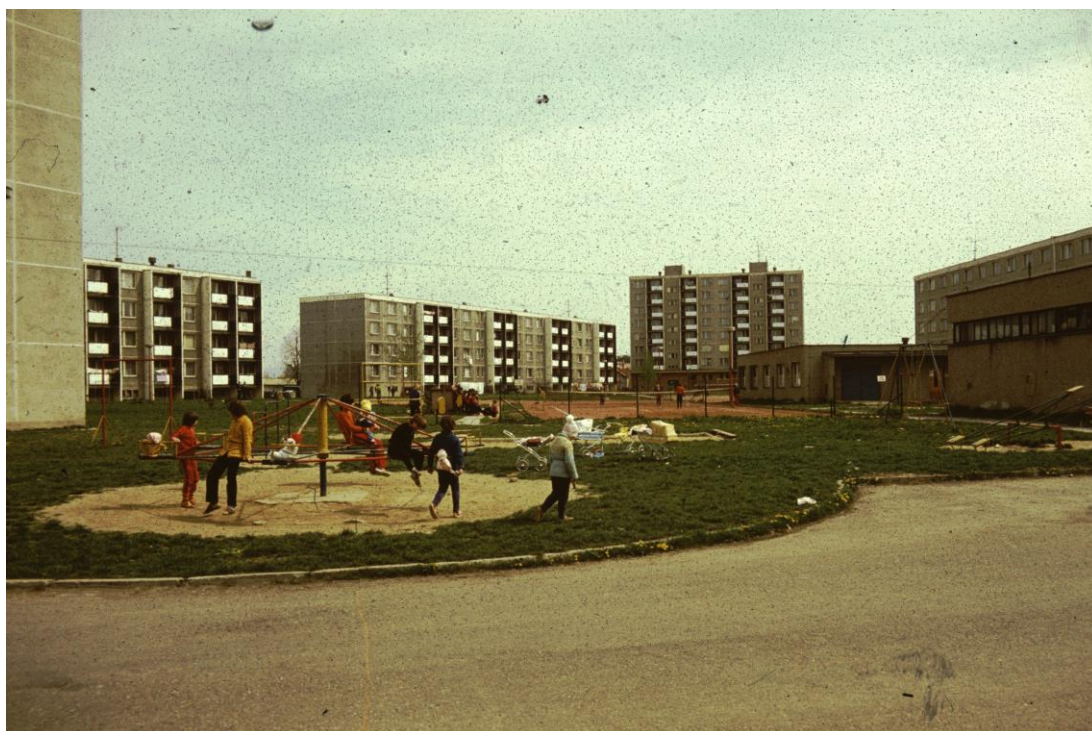
Obrázek 12 Sídlištní vnitroblok s budovou SBD (nízká budova uprostřed)

Pod strojírny spadalo 210 bytových jednotek I. kategorie na ulicích Plzeňská, Dukelská, Mohelnická, Gen. Svobody a Pionýrů.