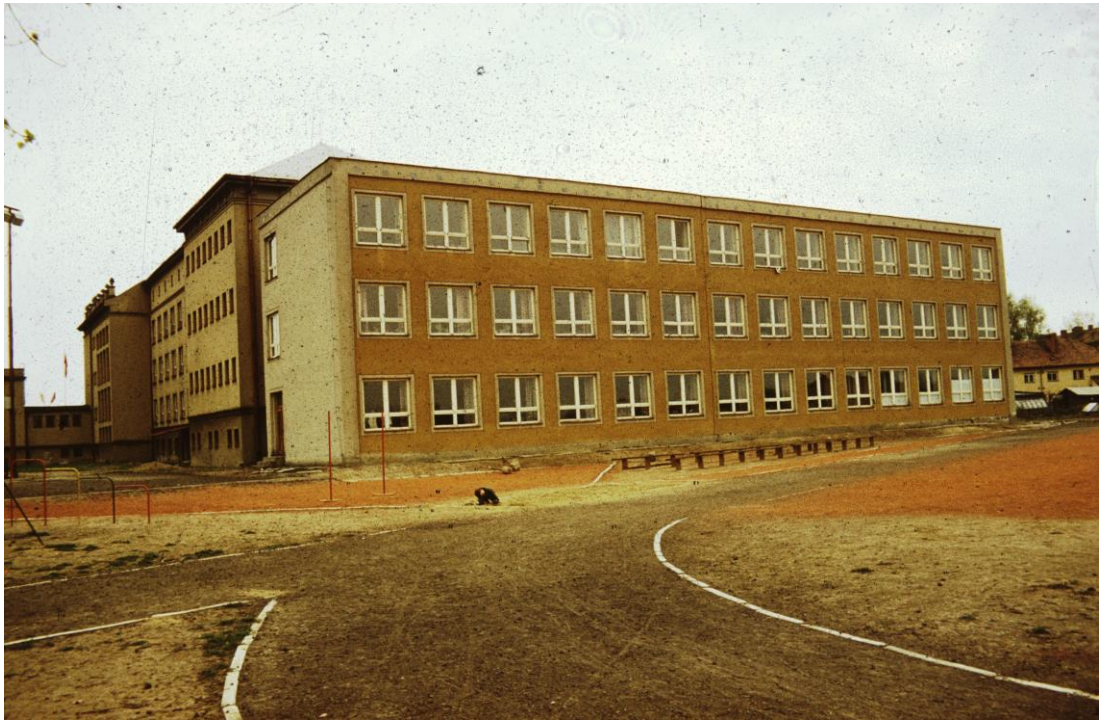
Obrázek 16 Přístavba ZDŠ Pionýrů

V roce 1970 měla ZDŠ Pionýrů 26 tříd s 859 žáky, ale jen s 19 provozuschopnými učebnami. Některé učebny navíc měla škola pronajaté v prostorách gymnázia, u kterého se však počítalo s přechodem ze třítřídního na čtyřtřídní, což by znamenalo výstavbu dalších učeben. K tomuto kroku nakonec vedení Uničova ve spolupráci s ONV sáhlo a v září 1970 byl schválen projekt na přístavbu pěti tříd, tří kabinetů a hřiště v celkové hodnotě téměř 1,5 mil. Původně se mělo stavět již v letech 1971 a 1972. Cílem bylo dosáhnout alespoň dočasného řešení do doby, než bude vybudována nová ZDŠ U Stadionu. V letech 1972 – 1974 se v další etapě měly přistavět další 4 třídy, kabinety s příslušenstvím a v návrhu bylo i oplocení celého areálu školy.