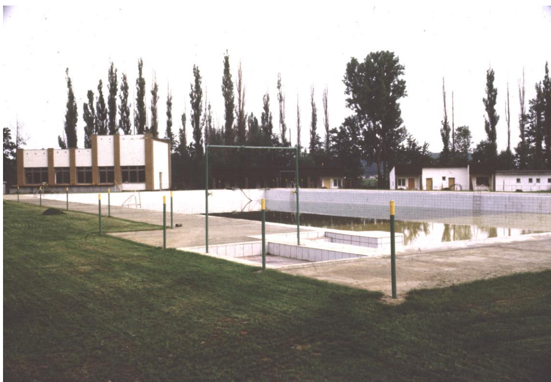
Obrázek 23 Koupaliště před nynější rekonstrukcí

Plán rekonstrukce se začal zpracovávat v roce 1977. S pracemi se počítalo v letech 1978 – 1980. Opravami byly pověřeny Technické služby Uničov. 74 Projektovou dokumentaci dostal na starost Agroprojekt Olomouc. Byla zjištěna potřeba zesílit betonové dno. 75