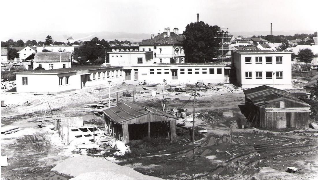
Obrázek 15 Školka a jesle na Plzeňské ulici