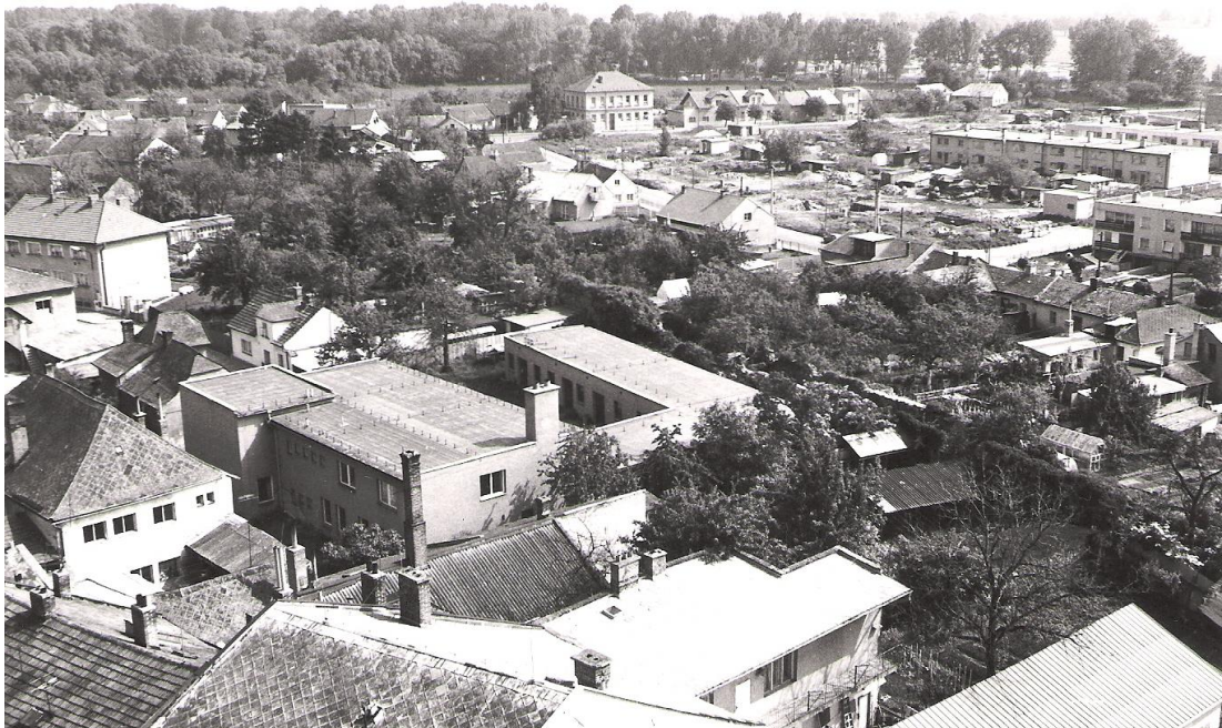
Obrázek 10 Individuální výstavba, Sad míru a na ulici Rudé armády (dnes Šternberská)