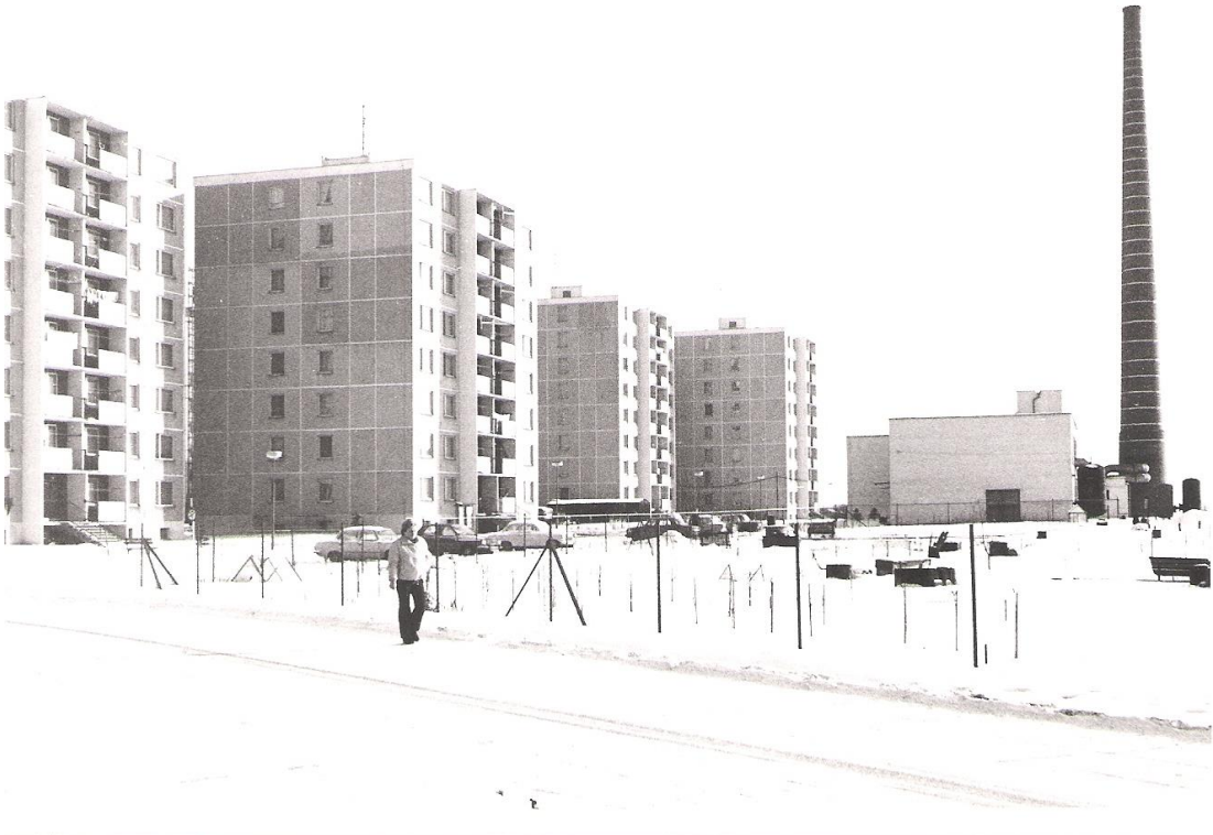
Obrázek 9 Sídliště na ulici Nemocniční