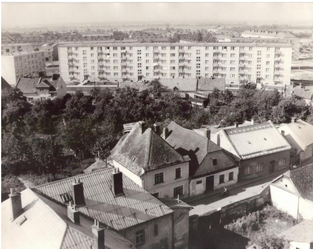
Obrázek 19 Sídliště na ulici Hrdinů