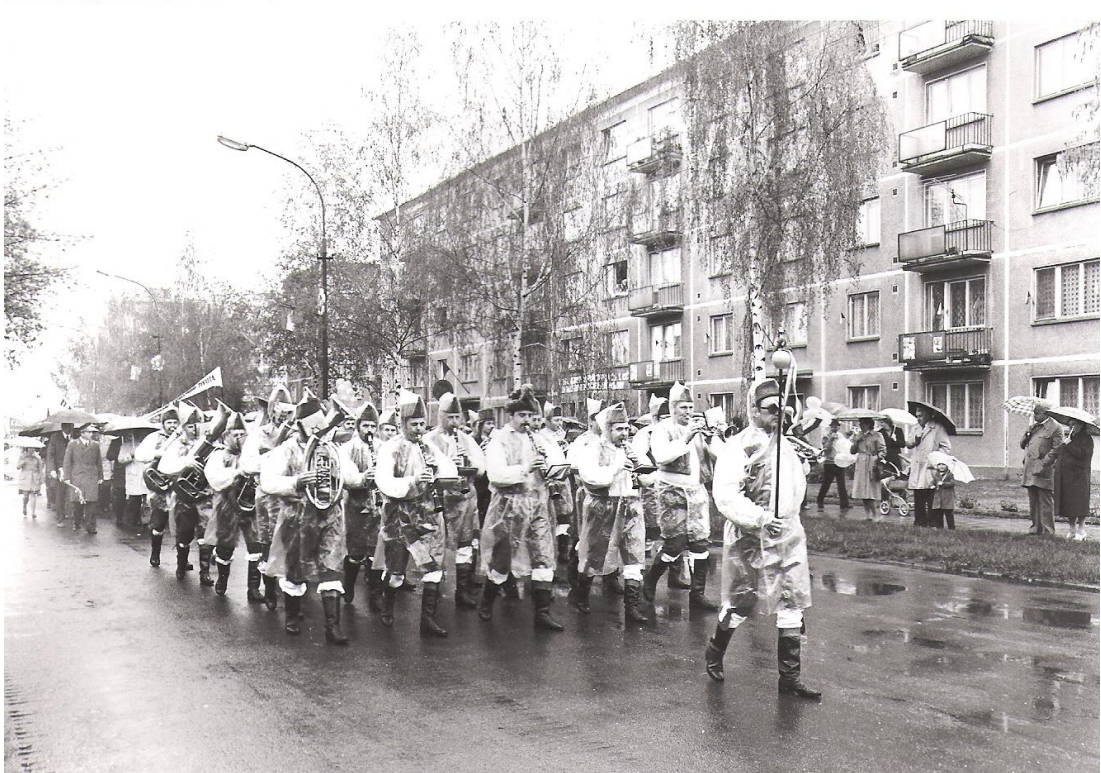
Obrázek 5 Dukelská ulice

Od roku 1970 zahájily i strojírný výstavbu stabilizačních bytů, a sice poblíž svého učiliště, dále na dnešních ulicích Mohelnická, Plzeňská a Nová (tehdy Gerasimenkova). Celkově se budovalo 140 nových bytových jednotek. První byty byly předány k užívání v listopadu 1972. V té době se jednalo o velmi moderní byty. V přízemí těchto budov zahájily provoz nové prodejny a poskytovatelé služeb. V květnu 1975 došlo k otevření nového moderního kina Družba.