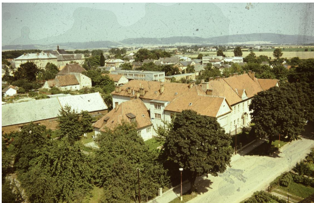
Obrázek 18 Budova gymnázia bez přístavby, vzadu stojí nová budova školky

V roce 1979 byla zahájena přístavba ke staré budově s plánovaným dokončením v roce 1981. Dodávky armatury zajišťovaly Lesostavby, montáž konstrukce pak Pozemní stavby a Prefa Olomouc. 43