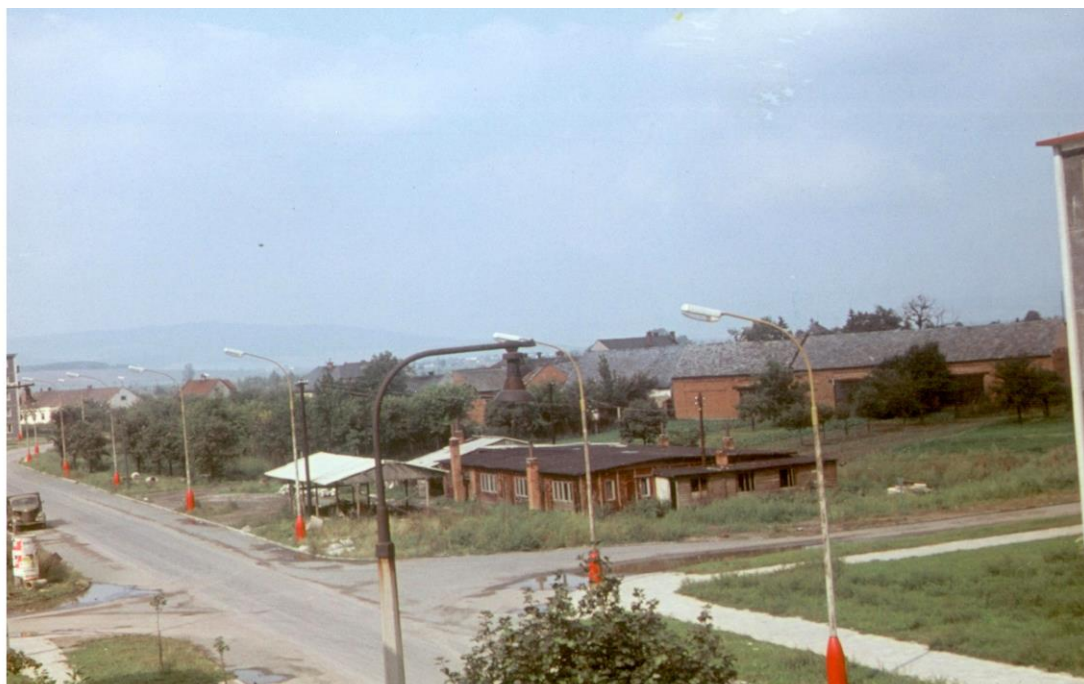
Obrázek 21 Prostor, kde nyní stojí nákupní středisko bývalé Jednoty (dnešní Albert)

Olomouc Dokončení bylo naplánováno v prosinci 1977. Projektantem byl Obchodní projekt v Olomouci. 72