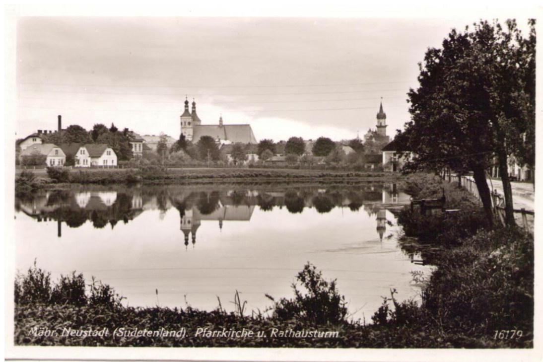
Obrázek 20 Bývalý rybník na Olomoucké ulici, nyní zastavěná plocha