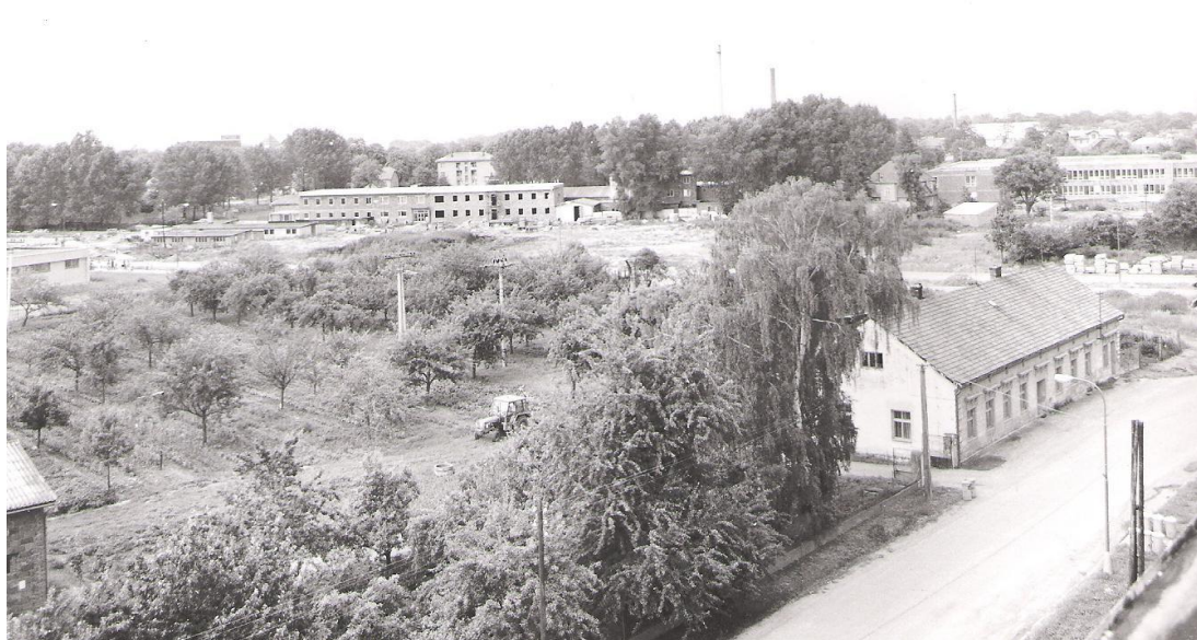
Obrázek 13 Zahájení prací na výstavbě sídliště Gen. Svobody

Nově vystavěné domy měly mít nejvýše 8 podlaží a v okolí se počítalo se zelení (15 m 2 /obyv.) a hřišti pro děti. Samotné zahájení staveb bylo naplánováno pro rok 1973, u prodeje o rok dříve.