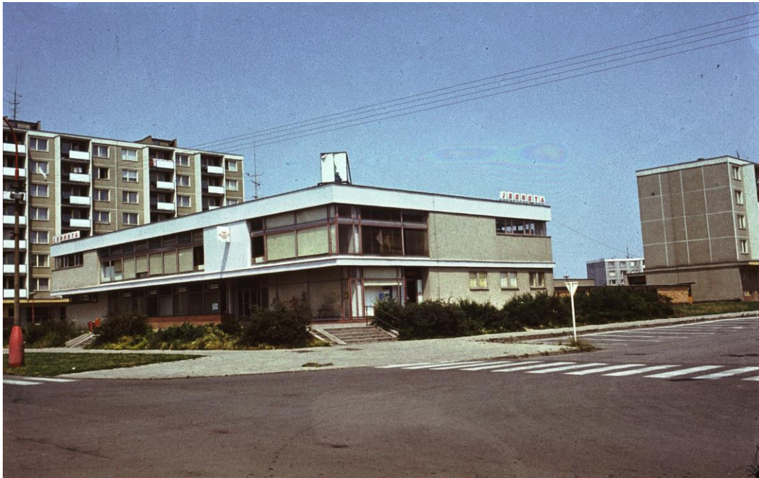
Obrázek 22 Nákupní středisko Jednota (nyní Albert)