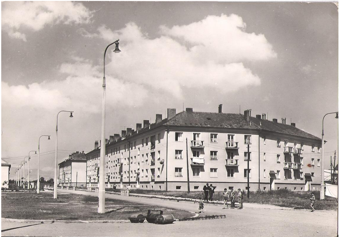
Obrázek 3 Sídliště na ulici Pionýrů

V roce 1958 již bydlelo na nově vystavěném sídlišti 2762 osob, což bylo téměř třikrát víc než ve starém (vnitřním) městě, kde žilo 984 obyvatel. Pro potřeby obyvatel byla otevřena také poliklinika (1963) a nové autobusové nádraží na ulici Jiřího z Poděbrad (1964).