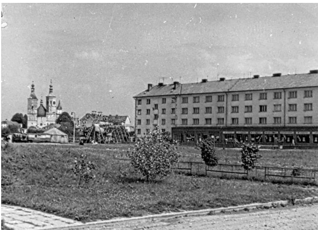
Obrázek 2 Fučíkovo (nyní Moravské) náměstí