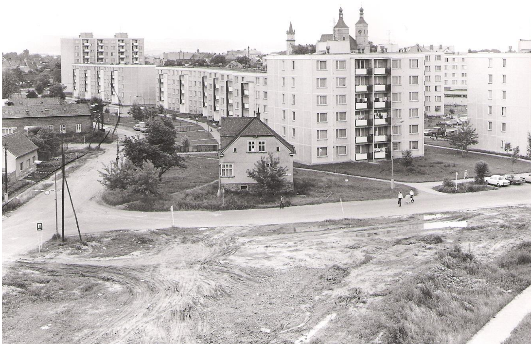
Obrázek 7 Křižovatka ulic Dukelská a Mohelnická