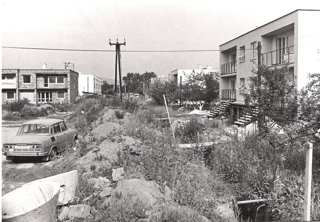
Obrázek 11 Řadová zástavba na Sadu míru, 1981

Ve zpravodaji 12/1986 byli občané nabádáni k stavbě rodinných domků, k čemuž je měl motivovat i státní příspěvek ve výši až 35 tisíc Kčs s možností navýšení o 15 tisíc Kčs u skupinové (řadové) výstavby. U těchto staveb byl i projekt zdarma a zvýhodněná cena stavebního pozemku. Navíc se vyskytly i volné pozemky ve Střelicích, které bylo třeba zaplnit. Vedle státního příspěvku bylo možno získat od zaměstnavatele i stabilizační příspěvek ve výši 10 nebo 20 tisíc Kčs dle odvětví a pracovního zařazení. Další peníze mohli občané získat jako půjčku od spořitelny ve výši 250 tisíc na jednobytový a 300 tisíc Kčs na dvoubytový rodinný dům s dobou splatnosti 40 let a úrokovou sazbou 2,7%. U skupinových domů byly v obou případech půjčitelné částky poloviční, ale s úrokovou sazbou jen 1%.