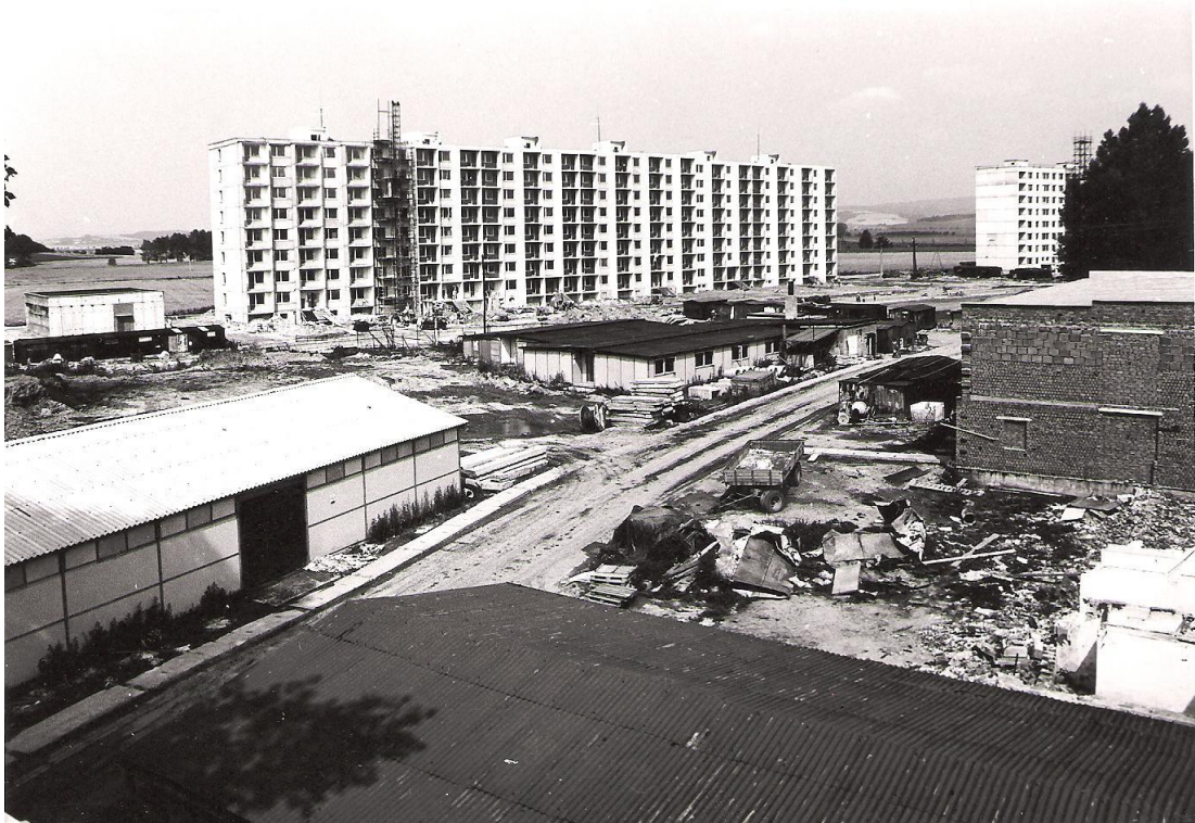
Obrázek 14 Výstavba sídliště Gen. Svobody

V neokrskové vybavenosti měla být ponecháno plošná rezerva pro umístění menšího hotelu s restaurací o kapacitě 50 lůžek a 140 míst. Stavba hotelu byla označena za účelovou investici Restaurací a jídelen Olomouc podle jejich požadavků z 25. února 1975. Stavba měla stát na křižovatce Mohelnická – Hrdinů. Jako nejvážnější byla označena nutnost výstavby 22třídní ZDŠ U Stadionu na jižní straně kvůli již zmiňovaným přetlakům ve stávajících základních škol v Uničově. Škola měla mít oproti nynější podobě ještě o jedno patro víc a součástí školy měl být i krytý bazén. Škola už tenkrát měla být specializovaná jako sportovní. Z důvodu přesunu peněz na ONV Olomouc nebyly škola dokončena podle původního plánu. Pro všech plánovaných 1200 b.j. se objevila i potřeba vybudování vodojemu na Benkovském kopci a rozšíření prameniště v Haukovicích. Navíc se ještě musela vybudovat kanalizace na západní straně území, pro přívod plynu se počítalo s vybudování vysokotlaké přípojky a středotlaké regulační stanice s rozvodem. Zmíněné stavby byly podmiňujícími investicemi nárokovány SmKNV v Ostravě.