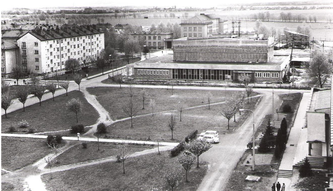
Obrázek 6 Výstavba kina, foto z r. 1975