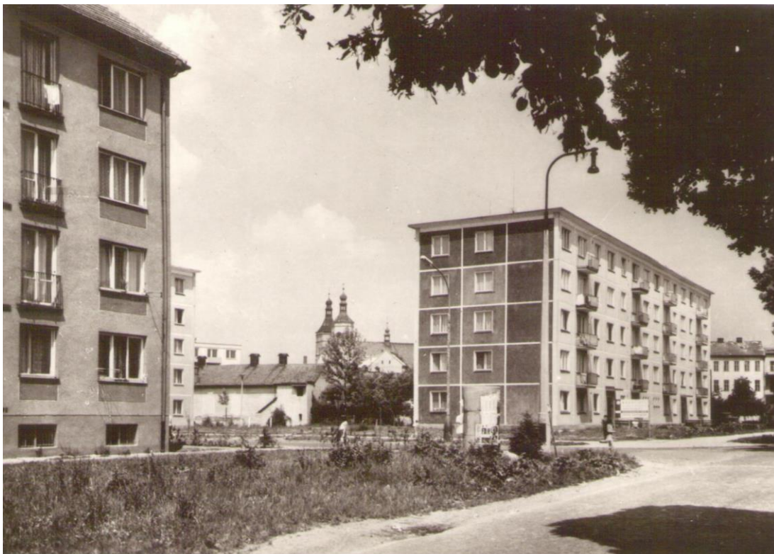
Obrázek 4 Křižovatka ulic Dukelská a Litovelská

V roce 1965 nahradilo státní bytovou výstavbu budování družstevních a stabilizačních bytů. Nejrozsáhleji se to týkalo ulice Dukelská, kde vyrostla řada čtyřposchodových bytů. Vedle toho se stavěly i rodinné domky (ulice Olomoucká, Na Nivách, v Brníčku,...). Kromě Uničovských strojíren budovaly byty pro své zaměstnance i další podniky (cukrovar či Severomoravské dřevařské závody).