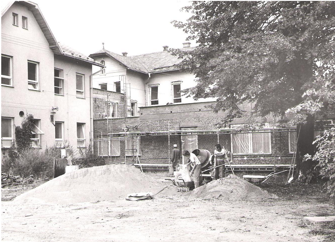
Obrázek 24 Přístavba polikliniky v akci Z, fotografie z roku 1982

V roce 1979 probíhala II. stavba. Měla sloužit jako pohotovostní lékařská služba s plánovaným dokončením v roce 1981 při nákladech 200 tis. Kčs. 90