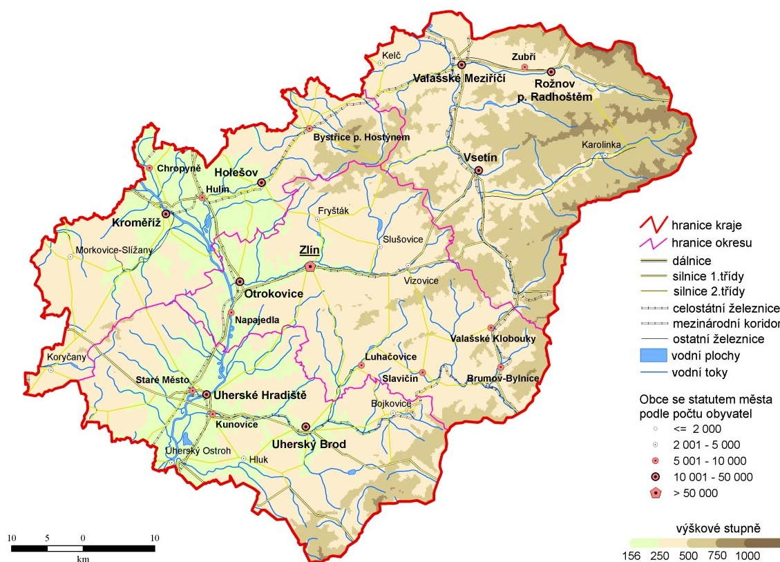
Obrázek 2: Geomapa Zlínského kraje

Pro větší celistvost výkladu o vsetínském okrese lze uvést obrázek, na kterém je možné pozorovat velikost vsetínského okresu vzhledem k velikosti kraje, geografické podmínky kraje a počet obyvatel ve vybraných městech kraje.