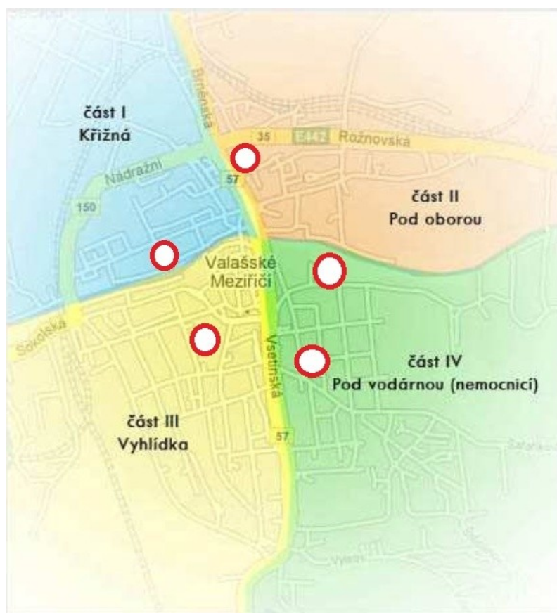
Obrázek 3: Mapa částí města Valašské Meziříčí s vyznačenými ZŠ

Zdroj: Upraveno, Valašské Meziříčí, 2017