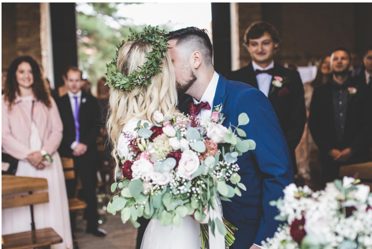
Obrázek 4: Věneček do vlasů.

Svatební kytice není jedinou možností květinové dekorace pro nevěstu. V dnešní době jsou velmi oblíbené květinové přízdoby do vlasů v podobě věnečků, samostatných květin nebo květů připevněných k závoji či klobouku, pokud je součástí svatebního oděvu nevěsty. U přízdob pro nevěsti i korsáže u ženicha, je nutné vzít v potaz trvanlivost květin, jejich váhu a čistotu, aby neuvadly, nespadly nebo nezašpinily oblek či šaty (Haake 2010).