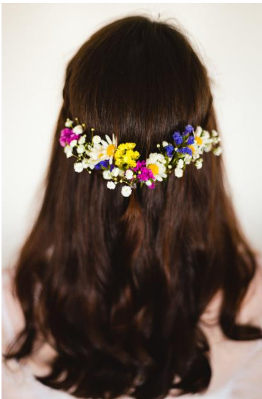
Obrázek 40: Květiny jako ozdoba vlasů

Další ozdobou pro nevěstu, svědkyně nebo třeba družičky je květinový náramek. Tento byl vytvořen zapichováním jednotlivých drátkem zpevněných květů do aranžérské hmoty, připevněné ke stuze pro uvázání kolem ruky. Náramek je zhotoven pouze z planých rostlin, a to z květů hrachoru ( Lathyrus sylvestris ), řebříčku ( Achillea millefolium ), a zlatobýlu ( Solidago canadensis ).