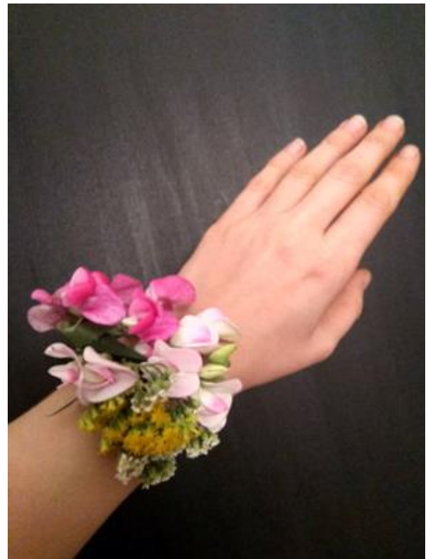
Obrázek 41: Květinový náramek na ruku