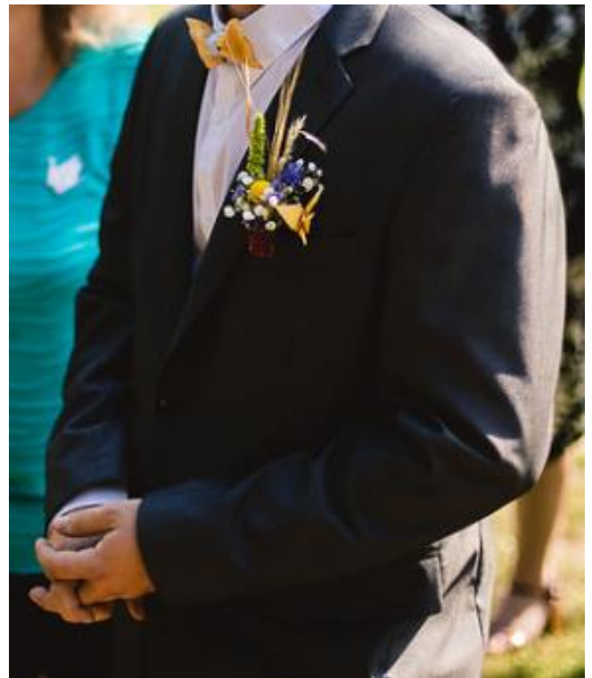
Obrázek 39: Ženichova korsáž na srpnovou