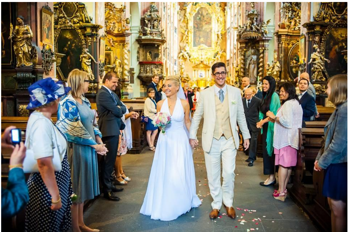
Obrázek 1: Svatba v kostele.

Květiny by měly s vybraným místem korespondovat, proto například rozlehlé gotické kostely a kaple s výrazně ozdobným interiérem nejdou ruku v ruce s použitím jemných textur divokých květin. K většině církevních budov různých stavebních stylů se hodí spíše klasická