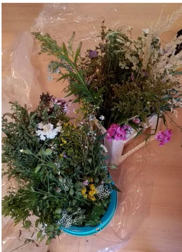
Obrázek 7: Nasbírané plané rostliny

Následující kapitola předkládá jednotlivé plané druhy květin a trav vybrané za účelem jejich využití do svatebních vazeb a květinových dekorací. Kvetení jednotlivých planých květin je porovnáno v tabulce kvetení (Příloha I).