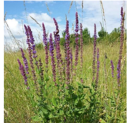
Obrázek 24: Salvia nemorosa