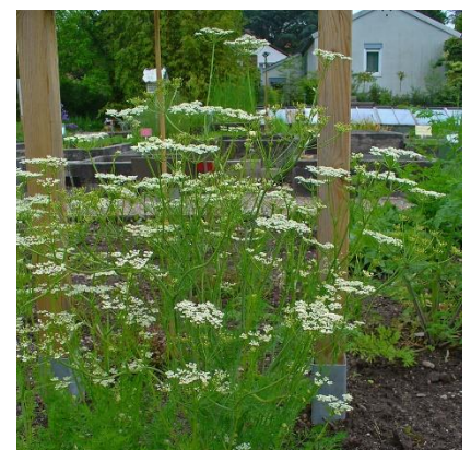
Obrázek 11: Carum carvi

(McClintock & Fitter 1978; Deyl 2001; Kubát 2002)