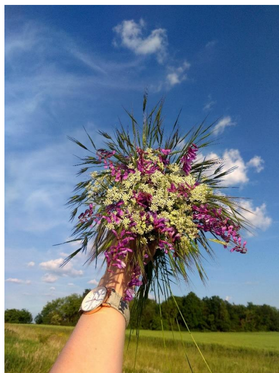
Obrázek 32: Kytice s využitím travin