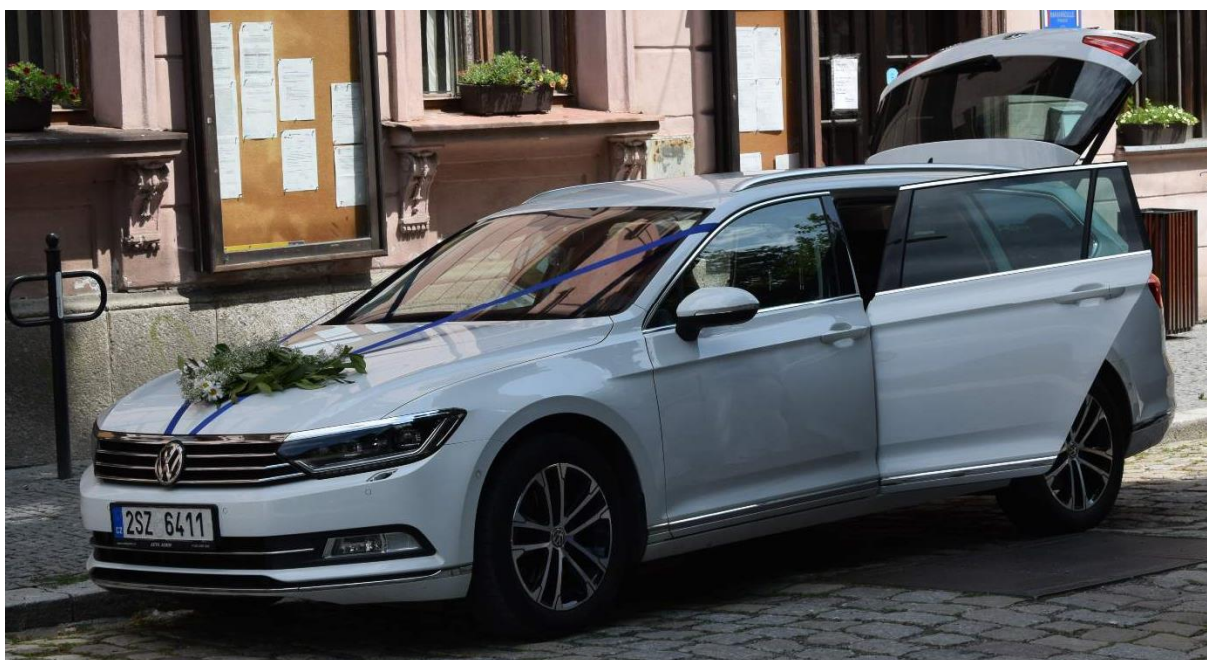
Obrázek 48: Dekorace na auto s kopretinami ( Leucanthemum vulgare )

Vytvořená svatební dekorace na automobil byla pouze dozdobena jedním druhem plané květiny, a to kopretinou bílou ( Leucanthemum vulgare ), která svou velikostí a barvou květu tvořila hlavní kompoziční prvek. Základ aranžmá byl vytvořen větvemi bobkovišně lékařské ( Prunus laurocerasus ) v kombinaci s letorosty ptačího zobu obecného ( Ligustrum vulgare ), tato zeleň byla mimo kopretiny doplněná i šaterem latnatým ( Gypsophila paniculata ). Ten je známý spíše pod jménem nevěstin závoj, a dodává celé ozdobě jemnější dojem. Výsledná dekorace trojúhelníkovitého až půlkruhovitěho tvaru byla vytvořena za pomoci drátků tloušťky 0,8 mm. Aranžmá bylo vycentrováno na kapotu automobilu novomanželů, přichyceno speciálními přísavkami s háčkem a upevněno modrou širokou stuhou.