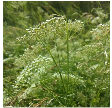
Obrázek 15: Falcaria vulgaris

(McClintock & Fitter 1978; Deyl 2001; Kubát 2002)