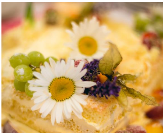
Obrázek 46: Květinová dekorace na dort