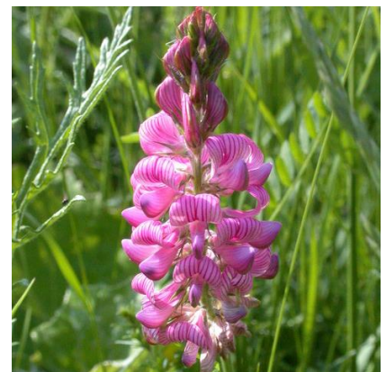
Obrázek 23: Onobrychis viciifolia

(McClintock & Fitter 1978; Deyl 2001; Kubát 2002; Fletcher 2004)