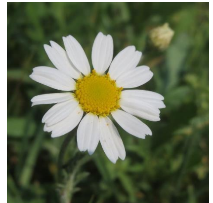
Obrázek 10: Anthemis arvensis

(McClintock & Fitter 1978; Deyl 2001; Kubát 2002)