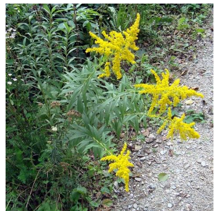
Obrázek 25: Solidago canadensis