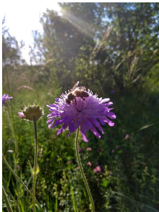
Obrázek 8: Knautia arvensis na louce