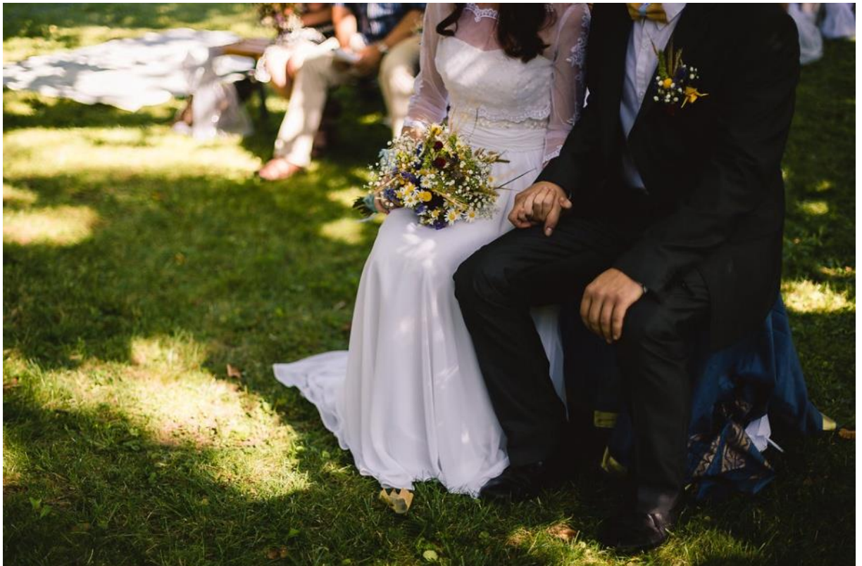
Obrázek 49: Svatební kytice a korsáž pro novomanžele

Celá kompozice vazeb a aranžmá je rozvolněná, což perfektně kopíruje charakter využití lučních květin, které sami o sobě působí divoce a nespoutaně. Tuto vlastnost podporuje i rozdílný výběr rostlinného materiálu na jednotlivé prvky svatebního kompletu. Nejedná se proto o zcela stejný sortiment rostlin, využitý například ve svatební kytici pro nevěstu a kytice pro maminky, jsou zde samozřejmě použité i květiny stejného druhu, které komplet ucelují. Kytice se také liší svou velikostí, kdy nevěstina je větší než ostatní svatebčané. Kytice pro maminky nebo také pro svědkyně mají velmi často ve vazbě zakomponovanou jednu výraznou velkokvětou rostlinu jako je například jirina ( Dahlia ) nebo slunečnice ( Helianthus ).