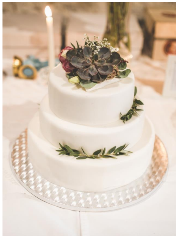
Obrázek 6: Svatební dort s květinami.