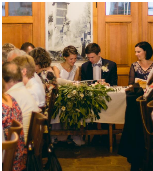
Obrázek 45: Převislá květinová dekorace