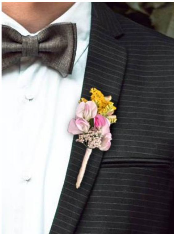
Obrázek 38: Korsáž z planých květin;

Druhá ukázka korsáže byla vytvořena vypichováním jednotlivých rostlin do malého kousku aranžovací hmoty, připevněném na plastovém podkladu. Z volně rostoucích druhů byly použity pouze Centurea cyanis (chrpa modrá) a Calamagrostis epigejos (třtina křovištní).