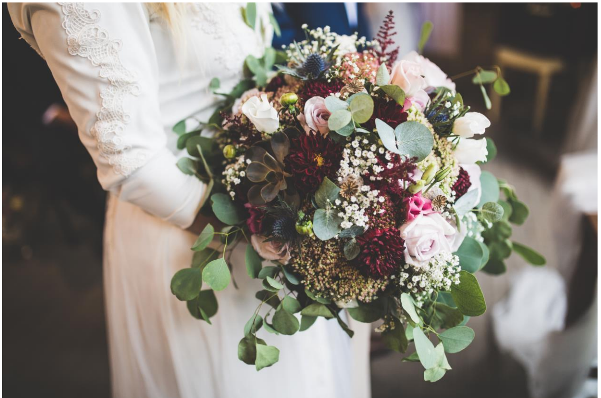
Obrázek 3: Svatební kytice.

Květinové vazby nebo dekorace převážně z planých květin jsou nejčastěji kombinací menších květů květenství bez dominantní rostliny. Celé aranžmá působí jako rozkvetlá louka (Siegfried 2017).