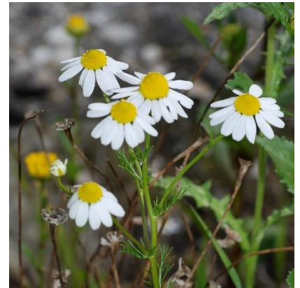
Obrázek 21: Matricaria recutita