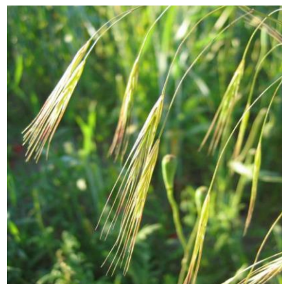
Obrázek 28: Bromus sterilis