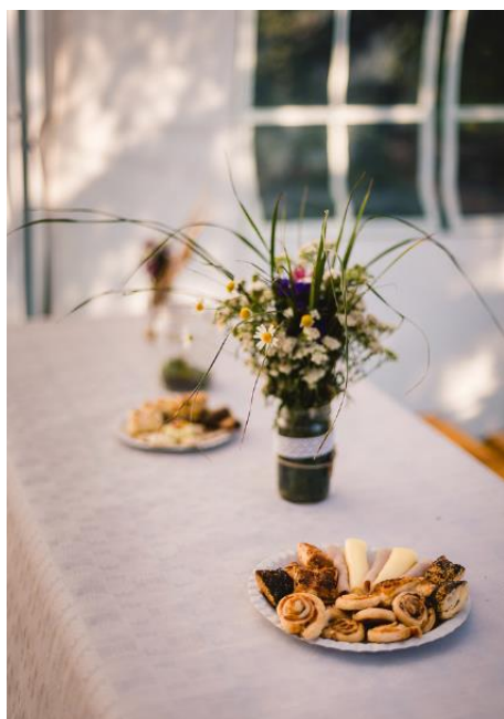
Obrázek 44: Květinová dekorace na stůl

Pro červnovou svatbu bylo zkonstruováno aranžmá na čelo stolu, s použitím vavřínu jako základu pro převislou dekoraci, který byl z planých rostlina doplněn pouze o kopretiny ( Leucanthemum vulgare ). Vavřín byl spojen do požadovaného tvaru dráty a jimi byl také přichycen ke stolu. Další rostliny se na vavřínový základ napojovaly drátky.