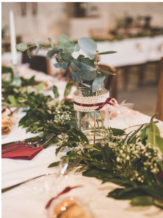
Obrázek 5: Dekorace na jídelní tabuli.

V dnešní době je stále častější mít květinami ozdobený i svatební dort. Květy či lístky mohou být stejné, jako druhy použité pro svatební kytici a další dekorace, ale je nutné klást důraz na výběr vhodných druhů (Janečková 2008).