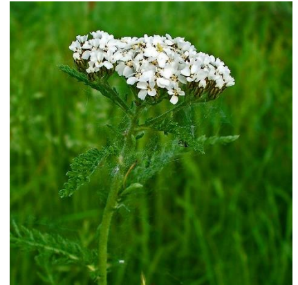
Obrázek 9: Achillea millefolium

(McClintock & Fitter 1978; Deyl 2001; Kubát 2002; Fletcher 2004)