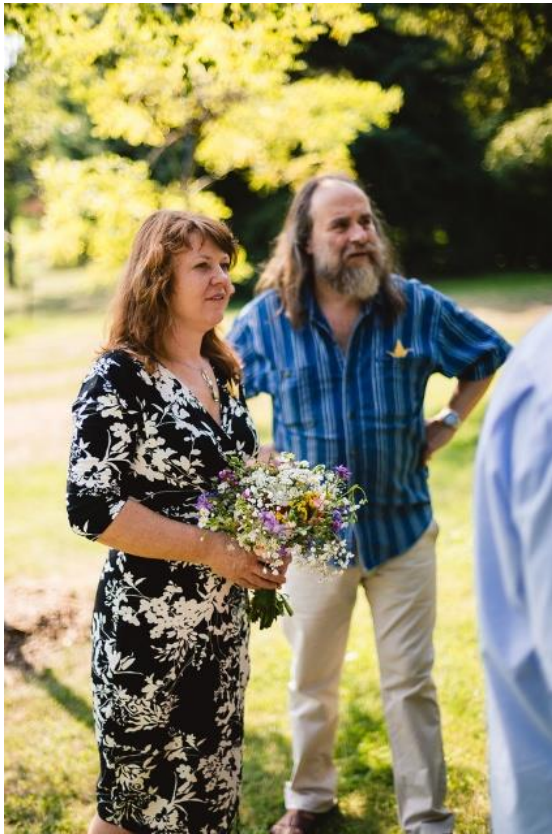
Obrázek 50: Kytice pro maminku