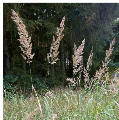
Obrázek 29: Calamagrostis epigejos