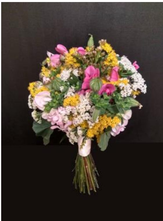
Obrázek 33: Kytice z planých květin