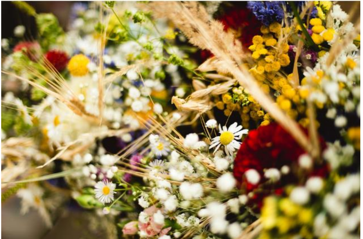
Obrázek 30: Příklady planých rostlin do vazeb: Calamagrostis epigejos , Matricaria recutita , Tanacetum vulgare ; Zdroj: David Vávra

Použité rostliny byly nasbírané zejména na loukách u polí, na mezích, na okraji lesů či podél cest v okolí Slaného, Kostelce nad Černými lesy, Kladna a Prahy. Květiny byly poté do jednoho dne využity pro vytvoření daných vazeb a dekorací a některé použity i na svatbách.