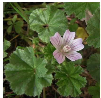
Obrázek 20: Malva neglecta