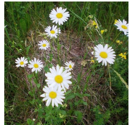
Obrázek 19: Leucanthemum vulgare