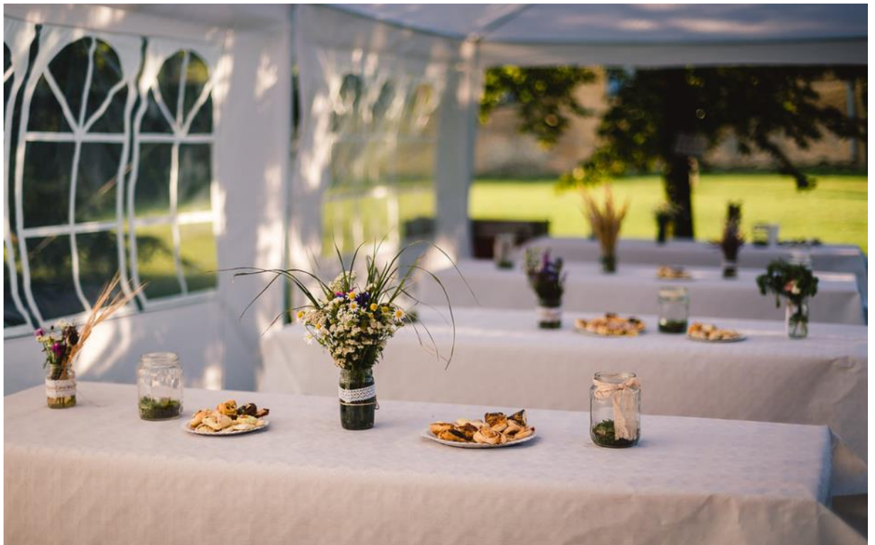
Obrázek 52: Květinová dekorace na jídelní tabuli