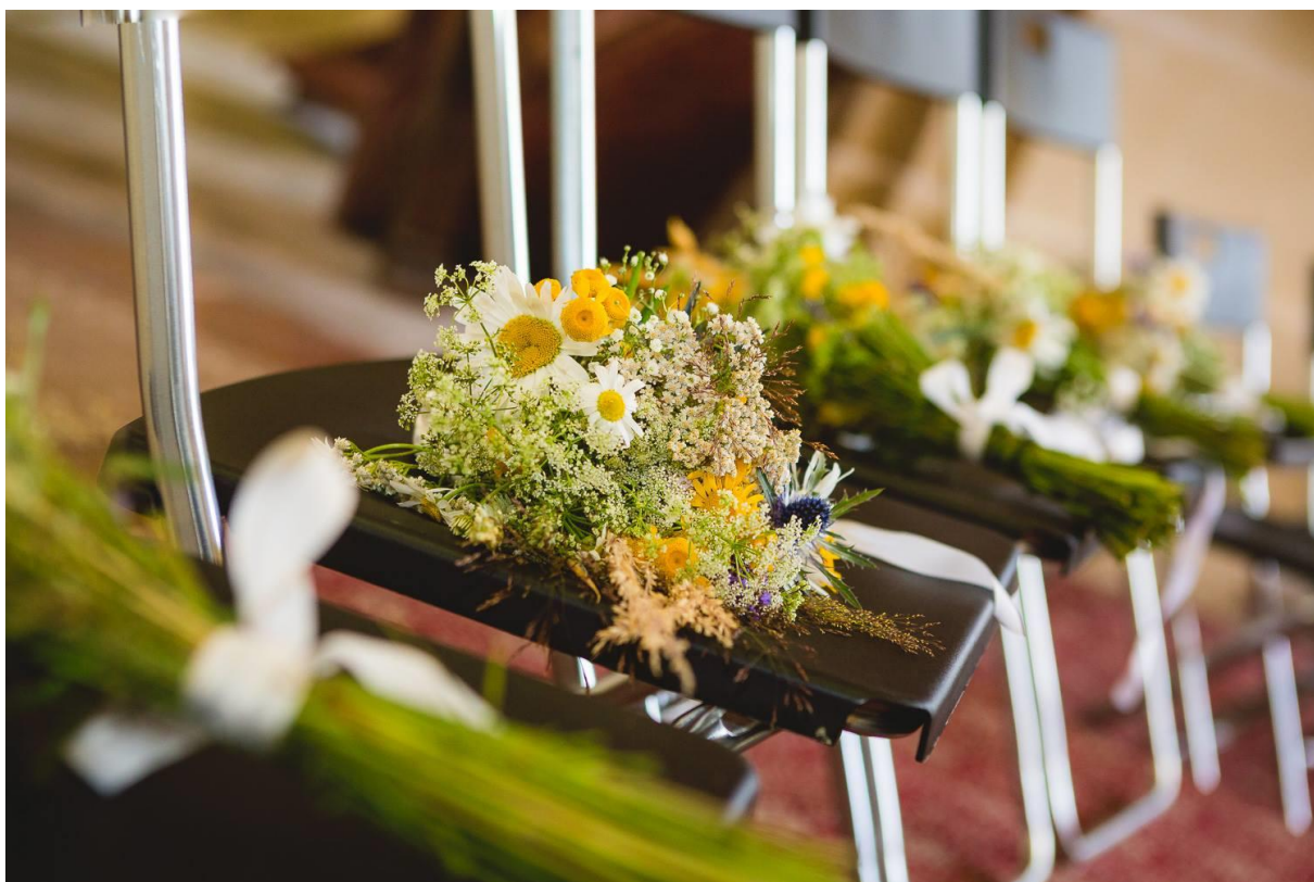
Obrázek 35: Kytice pro družičky převážně z planých květin