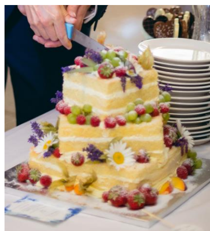
Obrázek 46: Květinová dekorace na dort