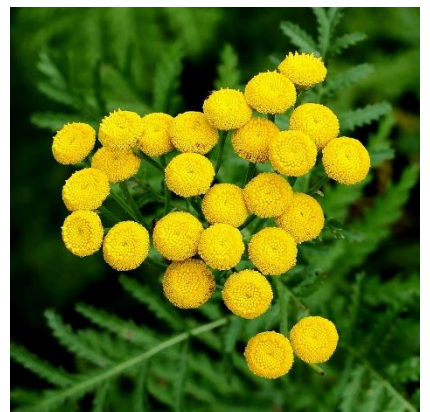
Obrázek 26: Tanacetum vulgare

(McClintock & Fitter 1978; Deyl 2001; Kubát 2002; Fletcher 2004)