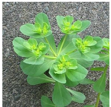
Obrázek 14: Euphorbia helioscopia

(McClintock & Fitter 1978; Rabšteinek & Poruba 1983; Deyl 2001; Kubát 2002; Fletcher 2004)