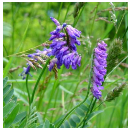
Obrázek 27: Vicia cracca

(McClintock & Fitter 1978; Deyl 2001; Kubát 2002; Fletcher 2004)