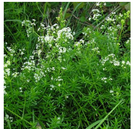
Obrázek 16: Galium mollugo

(McClintock & Fitter 1978; Deyl 2001; Kubát 2002; Fletcher 2004)