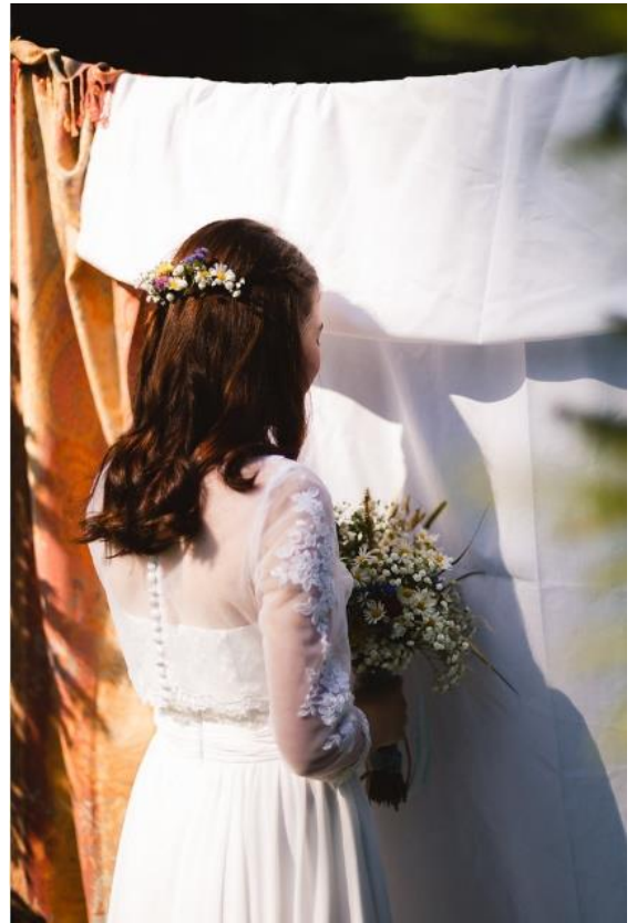
Obrázek 51: Kytice a přízdoba do vlasů