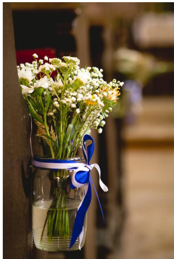
Obrázek 43: Květinové dekorace na lavice