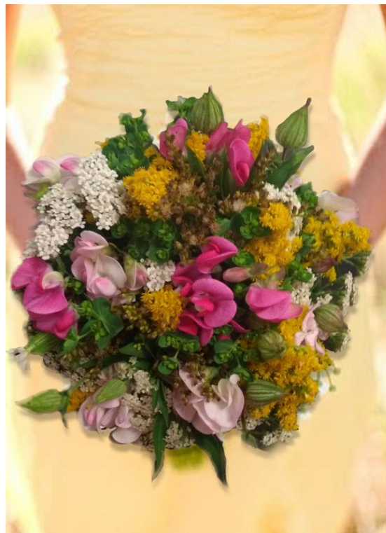
Obrázek 34: Kytice z planých květin