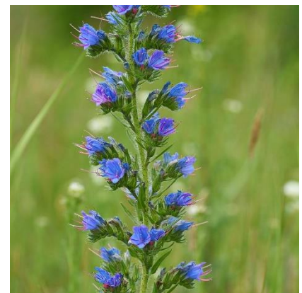
Obrázek 13: Echium vulgare

(Weissberger et al. 1965; McClintock & Fitter 1978; Rabšteinek & Poruba 1983; Deyl 2001; Kubát 2002; Fletcher 2004)