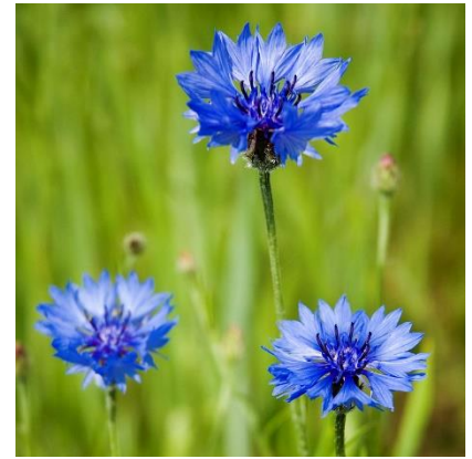
Obrázek 12: Centaurea cyanus

(McClintock & Fitter 1978; Deyl 2001; Kubát 2002; Fletcher 2004)