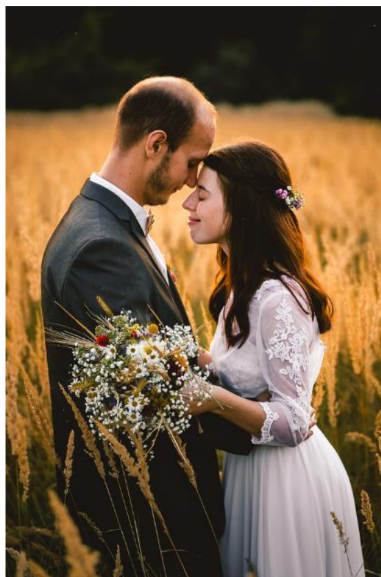
Obrázek 37: Kytice s heřmánkem a vratičem