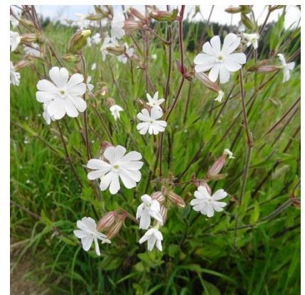
Obrázek 22: Melandrium album

(McClintock & Fitter 1978; Deyl 2001; Kubát 2002)