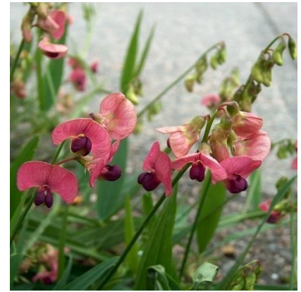
Obrázek 18: Lathyrus sylvestris

(Weissberger et al. 1965; McClintock & Fitter 1978; Rabšteinek & Poruba 1983; Deyl 2001; Kubát 2002; Fletcher 2004)