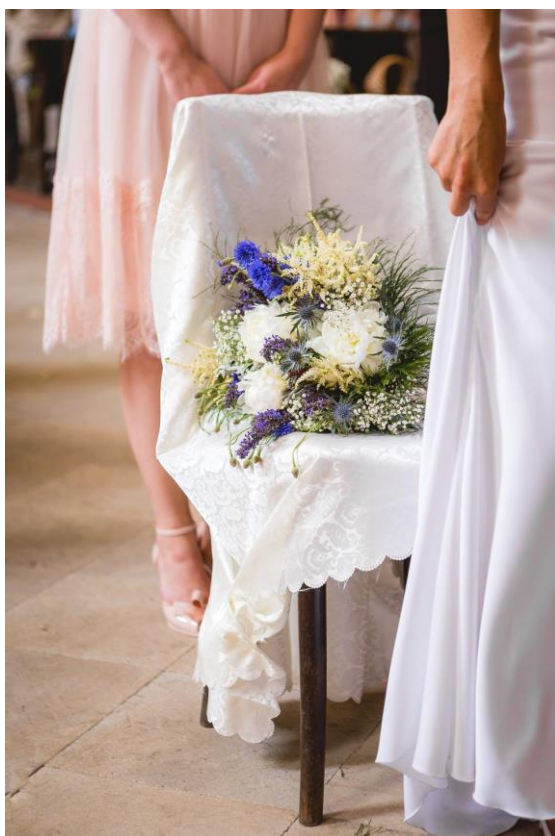
Obrázek 36: Kytice s chrpou a šalvějí

Druhou svatební kyticí, o poznání menší než ta předchozí, byla vazba s využitím lučních květů Matricaria recutita (heřmánek pravý) a Tanacetum vulgare (vratič obecný). Výběr rostlinných druhů a jejich kombinace podpořily luční charakter svatební kytice, což se velice hodilo k obřadu pod širým nebem, kde si snoubenci řekli své ano pod velkým platanem.