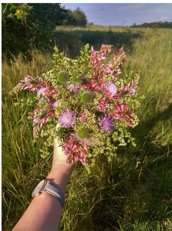
Obrázek 31: Kytice z planých květin

Poslední kytice, které byly vytvořené, byly pro družičky. Vazby byla převážně z planých květin a trav mezi které patří například rmen ( Anthemis arvensis ), kmín ( Carum carvi ), kopretina ( Leucanthemum vulgare ), heřmánek ( Matricaria recutita ), vratič ( Tanacetum vulgare ) nebo třtina ( Calamagrostis epigejos ).