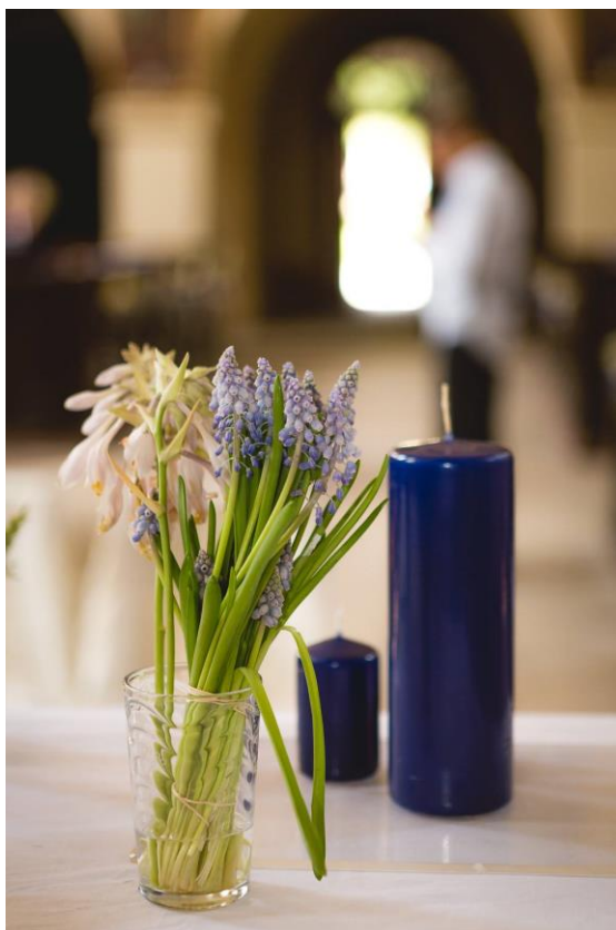
Obrázek 42: Volné aranžmá cibulovin

Dekorace pro červnovou svatbu byly vytvářeny do menšího vesnického kostela. Tento farní kostel v barokním stylu svou polohou i jednoduchostí korespondoval s využitím planých květin pro jeho výzdobu. Byly vytvořeny jednoduché vazby z květin jako dekorace pro lavice v kostele. Každá z nich měla nepatrně jiné složení květin, ale jednalo se zejména o plané druhy jako je kopretina bílá ( Leucanthemum vulgare ), řebříček obecný ( Achillea millefolium ), třtina křovištní ( Calamagrostis epigejos ), doplněné například o nevěstin závoj ( Gypsophila paniculata ).