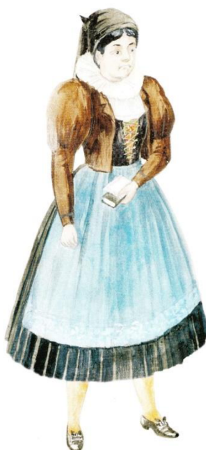
fotografie č. 8 - Dolnohřebečský kroj z Lanškrounska