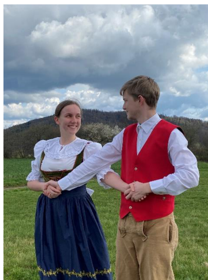
fotografie č. 18 - Postavení v Knödeldrähner

Na začátku se páry drží s překříženými rukama (viz fotografie č. 18). Začíná se dvanácti drobnými kroky, jakýmsi cupitáním, přičemž se vždy na první dobu taktu tento krok zdůrazní. Na konci čtvrtého taktu se páry rychle otočí a ve stejném držení couvají stále v tanečním směru čtyři takty. Následuje opět rychlá otočka, páry se točí na místě. Chlapec jde dopředu a dívka couvá. Takto se otočí jednou. Znovu se otočí a tentokrát couvá chlapec a dívka jde dopředu. Tato část trvá dohromady čtyři takty, tudíž na jednu otočku vychází dva takty. Poté si ruce uvolní, chytí se pouze za pravou ruku. Dívka se dvakrát podtočí, chlapec jednou a na konci dvakrát dupne. Tím tanec končí a opakuje se stále dokola. (Kuncová, 2023)