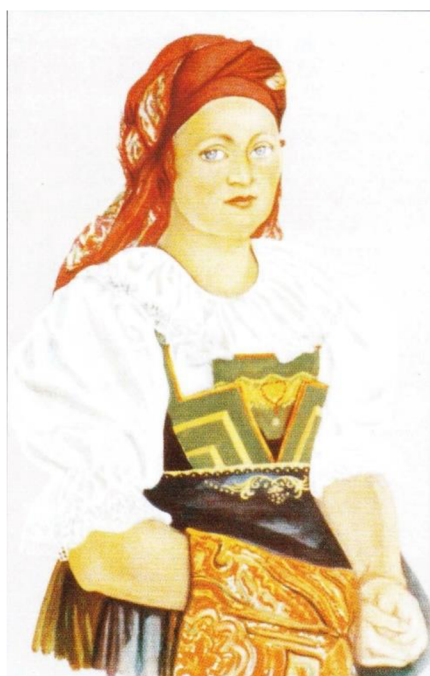
fotografie č. 7 - Dolnohřebečský kroj

Pánský кроj se již nedělí na hornohřebečský a dolnohřebečský, poněvadž v obou oblastech byl téměř totožný. Rozdíl spočíval zejména v oblečení na běžné a sváteční nošení. Ve všední dny byla základem bílá lněná košile a černé kožené kalhoty, které byly sešněrovány pod kolena. Jako boty se používaly vysoké černé holínky, které se kupovaly na jarmarku, a ne vždy dobře seděly. V zimě je však bylo možné vycpat slámou a tento nedostatek tím vyřešit. Ve sváteční dny se nosily kalhoty ušité ze světlého sukna nebo jelenice. Na nohy se navlékaly bílé nebo šedé podkolenky z vlny, upletené copánkovým vzorem. Boty byly pevné a nízké s ozdobnou sponou. Celý кроj doplňovala květinová kravata, vesta ušitá ze zelené nebo červené látky s mnoha stříbrnými či mosaznými knoflíky a kabát, který se na hornohřebečsku šil z hnědého sukna a na dolnohřebečsku ze zeleného sukna. Největší vzácností na celém kroji pak byl pásek s kovovou sponou, protože tento pásek byl velmi často vyšíván pavím brkem. Hřebečští muži nosili černý filcový klobouk se širokou krepou a dvouřadou černou stuhou, který je možné vidět na fotografii č. 8. (Borkovcová, Kuncová, str. 30, 2001)