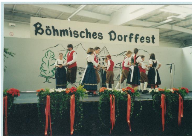
fotografie č. 6 - Sudetoněmecké dny

následovně: „ Vážená paní hlasatelka (nejspíše z přemíry dodržování pitného režimu) uváděla tance, které vůbec neznáme, natož abychom je uměli tancovat. “ Tanečníci se tímto omylem však nenechali vyvést z míry a zatancovali všechny obvyklé hřebečské tance, které uměli.