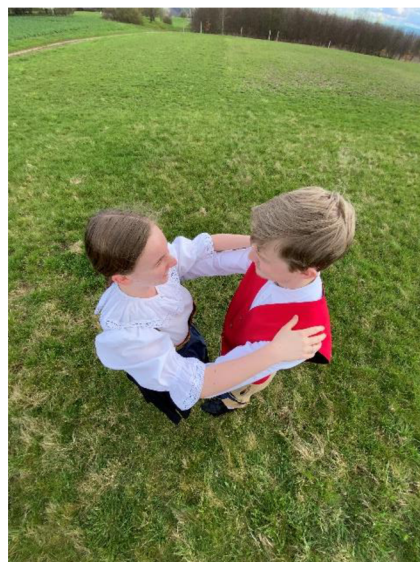
fotografie č. 16 - Soudek

Tanec je po celou dobu na tři doby a tancuje se v párech. Ty stojí v kruhu, vždy chlapec a dívka naproti sobě. Chlapec má ruce na ramenou dívky a dívka přibližně na lopatkách chlapce. Začíná se čtyřmi úkroky po směru tance, vždy na první dobu v taktu. Při těchto úkrocích se pohybuje ve stejném směru také horní část těla. Následují čtyři úkroky zpět. Dále se udělají ještě dva kroky tam a zpět. Na poslední dobu 12 taktu se přechází do valčíku. Pro lepší držení se ruce partnerů posunou níže a utvoří „soudek“ (viz fotografie č. 16). Toto je celý tanec a je možné jej tančit téměř neomezeně dlouhou dobu. (Schönhengster Volkstänze, nestránkováno, 1997 – pozn. překlad autora)