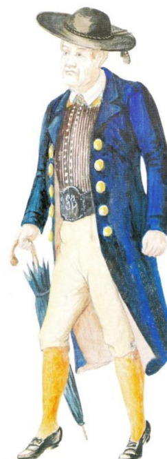
fotografie č. 9 - Mužský kroj z Lanškrounska