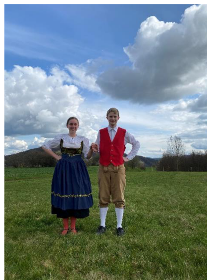
fotografie č. 10 - Základní postavení

Tanec se tančí v párech, které stojí do kruhu v tanečním směru (tj. proti směru hodinových ručiček), dívky stojí vně kruhu. Páry se drží za ruce (viz fotografie č. 10) a druhou ruku mají po celou dobu tance v bok. První část začíná pochodem ve dvoudobém metru (8 taktů) ihned s předehtou. Po osmi taktech se tempo zvolní, přejde do \frac{3}{4} taktu a tím začíná druhá část. Ruce se přechytí a 8 taktů se houpají dopředu a dozadu, přičemž při zpomalení a přechycení se ruce pomalu natahují dozadu a na první dobu \frac{3}{4} taktu vyrazí dopředu. Pár se při tom otáčí čelem k sobě, pokud jdou ruce dozadu, a zády k sobě, pokud jdou dopředu. Následuje podtáčení dívky před chlapcem. Dívka se vždy otočí o půlkruh, přičemž při prvním otočení zůstane zády k chlapci. Chlapec valčíkovým krokem přešlapuje za dívkou. Po osmi taktech se tanec opakuje od druhé části, nebo končí. (Borkovcová, Kuncová, str. 90, 2001)