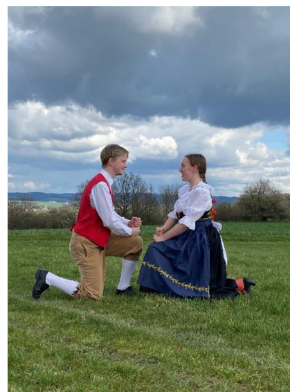
fotografie č. 15 - První figura v Ševcovském tanci

Schustertanz neboli Ševcovský tanec je hřebečský tanec, který se řadí taktéž mezi tance inspirované řemeslem. Skládá se ze dvou částí. V první se napodobují činnosti, které švec při výrobě dělá a ve druhé se tancuje polka. Malé děti se tuto choreografii snadněji učí právě díky připodobnění jednotlivých figur k ševcovským úkonům. (Kuncová, 2023)