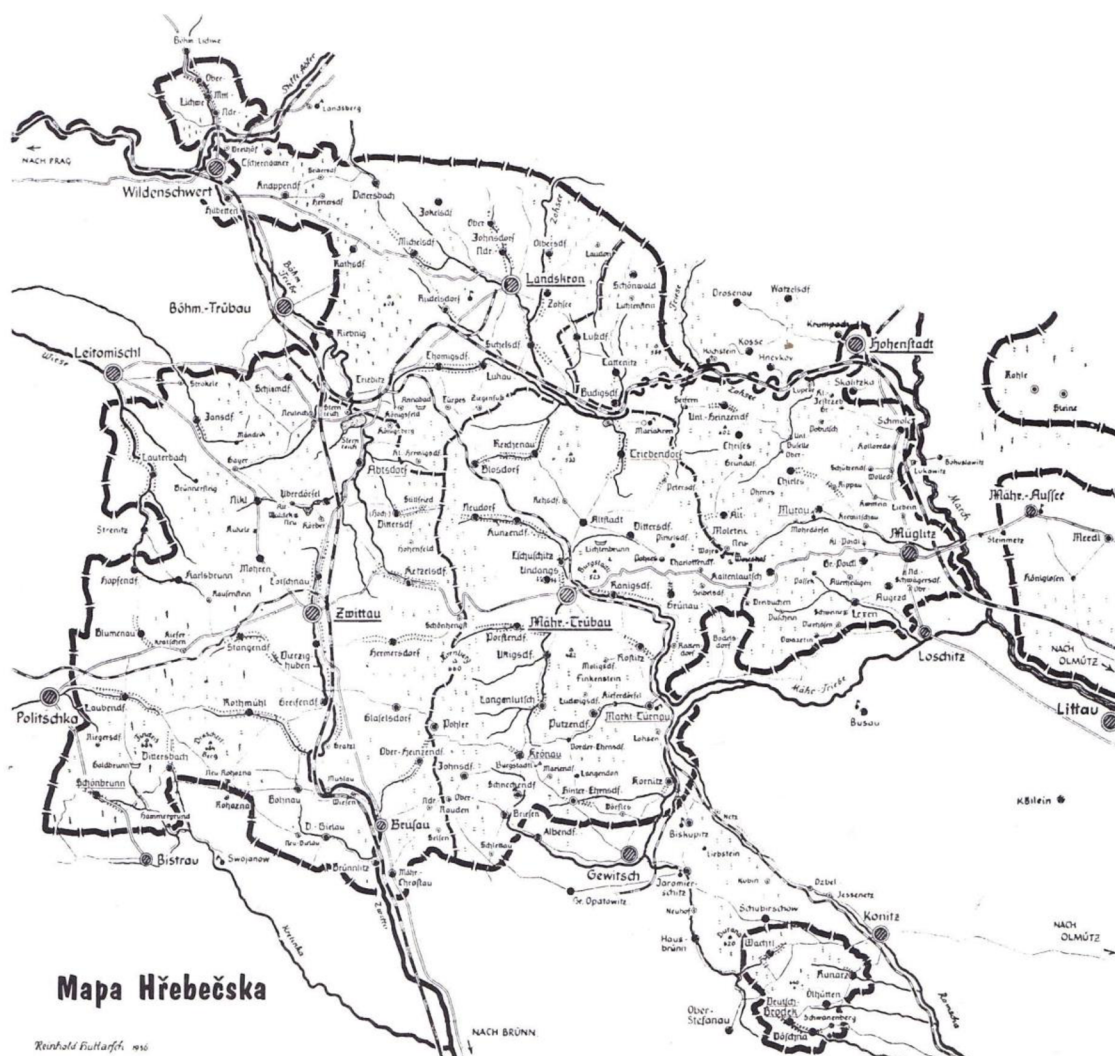
fotografie č. 1 - Mapa Hřebečska

Oblast Hřebečska byla osídlena již v pravěku, přesněji pak můžeme nalézt první pozůstatky osídlení již v době kamenné. V okolí Mohelnice žili lidé mohylové kultury, na což odkazuje samotný název města, ale zejména mohyly nalezené v okolí. Prokazatelný přísun německých obyvatel je od 13. století, kdy sem na pozvání olomouckého biskupa Bruna ze Schauenburgu přicházeli lidé z Bavorska, Frank a Švábska. Území o rozloze zhruba 1 230 km 2 obývali zejména lidé německé národnosti. Borkovcová a Kuncová ve své knize uvádějí, že počet obyvatel v roce 1939 činil zhruba 130 000, z čehož 126 000 bylo Němců. Tuto kontinuitu německé většiny narušil až odsun po skončení druhé světové války na základě Postupimské dohody. (Borkovcová, Kuncová, str 9, 2001).