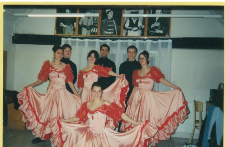
fotografie č. 4 - Šaty na předtančení

Rok 2002 zahájil soubor předtančeními na plesech v Boršově, Městečku Trnávce a maturitním plese v Moravské Třebové, kde předvedli dvě valčíkové sestavy na hudbu Johanna Strausse. Soubor tedy opět nevystupoval v hřebečských krojích, ale v šatech ušitých pro tuto příležitost (viz fotografie č. 3). Na velikonoční sobotu 30. března byl soubor pozván do Horní Radouně v jižních Čechách, aby vystoupil na velikonočním jarmarku. Dle zápisu z kroniky soubor u diváků vzbudil