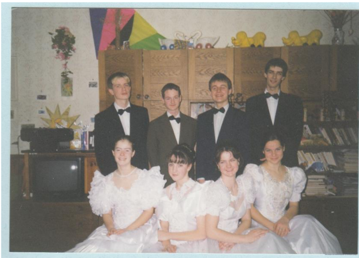
fotografie č. 3 - Šaty ušité k tanci Česká beseda

Dalším vystoupením byl masopust konaný v Moravské Třebové anebo akce nazvaná Praha srdce národů – mezinárodní folklorní festival národů a národnostních menšin. Nechyběly ani dvě akce konané opět v německých městech tentokrát Lehnitz a Landshut. Zdaleka největším a nejprestižnějším vystoupením však byla účast na