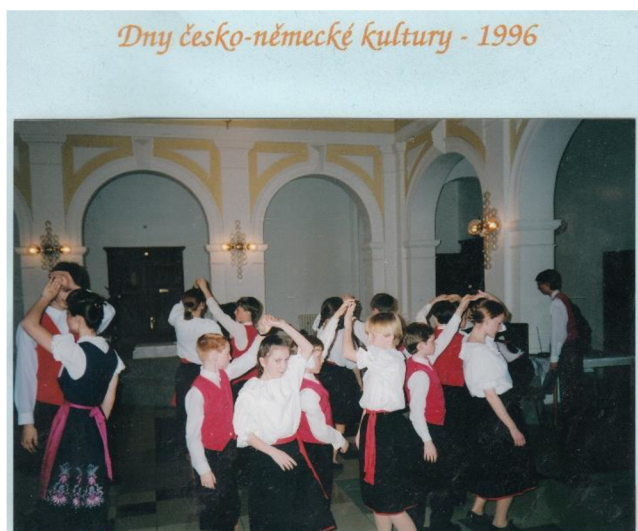
fotografie č. 2 - Vystoupení souboru na Dnech česko-německé kultury 1996

Zpočátku v souboru účinkovali tanečníci z řad německé menšiny. Díky této skutečnosti mohl být soubor podporován ministerstvem kultury jako soubor německé menšiny. Již za první rok existence zvládl soubor vystoupit na třech akcích, které se konaly v Moravské Třebové, a na jedné akci v Ostravě. Mezi vystoupeními v Moravské Třebové byly, Dny česko-německé kultury , jak dokazuje fotografie (viz fotografie č. 1). (Kronika souboru, nestránkováno)