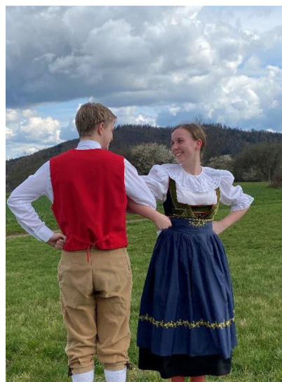
fotografie č. 11 - Zaháknutí rukou

Druhá část začíná ve volném držení chlapce a dívky (viz fotografie č. 10). Drobnými kroky na každou dobu se dva takty posouvají směrem dopředu a poté dva takty couvají zpět. S rukama v bok se od sebe oddělí a na těžkou dobu udělají chlapci dva úkroky směrem dovnitř a dívky směrem ven.