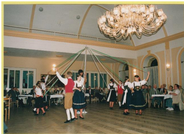
fotografie č. 5 - Pentlový tanec

Pentlový tanec, který se tančí okolo májky (viz fotografie č. 4). V září soubor opět přijal pozvání na pouť do Rychnova na Moravě. Tento rok tančili starší a mladší členové dohromady, a proto autor zápisu hodnotí vystoupení jako nepříliš povedené, což přičítá nesehranosti s mladšími členy souboru. Společnost česko-německého porozumění v listopadu