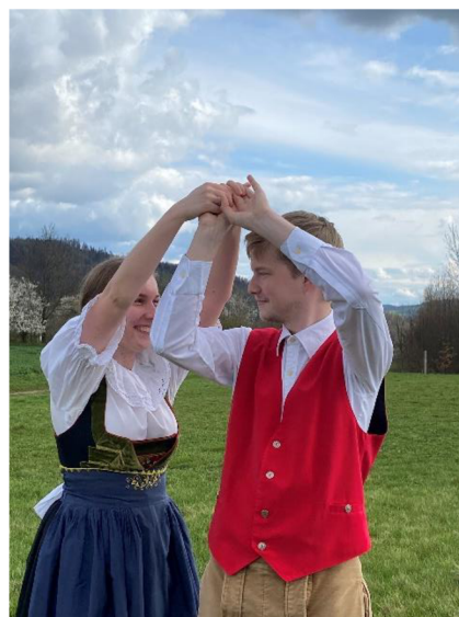
fotografie č. 14 - Zvednuté ruce

tanec je ve \frac{3}{4} taktu. Nejprve se zahrají dvě osminky jako předtaktí a tanečníci na první dobu vykročí směrem ven z kruhu. Valčíkovým krokem poté jdou dovnitř a ven čtyři takty. Skončí tedy vevnitř kruhu. Zde zvednou ruce nad hlavu (viz fotografie č. 14) a dívka chlapce obejde kolem dokola a znovu se postaví před něj. Chlapec mezitím přešlapuje na místě. (Schönhengster Volkstänze, nestránkováno, 1997 – pozn. překlad autora)