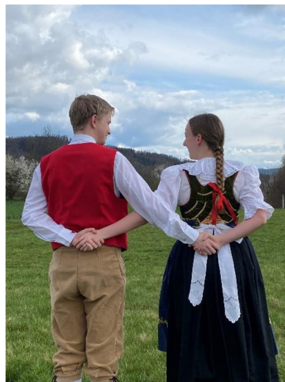
fotografie č. 12 - Propletené ruce

Ve třetí části se páry drží s rukama za zády, které jsou vzájemně propletené (viz fotografie č. 12). Podobně jako v druhé části jdou nejdříve dva takty dopředu a poté dva takty dozadu. Následuje figura, kdy chlapec vyšle dívku doprostřed kruhu a sám pokračuje setrvačností ven z kruhu. Oba se otočí okolo své osy a směřují zpět k sobě. Spolu se drží za obě ruce, jednou se zatočí a chlapec pokračuje dovnitř kruhu a dívka naopak ven. Otočí se a jdou zpět k sobě, znovu se zatočí a tímto tato figura končí.