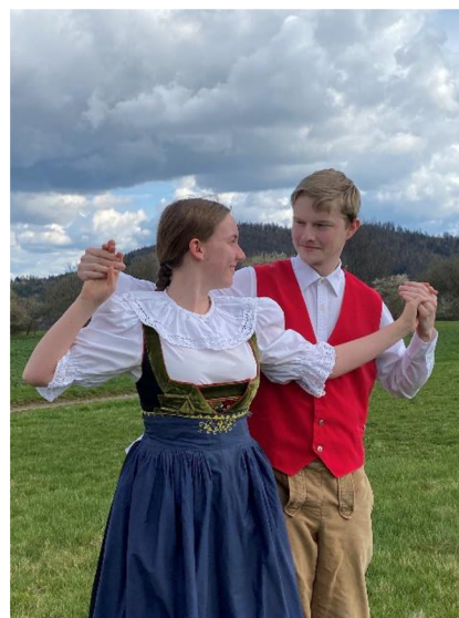
fotografie č. 13 - Figura v tanci Woaf

Tanec se tancuje v párech, které stojí po kruhu. Chlapec stojí za dívkou po jejím levém boku. Ruce mají zvednuté a pokrčené v lokti (viz fotografie č. 13). Celý