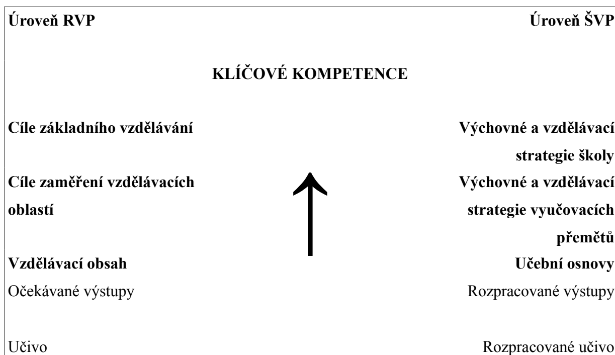
Schéma 2: Směřování k utváření a rozvíjení klíčových kompetencí žáků