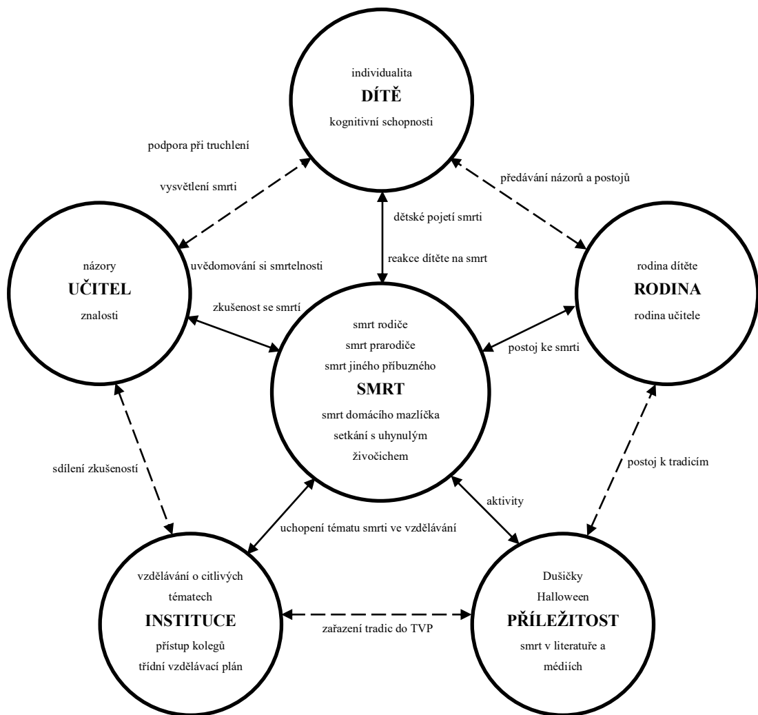
Schéma č. 2: Kategorie, subkategorie a jejich vzájemné vztahy

mezi jednotlivými kategoriemi. Stejně tak obsahuje výčet subkategorií, které tvoří buď obecné kategorie či vzájemné interakce. Tento ucelený model výsledné teorie tak poskytuje určitý vhled do komunikace o smrti s dětmi v prostředí mateřské školy. V podkapitolách, které následují, se věnují bližšímu popisu a vysvětlení jednotlivých subkategorií, kategorií a jejich vzájemných interakcí. Z důvodu dodržení etických pravidel výzkumu budou jednotliví participanti nazýváni čísly 1 až 8, tedy tak, jak jsou označeni v Tabulce č. 1.