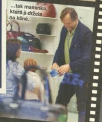
...tak maminko, která ji držela na klíně.