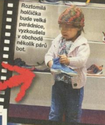
Roztomilá holčička bude velká parádnice, vyzkouší se v obchodě několik párů bot.