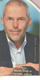
Marek Eben je nejraději, pokud

Moderátor Marek Eben (57) prozradil, že mu vadí, když si hosté jeho pořadí. Na plovárně vodí na natáčení své manželky. Podle něj to máni atmosféru ve studiu a mnohdy se kvůli tomu nedokážou ani jeden uvolnit. Nestává se často, že by byl Marek Eben natolik otevřený, aby dokázal veřejně říct, co se mu nelíbí. Zvoněný moderátor si nepřijímá své věci taktně nechává pro sebe, přesto tenkrát udělal výjimek. Řekl, co by změnil, kdyby to bylo v jeho moci. «Nejsem rád, když přijde host na Plovárnu a manželka s ním s úsměvem na rtech. Už jsme měli hosta, který vždycky řekl nějakou odpověď a pak se pochlubil, co ona tomu říká. A ona seděla a hleděla. Zánou manželku jsme ale ještě nevykázali, protože to jsou natolik vážné osobnosti, že bychom si to nedovolili. Pravdou ovšem je, že některé manželky jsou za kamerou opravdu obtížná.» řekl.