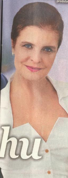
Charismatické herece Karla Rodena a Janu Krausovou spojuje jedenadvacetiletá láska a fakt, že si život bez toho druhého neumí představit.