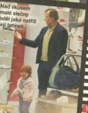
Nad vkusem malé slečny běžel jako ošarž její tatínek.