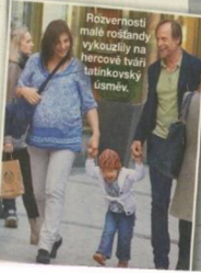
Roztomilá holčička bude velká parádnice, vyzkouší se v obchodě několik párů bot.