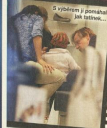
S výběrem ji pomáhal jak tatínek...