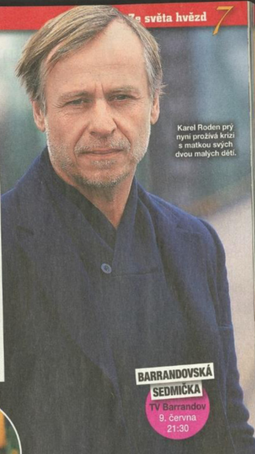
Karel Roden prý nyní prožívá krizi s matkou svých dvou malých dětí.

BARRANDOVSKÁ SEDMICKA TV Barrandov 9. června 21:30