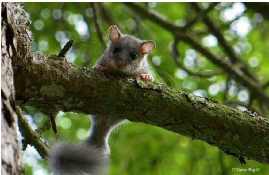
Obrázek 3: Plch velký

Plší budky jsou vhodné pro různé druhy plchů, v České republice jsou nejvíce obsazeny plchem velkým (Obr. 3). Nejčastěji se objevují dřevěné budky a méně dřevocementové budky (Obr. 4). Konkrétní typy plších budek zde zatím nejsou moc rozšířeny, a tak jsou plši k vidění zejména v dřevěných ptačích budkách. Někdy mohou budky určené pro plchy obsadit také ptáci, proto se může vstup u těchto budek nacházet ze zadní části u kmene stromu (s průměrem vstupu 4 až 4,5 cm) (NHBS Practical Conservation Equipment, 2019). Tento zadní vstup ztěžuje přístup jiných druhů, a tím jsou plši chráněni před potenciálními predátory a konkurenty. Ideální výška pro instalaci budek je 1,5 až 3 m na kmeni o průměru aspoň 20 až 30 cm (Zelená domácnost, 2016).