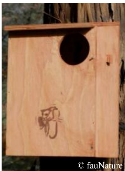
Obrázek 11: Dřevěná budka pro kusu liščí

Kusu liščí potřebuje mít denně k dispozici dutinu nebo budku k úkrytu (Obr. 11), je tedy obligátním dutinovým uživatelem (Easy pest supplies, 2011). Tento druh se řadí mezi větší stromové vačnatce, žijící samotářsky, který se může schovávat i v lidských obydlích a ve střechách (La Trobe University, 2023). Preferuje zejména větší přední vstup o průměru asi 10 cm s 4 až 5 m nad zemí (Nest boxes Australia, 2006). Pro snadnější vstup do budky mu mohou sloužit vnitřní i vnější paralelní drážky (Obr. 12) (McGlashan – Nest box Tales, 2021).