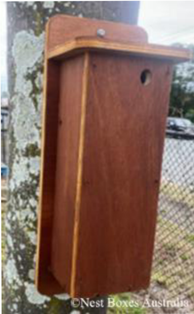
Obrázek 17: Dřevěná budka pro vakoplcha drobného

Využívá vysoké vertikální budky s 2.5 až 3 cm vstupním průměrem (Obr. 17), které mohou i nemusí obsahovat paralelní drážky, usnadňující přichycení (Nest boxes Australia, 2006).