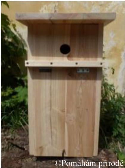
Obrázek 18: Dřevěná budka bez nátěru