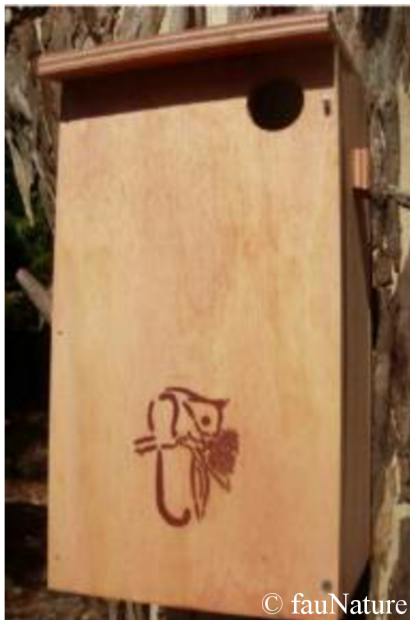
Obrázek 14: Dřevěná hlubší budka pro vakoveverku létavou a větší

Vakoveverka létavá a vakoveverka větší ( Petaurus norfolcensis ), vyskytující se v jihovýchodní Austrálii, mohou hnízdit ve skupinkách až 10 jedinců (Easy pest supplies, 2011). Preferují hlubší budky (Obr. 14) s menším průměrem předního vchodu, asi 4 až 5 cm, kvůli vyloučení predace většími druhy (McGlashan – Nest box Tales, 2021). Budky by měly být instalovány ve výšce alespoň 4 m nad zemí (Nest boxes Australia, 2006). Budky pro vakoveverku žlutobřichou ( Petaurus australis ) jsou navrženy většinou se zadním vstupem (Obr. 15) o průměru asi 8 cm (Nest boxes Australia, 2006).