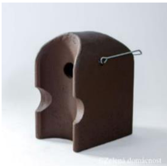
Obrázek 19: Dřevocementová budka