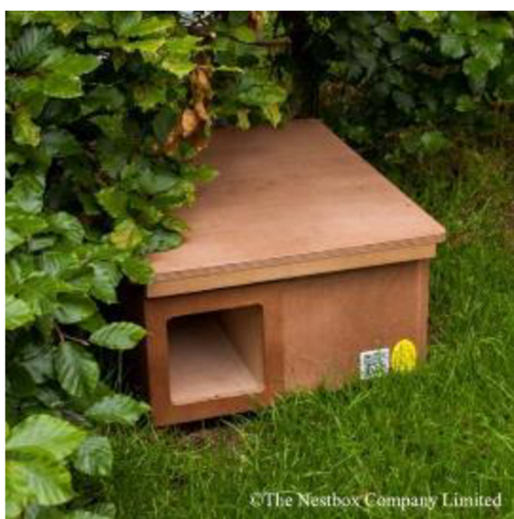
Obrázek 8: Dřevěná budka pro ježky

Pro ježky jsou hnízdní budky vhodné zejména na hnízdění, vyvedení a chov mláďat a hibernaci (Gazzard & Baker, 2022). Mohou být vyrobené ze dřeva (Obr. 8), nebo z odolnějšího plastu (Obr. 9). Budky jsou umístěné na zemi, nejlépe v klidném místě na okraji zahrady (The Nestbox Company Limited, 2015). Ovšem takto dostupné budky mohou být rizikovější k vyrušení predátory, např. liškou obecnou ( Vulpes vulpes ) nebo lidskou činností (Gazzard & Baker, 2022).