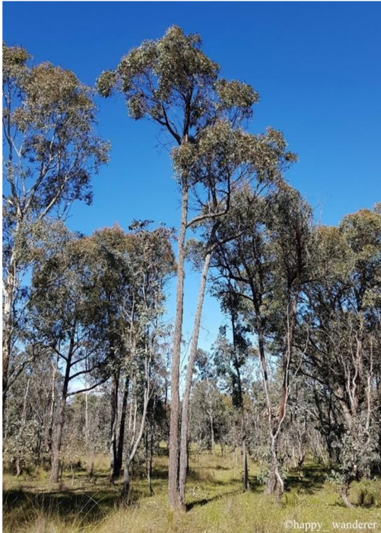
Obrázek 21: Strom Eucalyptus macrorhyncha