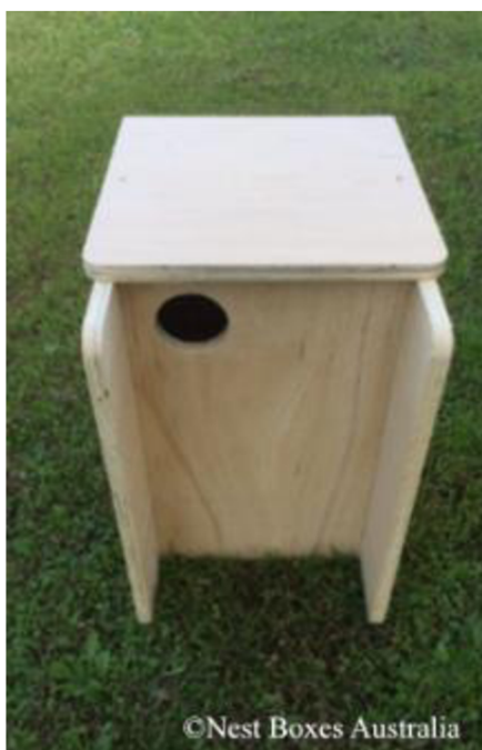
Obrázek 15: Dřevěná budka pro vakoveverku žlutobřichou se zadním vchodem