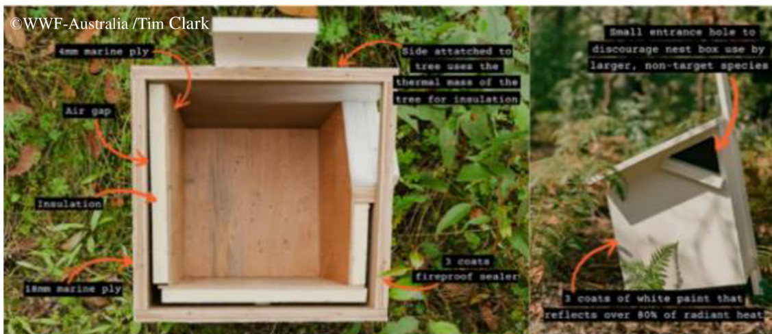
Obrázek 16: Speciální budka pro vakovce létavého

Hnízdí v páru a je největším australským plachtivým savcem, dokáže doletět do vzdálenosti až 100 m (Atlas zvířat, 2019). Tento stromový vačnatec se vyskytuje na východě Austrálie, je zde pokládán za zranitelný druh, který čelí vysokému riziku vyhynutí ve volné přírodě (Burbidge A. & Woinarski J., IUCN, 2020). Navíc díky rozsáhlým požárům v letech 2019 až 2020, shořela skoro třetina jeho přirozeného prostředí, proto byly pro tento druh vytvořeny speciální dřevěné budky (Obr. 16) s bočním trojúhelníkovým vchodem a se schopností udržovat přijatelné tepelné podmínky (WWF Australia, 2022). Umístění budek by se mělo pohybovat od 15 do 30 m nad zemí směrem na jihovýchodní stranu (McGlashan – Nest box Tales, 2021).