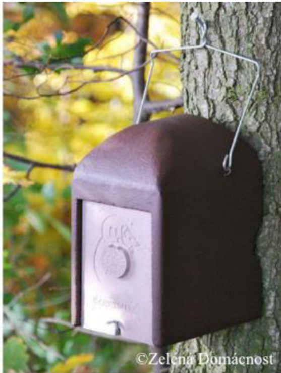
Obrázek 4: Dřevocementová budka pro plchy