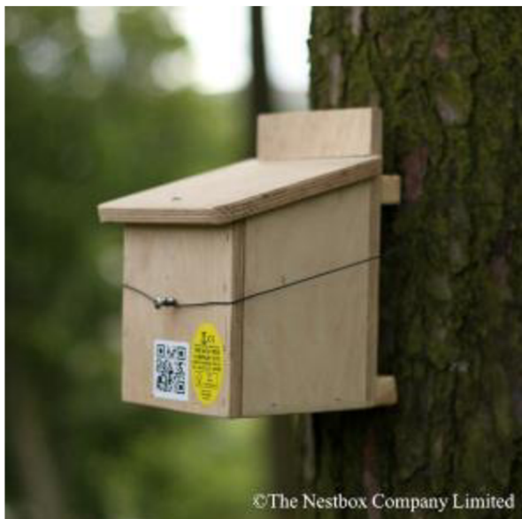
Obrázek 5: Dřevěná budka pro plšičky