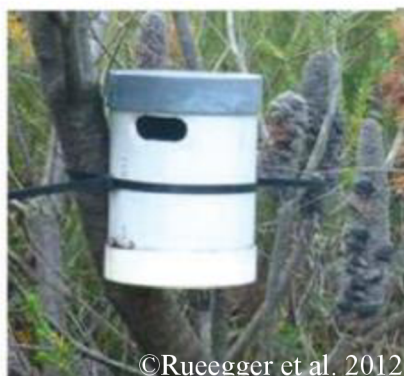
Obrázek 20: Plastová vertikální budka

Kvůli těmto nevýhodám často plastové budky nejsou vybrány pro stavbu hnízdních budek, ačkoli některé studie zkoumaly, zda stromoví savci preferují určité designy a materiály budek. Jednou takovou studií byl výzkum Rueeggera et al. (2012), zahrnul do výzkumu také plastové budky (Obr. 20) a zjistil, že plastová budka byla nejméně používána vakoplchem drobným na rozdíl od dřevěné a dřevocementové hnízdní budky.