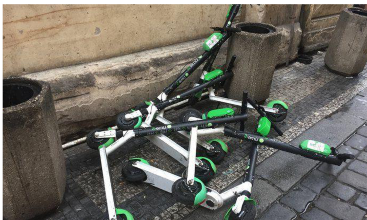
Obrázek 3 Poškozené Lime koloběžky (Liebreich, 2020)

Alternativu k hodnoceným dopravním prostředkům v této kategorii představují Rekola, fungující v ulicích Prahy již od roku 2014 a Nextbike, který v Praze působí od roku 2020. Obě společnosti nabízí jízdní kola bez asistence elektromotoru, alespoň tedy na hodnoceném území. Důvodem, proč nebyly tyto varianty zahrnuty do výběru kompromisní varianty je hned několik. Prvním z nich je právě zmiňovaná absence elektromotoru, díky které je přeprava značně fyzicky náročná. Obě zmíněné alternativy také využívají jiný způsob monetizace svých služeb. Nedochozí k platbě za minutu jízdy, ale jízdní kolo se vždy vypůjčuje na intervaly 30 minut, takže i při vypůjčení například po dobu 35 minut je nutné zaplatit 60 korun. Následně shodně poskytují provázání s MHD, kde lze v případě platného kupónu čerpat 2x 15 minut denně zdarma či například s kartou MultiSport, která v obou případech zajistí 2x denně až 60 minut zdarma.