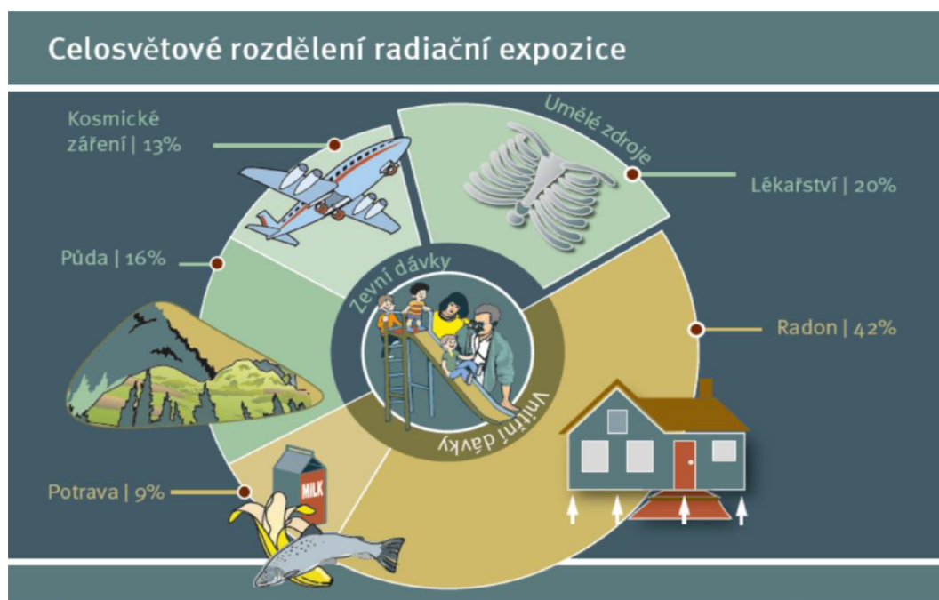
Obr. č. 1: Celosvětové rozdělení radiační expozice (21)

Současná legislativa (zákon č. 263/2016 Sb., Atomový zákon) zahrnuje do lékařského ozáření také ozáření osob, které poskytují pomoc fyzické osobě podstupující lékařské ozáření, dále ozáření osob, které se dobrovolně účastní lékařského ověřování nezavedené metody spojené s lékařským ozářením a ozáření v rámci pracovnělékařských služeb a preventivní zdravotní péče. (23) LO považujeme za potřebnou součást diagnostických vyšetření, jenž způsobuje vysokou radiační zátěž. Ke snížení této zátěže je potřeba znát principy, způsoby a další pojmy radiační ochrany.