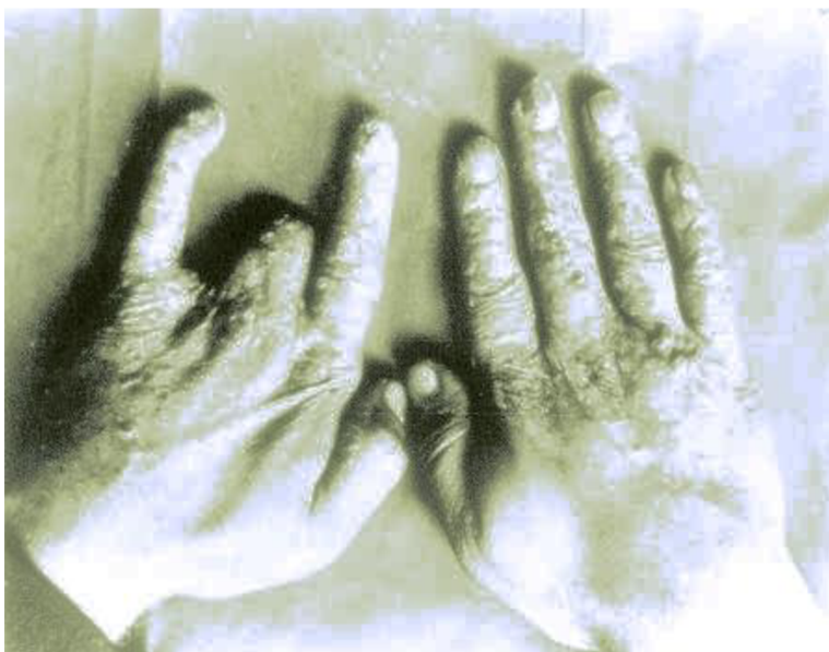
Obr. č. 2: Radiační nekróza prstů ruky

Obrázek byl převzat z internetové stránky. (26)