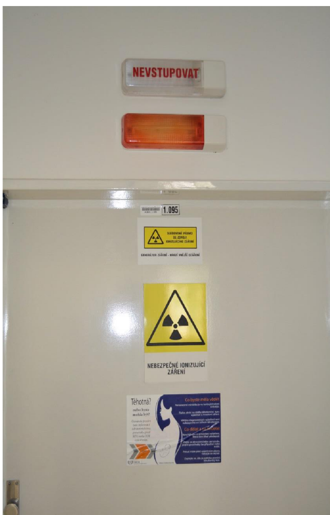
Obr. č. 3: Vstupní dveře na RTG vyšetřovnu

Spadá sem i fyzické zabezpečení ZIZ, aby nebyly neoprávněně použity. Pojízdne RTG přístroje nenechávat volně na chodbě. U každého RTG přístroje by mělo být spuštění expozice možné jen po přihlášení oprávněným pracovníkům. Zabezpečují se i stavebně, a to zamezením vstupu nepovolaných osob. Zamezení vstupu může vypadat následovně (viz. obr. č. 3).