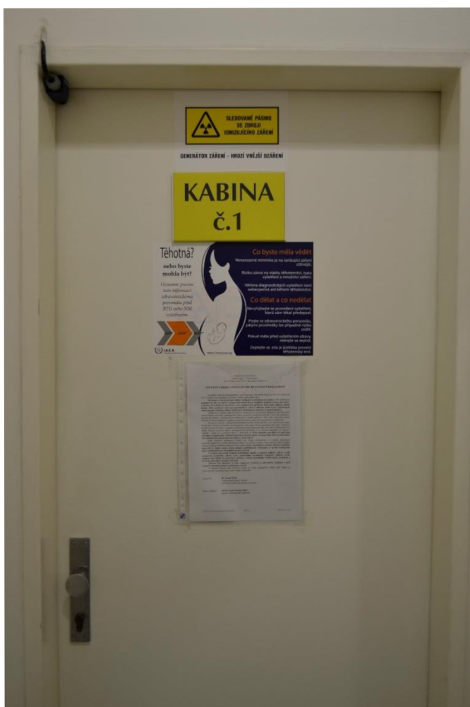
Obr. č. 4: Dveře kabin sloužící pro pacienty

Na snížení rizika vzniku účinků IZ a snížení radiační zátěže se mimo jiné podílejí i způsoby radiační ochrany.