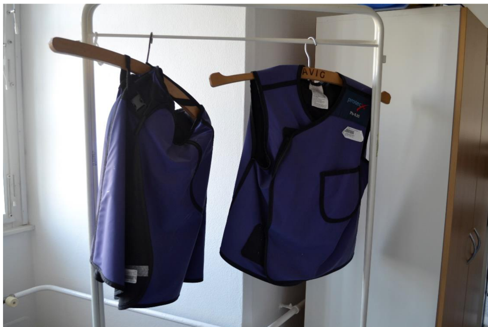
Obr. č. 7: Ochranné prostředky pro radiální pracovníky

Dříve se nejčastěji využívalo k tvorbě ochranných prostředků olovo (Pb). Avšak ochranná zástěra s Pb je velice těžká a už se v současné době nepoužívá. Nyní se nejčastěji jedná o směs Pb s jiným, lehčím prvkem, jako je například cín, guma, PVC a další. To se týká stínění obsahující Pb. Jsou i stínění neobsahující olovo, anglicky „non-lead“ nebo „lead free“. Tato stínění nabízejí stejný ochranný faktor jako stínění obsahující Pb. Olovo je však nahrazeno jiným materiálem, a to cínem, antimonem, wolframem, bismutem a dalšími. (25)