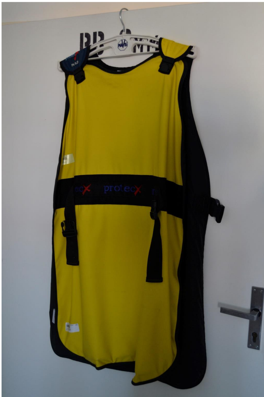
Obr. č. 8: Ochranná zástěra

Materiál ochranných stínění, tudíž i ochranné zástěry, zeslabuje záření a zároveň musí být rovnoměrně rozložen a musí obsahovat prvky o atomovém čísle větším než 47. Ochranné zástěry jsou vyráběny se stínícím ekvivalentem 0,25 mm Pb, 0,35 mm Pb, 0,50 mm Pb a 1,00 mm Pb (viz. obr. č.8 a č.9). (12)