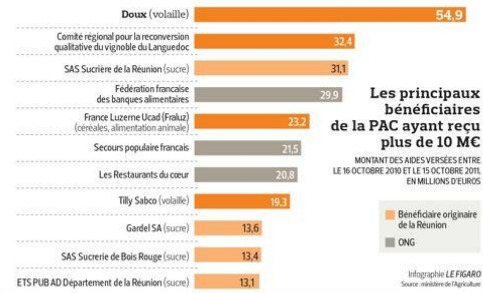
Graf č. 2 Největší příjemci dotací SZP v období říjen 2010 – říjen 2011 52