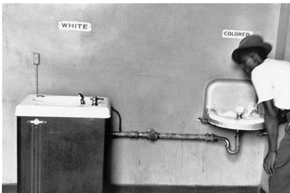
obrázek č. 13