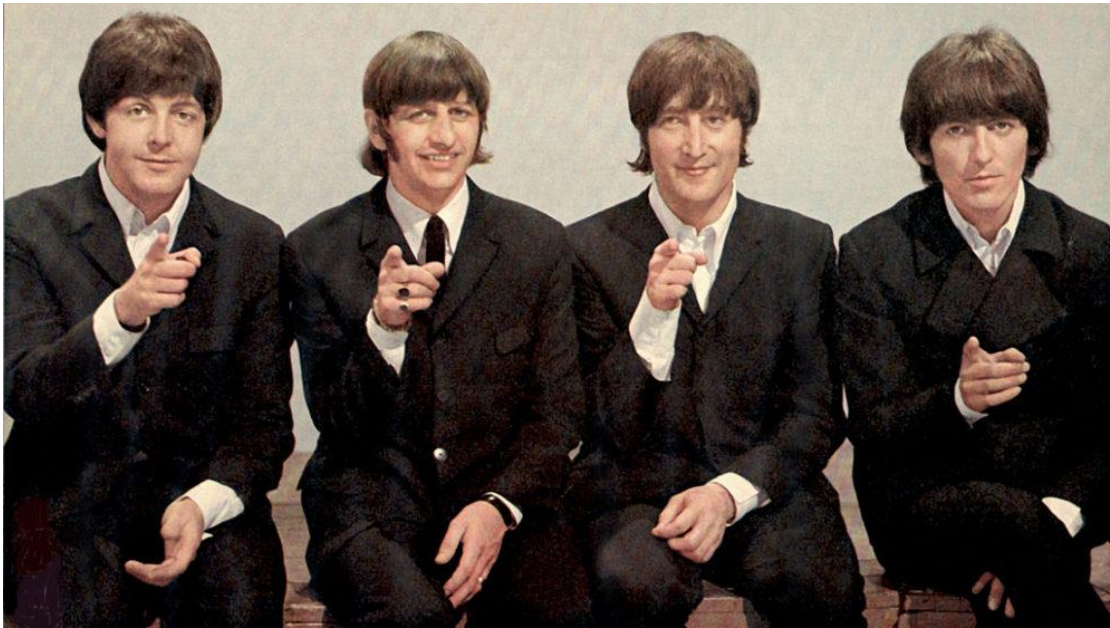
obrázek č. 11