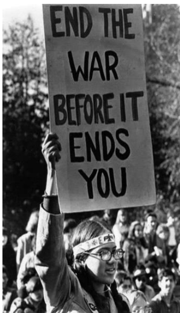
obrázek č. 4