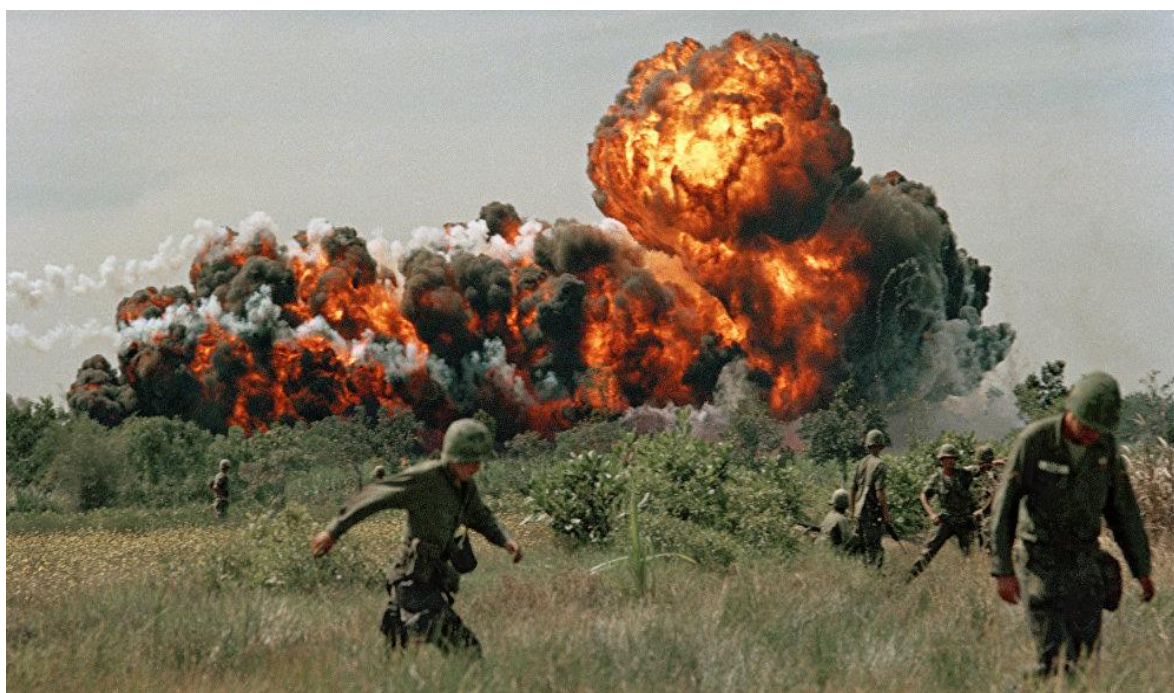
obrázek č. 7

Autorem materiálu a všech jeho částí, není-li uvedeno jinak, je (jméno a příjmení autora). Dostupné z Metodického portálu www.rvp.cz , ISSN: 1802-4785. Provozuje Národní ústav pro vzdělávání, školské poradenské zařízení a zařízení pro další vzdělávání pedagogických pracovníků (NÚV).