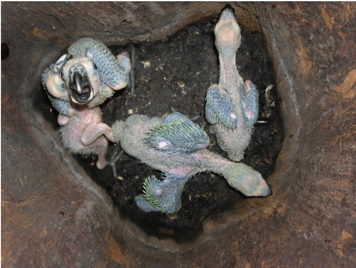
Obr.1: Snůška amazoňanů modročelých ( Amazona aestiva ), ilustrující asynchronní líhnutí typické pro papoušky.

U některých druhů, jako jsou rosely a andulky, je asynchronie líhnutí snížena oproti tomu, co by se dalo očekávat vzhledem k datu snůšky, tím, že samice odkládají začátek inkubace, dokud není snesena většina vajec. U jiných samic je asynchronnost líhnutí podporována tím, že samice začínají s inkubací brzy po snesení prvního vejce a že snášejí vejce v dostatečném časovém odstupu. Je však důležité poznamenat, že ačkoli asynchronní líhnutí poskytuje snadnou cestu k redukci snůšky tím, že produkuje mláďata různého věku, je důležité u každého druhu zjistit, do jaké míry je redukce snůšky versus jiné faktory zodpovědné za pozorované ztráty mláďat. Tento důkaz by zahrnoval vyšší mortalitu později vylíhnutých mláďat ve srovnání s jejich staršími sourozenci jako přímý důsledek rozhodnutí rodičů o přidělení zdrojů každému z mláďat ve snůšce. Mláďata papoušků rostou exponenciálně, dokud nedosáhnou maximální hmotnosti, a pak před vylétnutím část této hmotnosti ztratí, což je jev známý jako úbytek hmotnosti. I v příznivém roce závisel průběh růstu mláďat a datum vylétnutí také na pořadí líhnutí mláďete (Masello & Quillfeldt 2002, 2003).