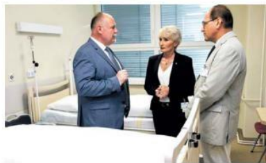
Už loni se za přispění Olomouckého kraje otevřelo v prostějovské nemocnici nové oddělení. Zdravotníci se tam starají o nevyléčitelně nemocné a umírající.

Pro Olomoucký kraj, který spolu s Hospicovou péčí Caritas odbornou konferenci organizoval, je téma paliativní péče jednou z dlouhodobých priorit. Na jejím systematickém zlepšování začalo hejtmanství pracovat jako jedno z prvních v Česku. Letos