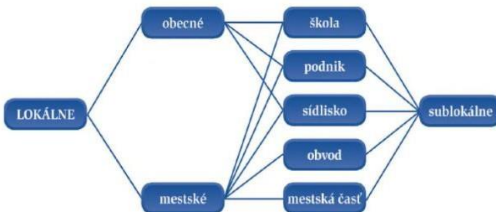
2.2 Schéma lokálních periodik podle Tušera

Vzhledem k tomu, že v lokalitách vydávají svoje prostředky masové komunikace i sublokální subjekty, např. školy, podniky, sídliště, obvody, městské části, mluví i o sublokálních periodikách – školních, podnikových (firemních), sídlištních, obvodních či městských částí.