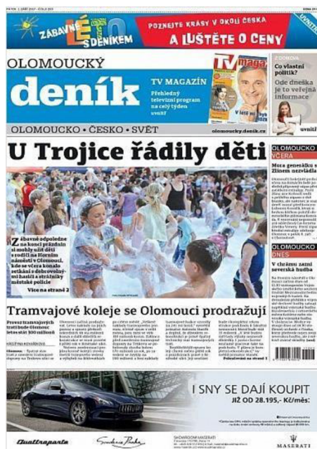
2.5 Titulní strana Olomouckého deníku, září 2017 – komerční médium