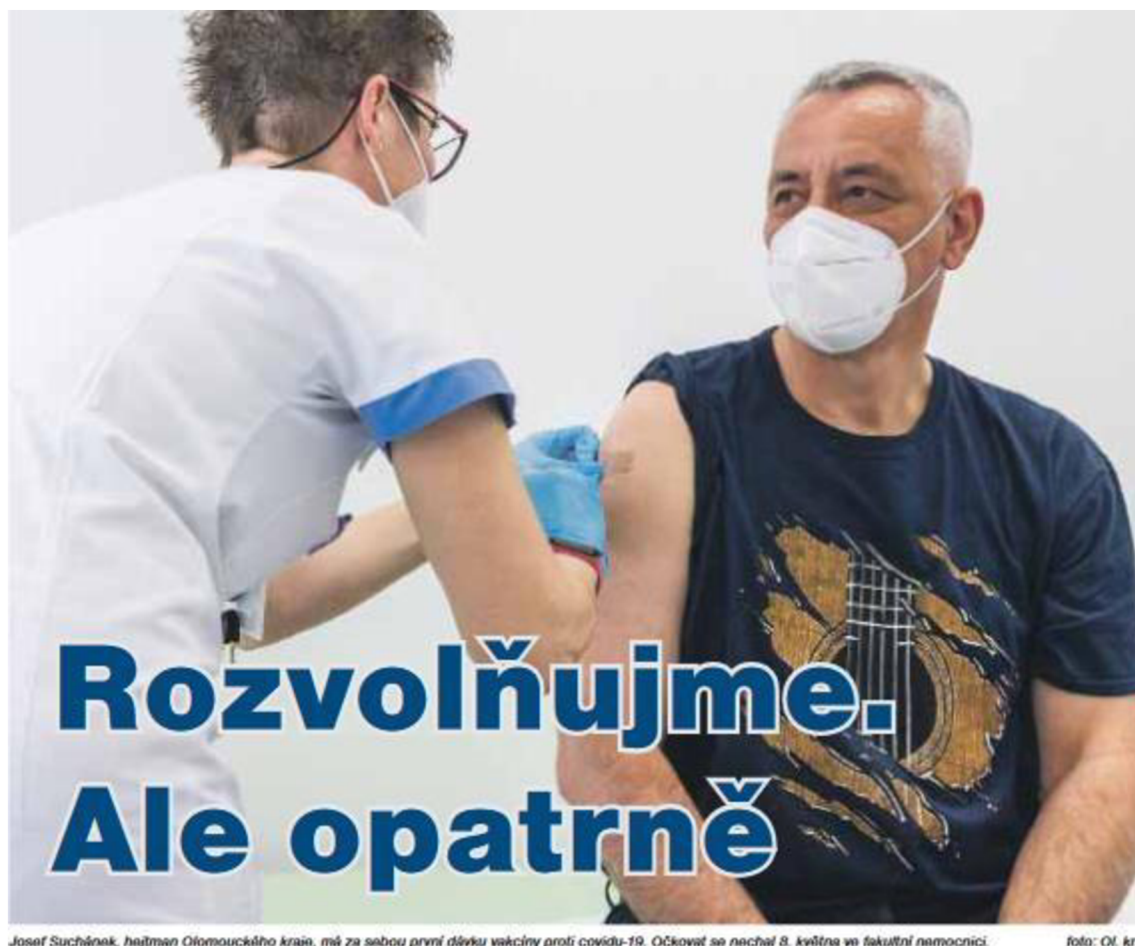
Josef Suchánek, hejtman Olomouckého kraje, má za sebou první dávku vakcíny proti covidu-19. Očkovat se nechal 8. května ve fakultní nemocnici.

Josef Suchánek). Jediná odchylka se nachází v červnu 2021, kdy aktuální hejtman zabírá plochu 12,1 %. Tato odchylka je způsobena titulní stranou měsíčníku, kde jsou však jediné dva výskyty hejtmana z celého čísla. Na titulní straně se nachází velká fotografie, která propaguje očkování proti covid-19, viz Obr. 8.