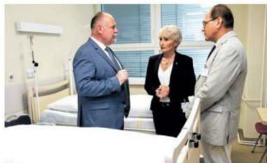
Už loni se za přispění Olomouckého kraje otevřelo v prostějovské nemocnici nové oddělení. Zdravotníci se tam starají o nevléčitelně nemocné a umírající.

Pro Olomoucký kraj, který spolu s Hospicovou péčí Caritas odbornou konferenci organizoval, je téma paliativní péče jednou z dlouhodobých priorit. Na jejím systematickém zlepšování začalo hejtmanství pracovat jako jedno z prvních v Česku. Letos