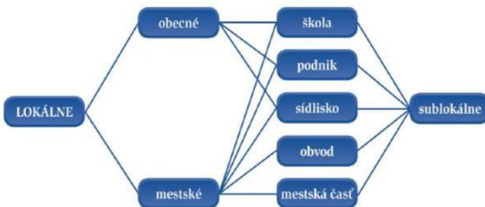
2.2 Schéma lokálních periodik podle Tušera

Vzhledem k tomu, že v lokalitách vydávají svoje prostředky masové komunikace i sublokální subjekty, např. školy, podniky, sídliště, obvody, městské části, mluví i o sublokálních periodikách – školních, podnikových (firemních), sídlištních, obvodních či městských částí.