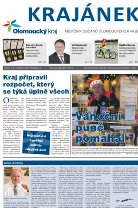
2.4 Titulní strana Olomouckého kraje, prosinec 2019 – vydáván krajem

Čtenář má možnost si vybrat z více komerčních regionálních titulů, tato možnost u regionálního tisku vydávaného samosprávou není.