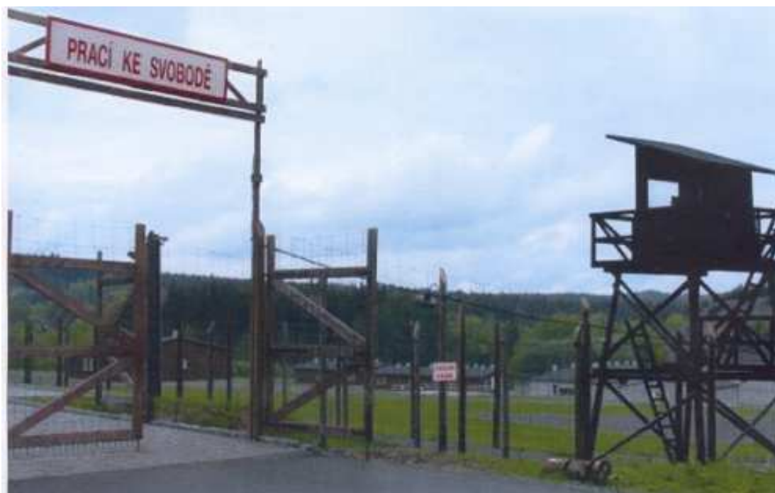
Obrázek č. 3 – Komunistický koncentrační tábor, Jáchymov