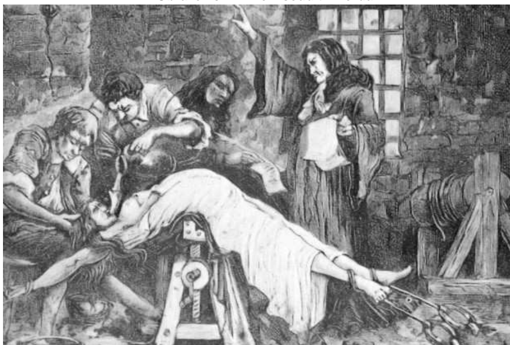
Obrázek č. 1 – Boží soud tzv. ordál