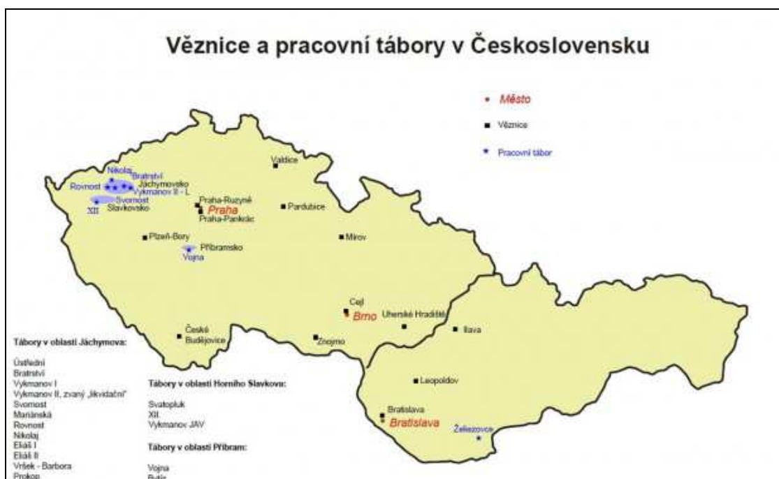
Obrázek č. 2 – Věznice a pracovní tábory v Československu