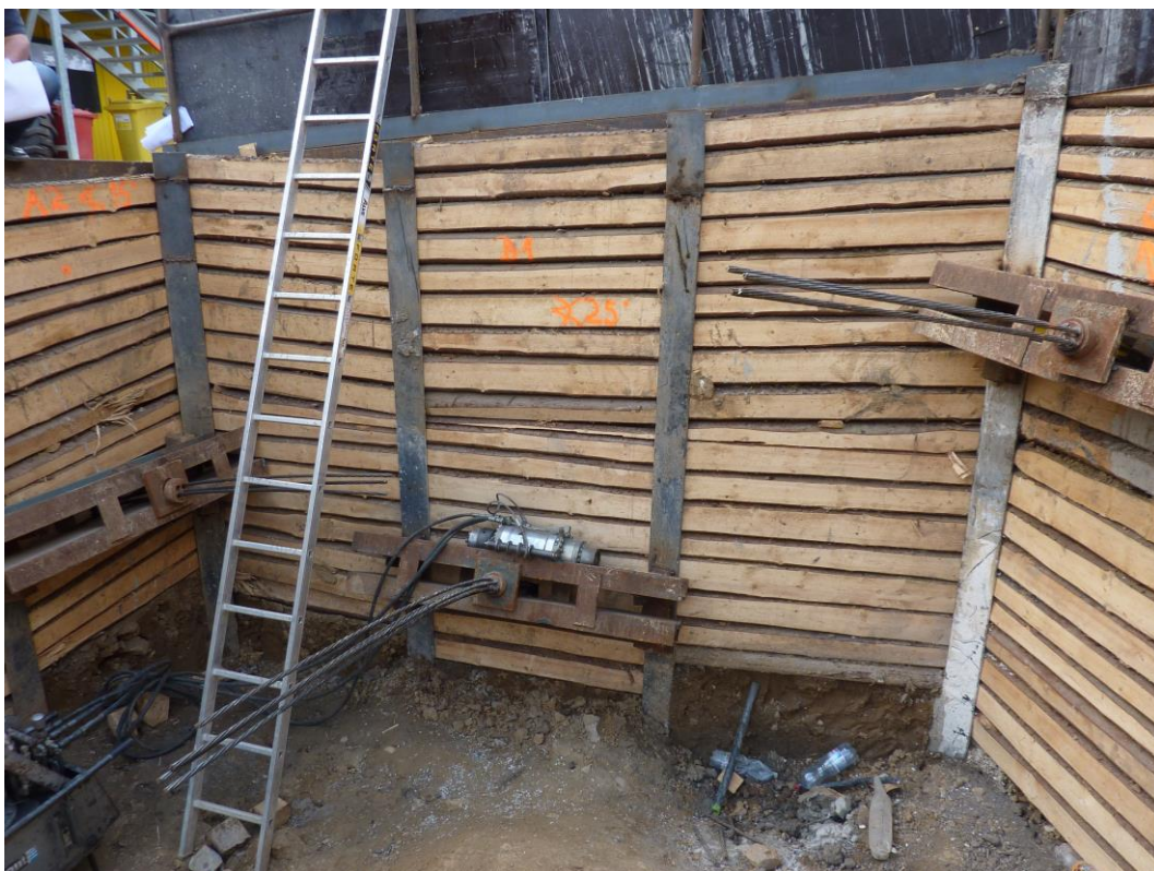
Fotografie č. 3 – Pažení hloubené jámy vstupní šachty