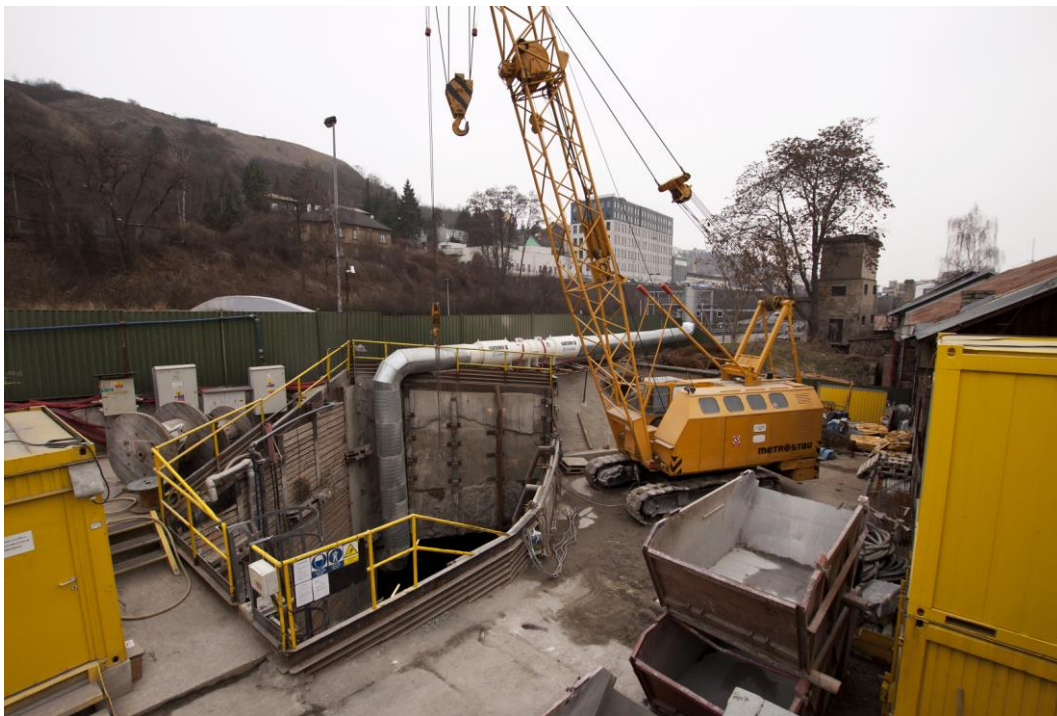
Fotografie č. 5 – Celkový pohled na hloubenou jámu vstupní šachty