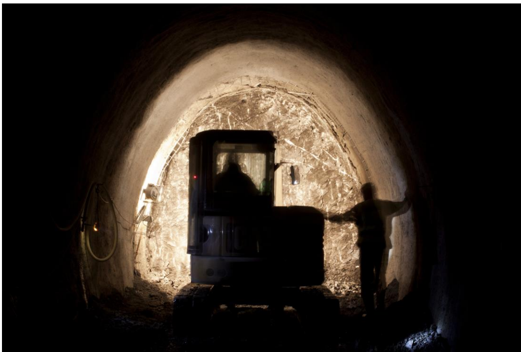
Fotografie č. 14 – Pohled na čelbu ražené části štoly (se stíny pracovníků a stroje)