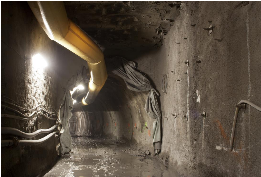
Fotografie č. 9 – Pohled na přechod hloubené části štoly do části ražené