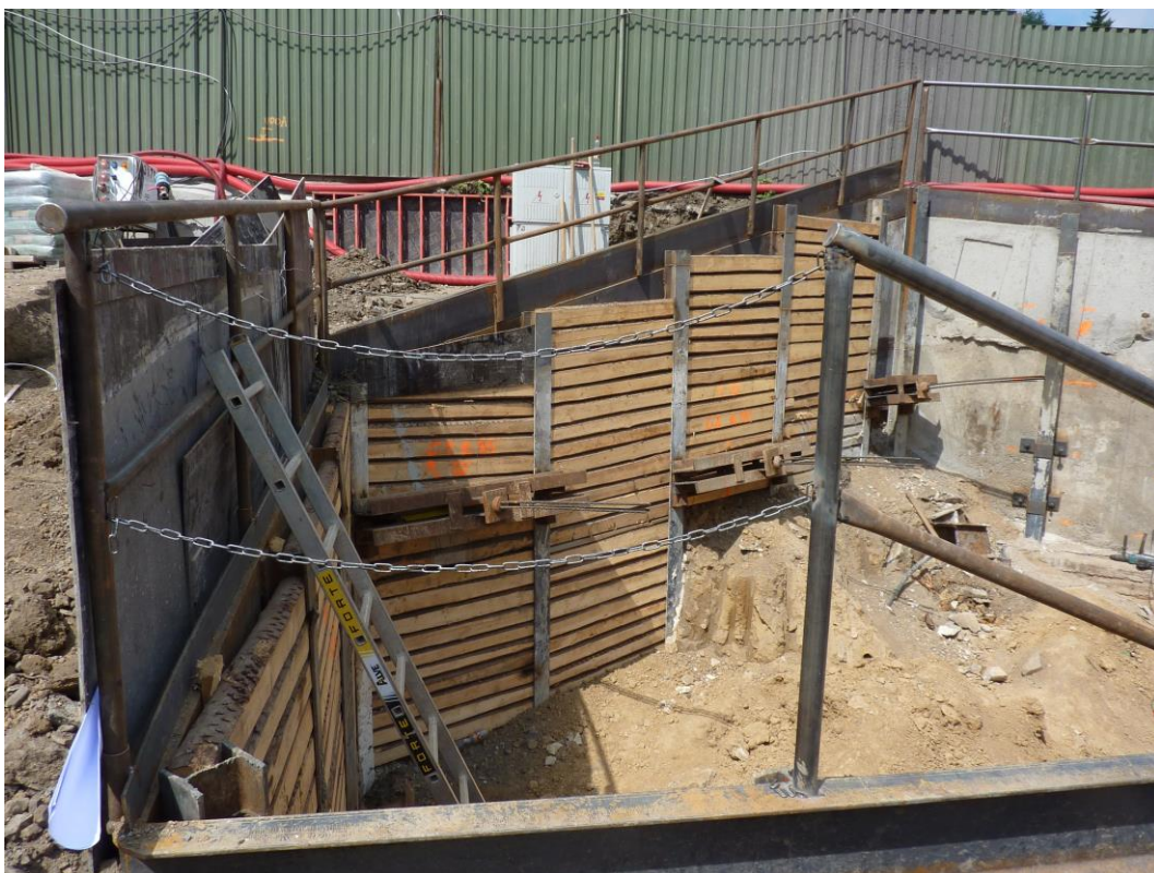
Fotografie č. 4 – Bezpečnostní zajištění po obvodu hloubené jámy vstupní šachty