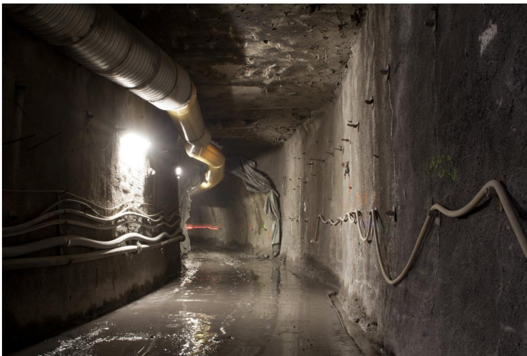
Fotografie č. 8 – Pohled do hloubené části štoly realizované odtěžováním pod stropní deskou