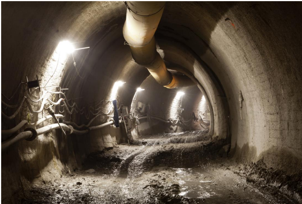
Fotografie č. 11 – Pohled do ražené části štoly