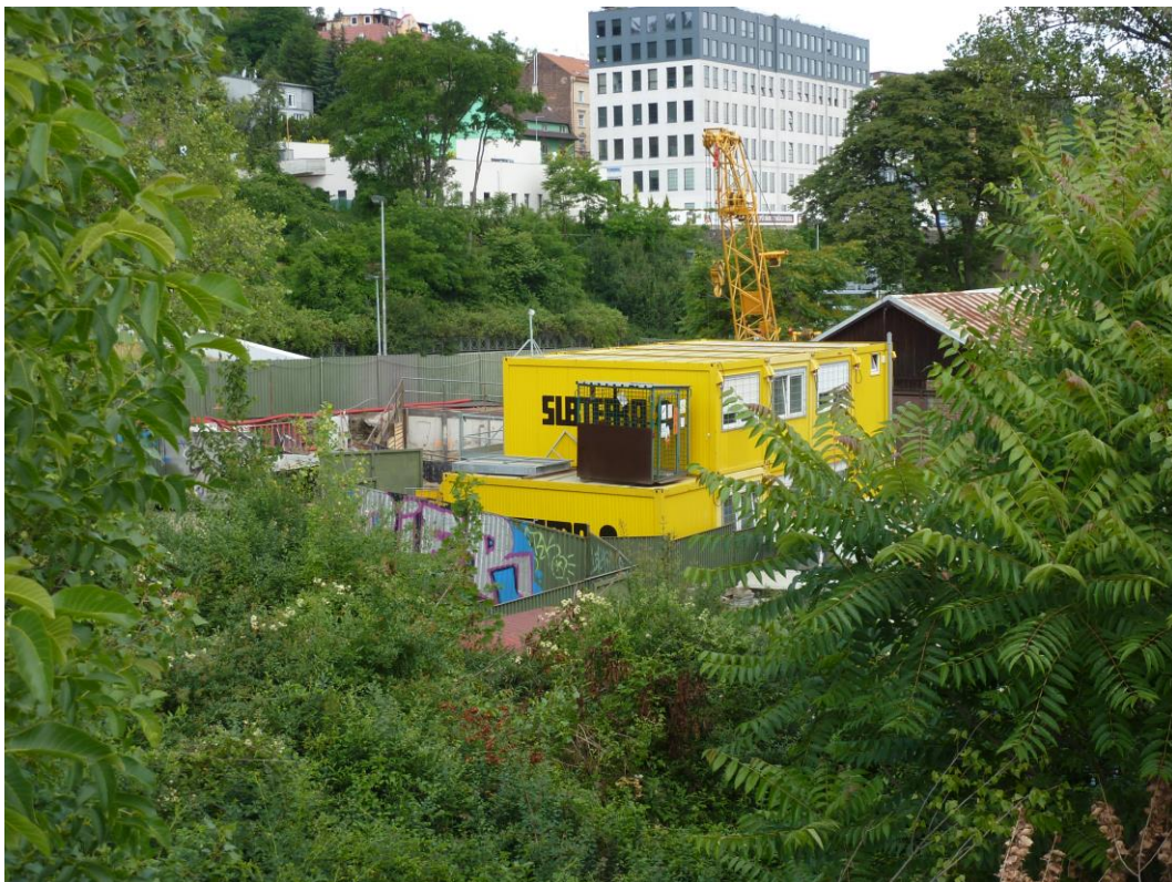
Fotografie č. 1 – Budování zařízení staveniště