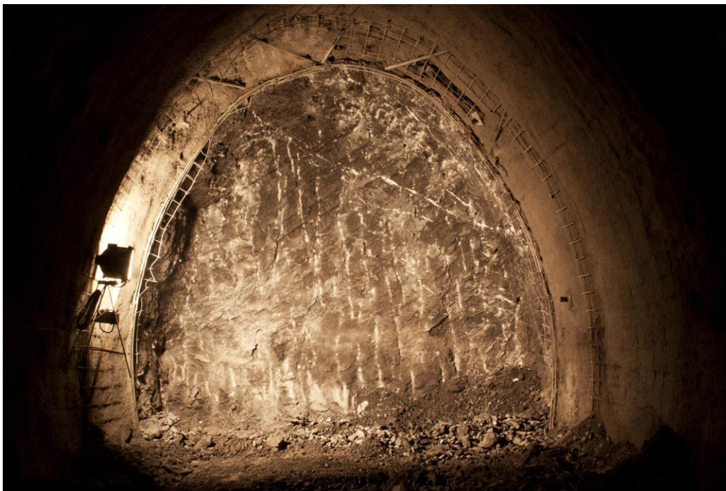
Fotografie č. 13 – Pohled na čelbu ražené části štoly