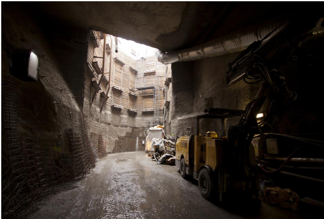
Fotografie č. 7 – Pohled z hloubené části štoly směrem k hloubené jámě vstupní šachty