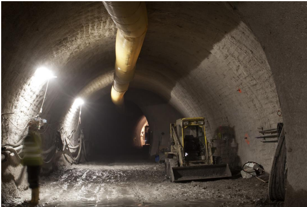
Fotografie č. 12 – Stavební práce v ražené části štoly