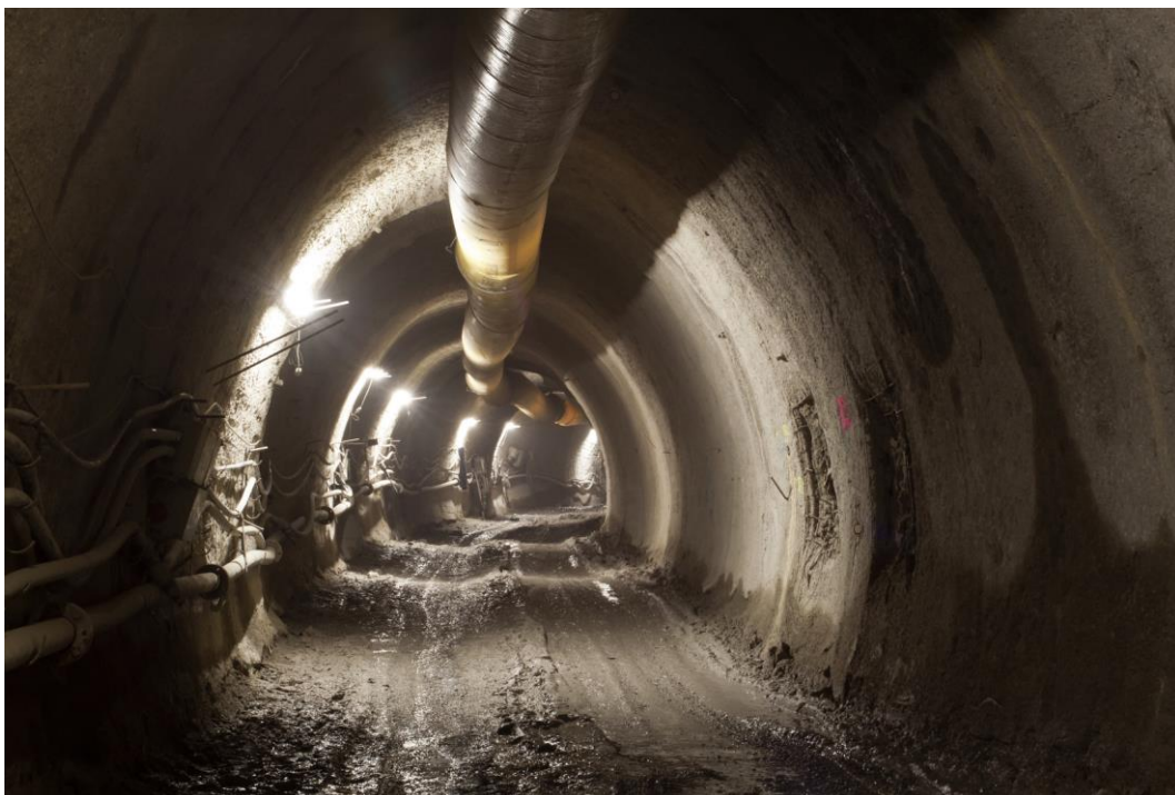
Fotografie č. 10 – Pohled do ražené části štoly