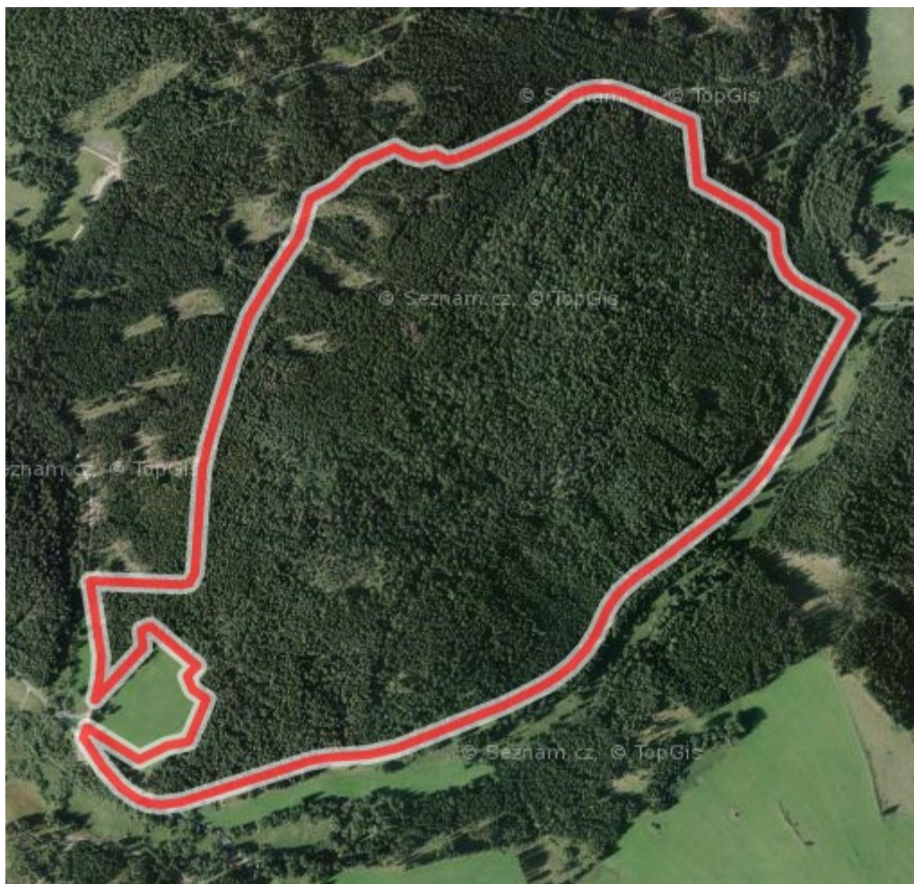
Obrázek 6: Letecká mapa NPR Pluhův bor v současnosti (2019)