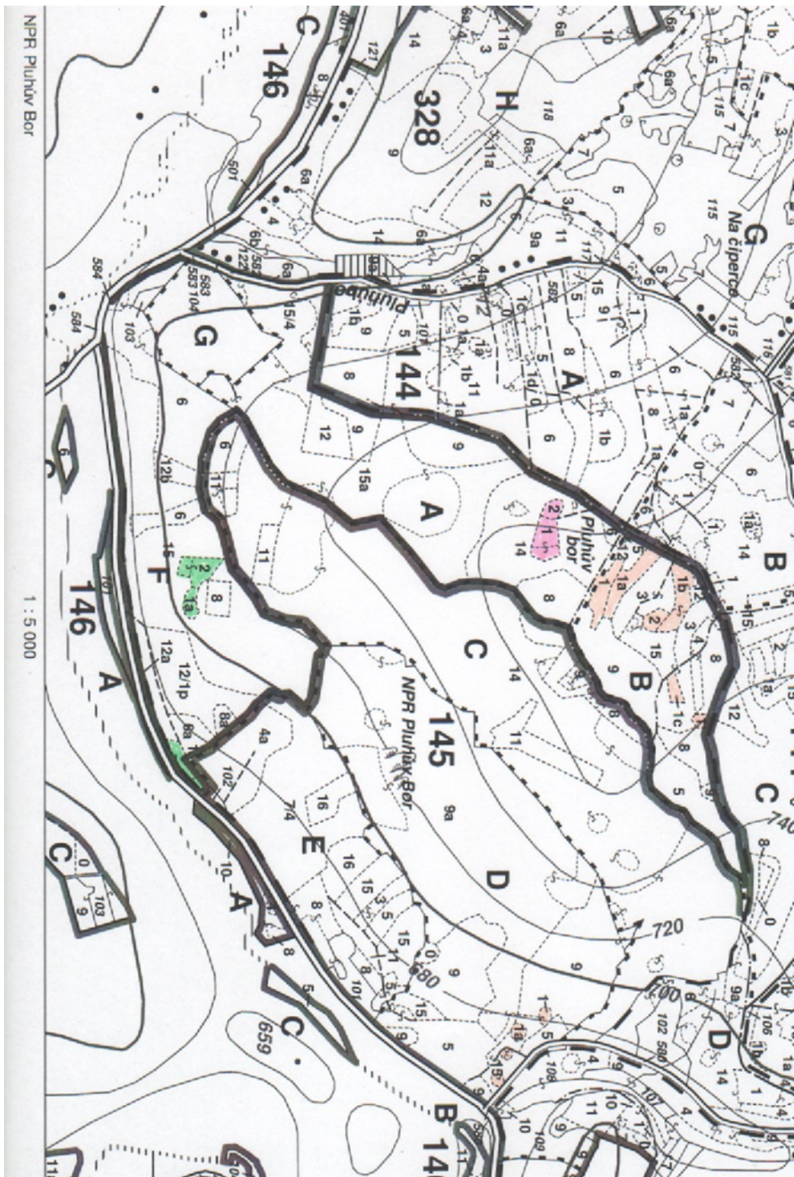
Obrázek 3: Současná porostní obrysová mapa NPR Pluhův Bor s vyznačenými zájmovými porostními skupinami, barevně rozlišenými podle stupně přirozenosti lesních porostů 1:5000