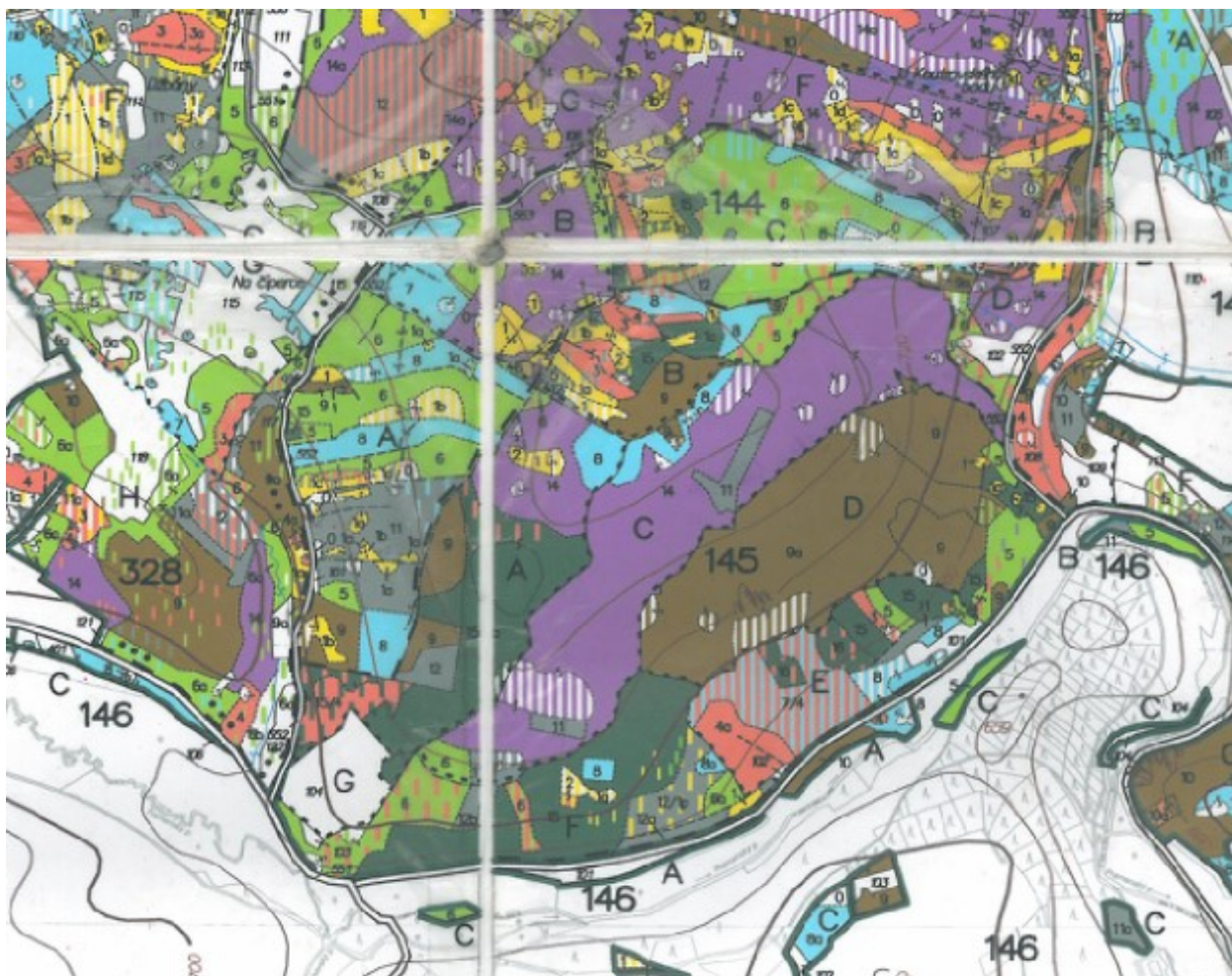
Obrázek 2: Současná porostní mapa NPR Pluhův Bor platná od 1. 1. 2014, 1:10000