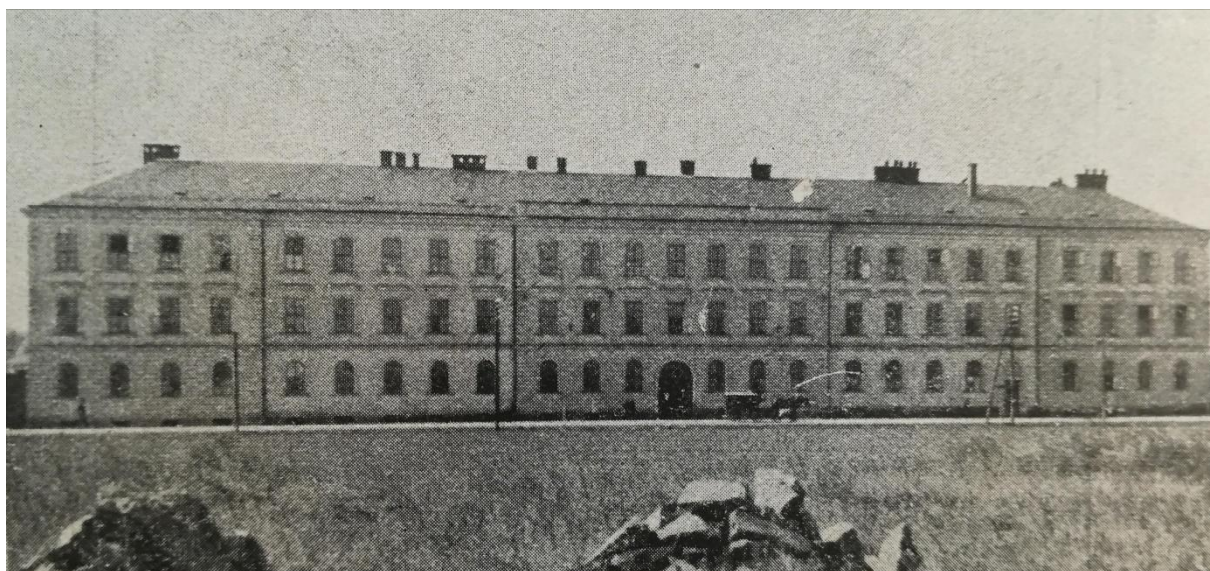
Šumperská věznice tzv. robotárna.