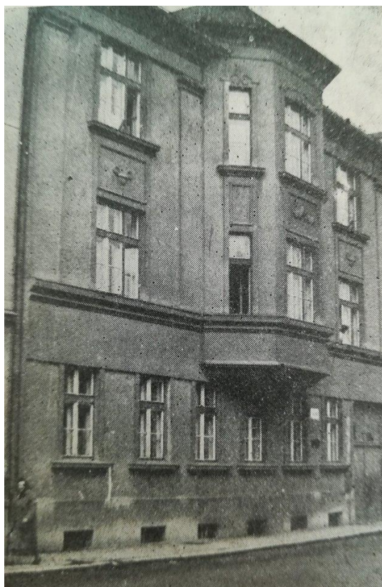
Sídelní a vyšetřovací budova šumperského gestapa.